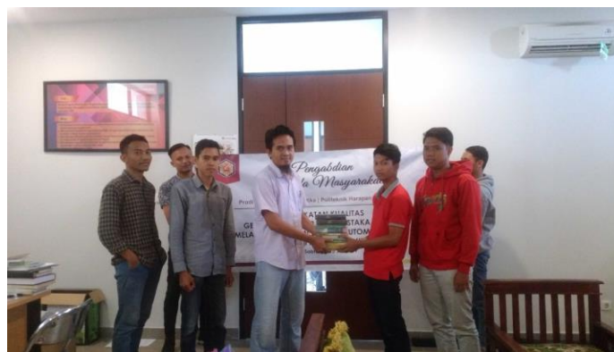
Gambar 2. Penyerahan Bantuan Buku

Adapun hasil dari pelatihan yang dicapai dapat dilihat pada Gambar 3 dan Gambar 4. Gambar 3 menunjukkan tampilan antarmuka dari SLiMS ketika selesai diinstalasi. Sedangkan Gambar 4 menunjukkan tampilan halaman antarmuka Librarian (Pustakawan). Halaman librarian tersebut digunakan untuk melakukan pengelolaan pustaka dengan segala fitur yang tersedia.