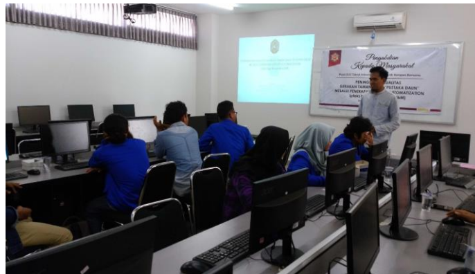
Gambar 1. Tim PKM memberikan pelatihan instalasi SLiMS