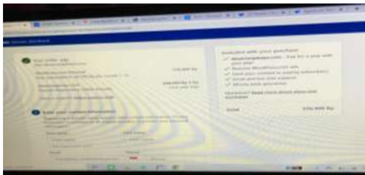
Gambar 2. Pemilihan aplikasi website dan hosting

Kami mulai mencari sumber-sumber website yang dapat dikelola dengan fitur yang memadai dan anggaran yang sesuai. Riset tersebut kami lakukan setelah mengamati beberapa fitur yang direkomendasikan di internet, akhirnya kami memilih Wordpress berbayar sebagai website desa yang akan dibuat. Kami menginformasikan sekaligus mendiskusikan dengan pihak Kepala Desa terkait informasi untuk pemilihan website yaitu Wordpress , fitur yang ditawarkan serta harga yang dikeluarkan yang dibandingkan dengan website gratis. Keputusan Kepala Desa yaitu memilih pada pilihan website berbayar karena memiliki domain yang mudah diingat. Setelah itu kami juga meminta informasi seperti lembar profil desa sebagai bahan untuk diletakkan di dalam website .