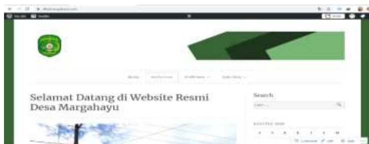
Gambar 3. Website Desa Margahayu Kec. Loa Kulu, Kab. Kutai Kartanegara

Sebelumnya kami membuat akun email sebagai email yang terhubung pada website . Setelah itu dilanjutkan dengan buat akun Wordpress yang meliputi nama, password dan email . Kemudian diarahkan memilih pilihan paket untuk domain dan Wordpress plan untuk setahun dan disini kami memilih paket personal dengan fitur yang ditawarkan adalah domain premium, menghilangkan iklan Wordpress , layanan email dan live chat , garansi uang kembali, membatasi konten anda kepada subscriber . Paket ini dimulai dengan harga 44.700 x 12 bulan = 536.400. Dilanjutkan dengan pembayaran, kami langsung mengonfirmasi email yang akan digunakan dan akun website telah dapat digunakan. Setelah itu kami mulai memilih tema website , menambahkan pilihan fitur informasi desa serta menambahkan data-data desa yang terkait. Alamat web dari Desa Margahayu ini yaitu https://desamargahayu.com/ .