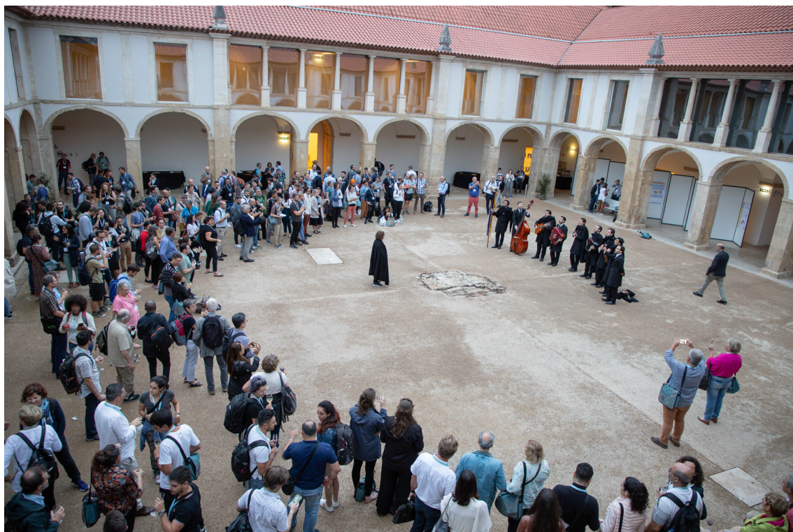
Foto 9 Atuação da Estudantina para os participantes.