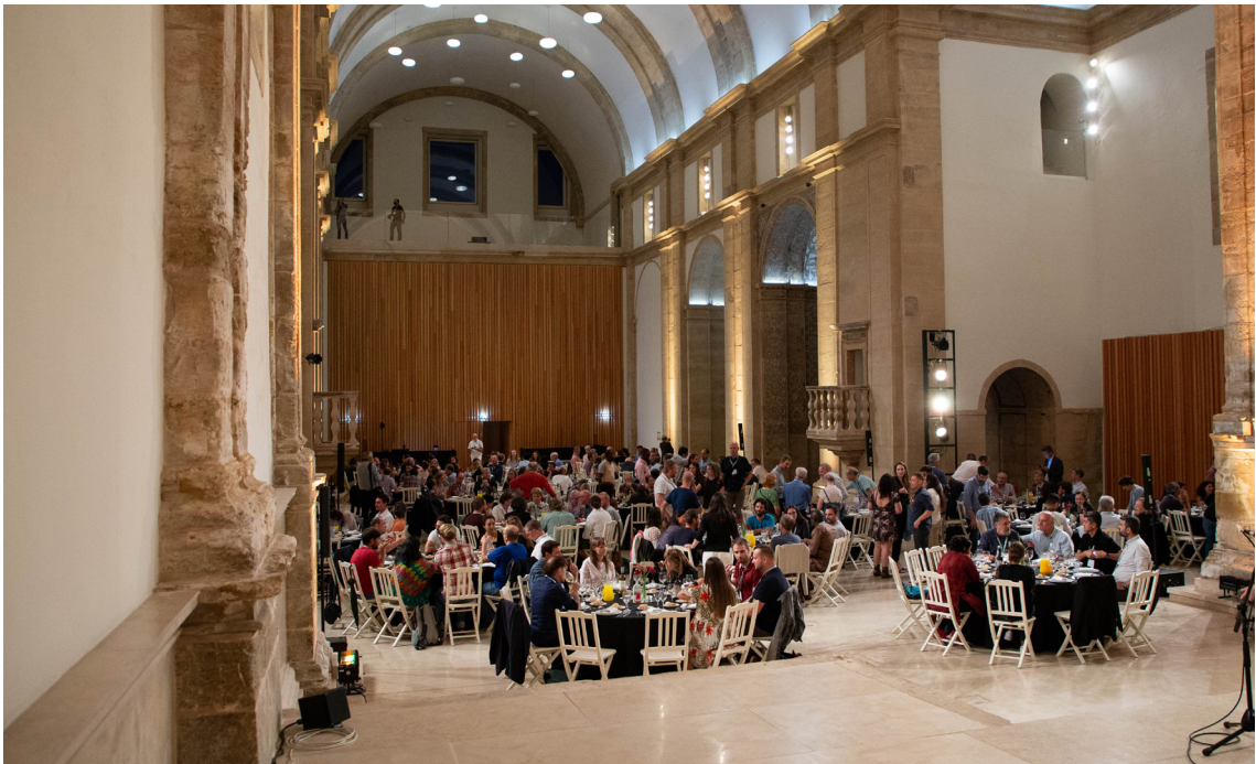
Foto 7 Aspecto do jantar social.