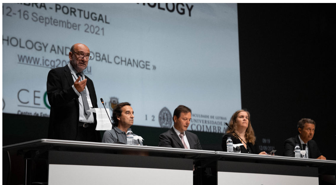
Foto 1 Mesa da sessão de abertura da Conferência.