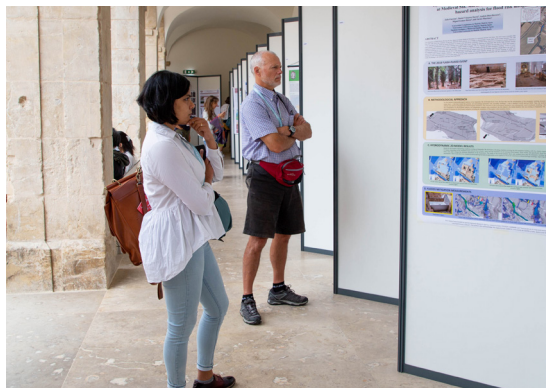
Foto 4 Exposição de posters.

de cada sessão. Segundo as informações disponibilizadas pelos conveners , estão já formalizadas 9 colaborações com prestigiadas revistas internacionais de Geomorfologia e de Ciências da Terra para publicação dos melhores trabalhos apresentados na Conferência. Está ainda prevista a publicação de um volume com os resumos alargados (até 6 páginas, com revisão por pares) na ASTI Book Series (SPRINGER) . Espera-se, com estas publicações, dar mais visibilidade e a