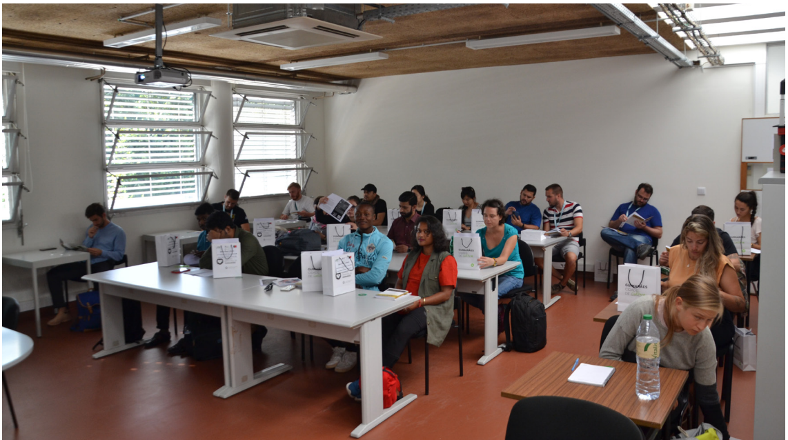
Foto 6 Curso Intensivo realizado na Universidade do Minho.