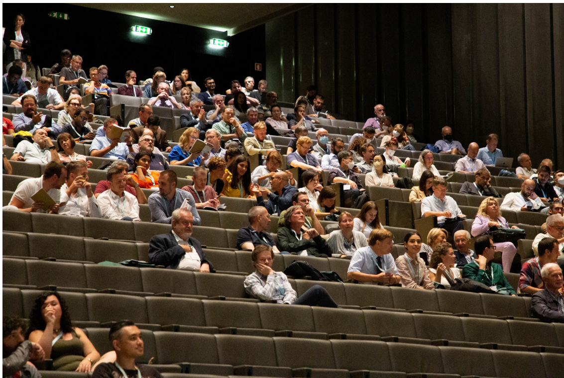
Foto 2 Plano geral do Grande Auditório do Convento de S. Francisco.