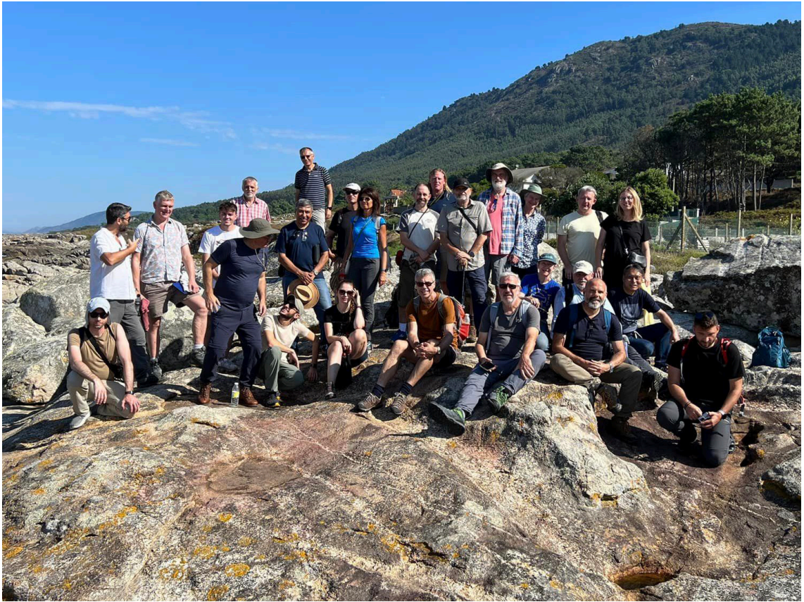
Foto 5 Grupo que participou na visita pós-Conferência ao Minho e Galiza.