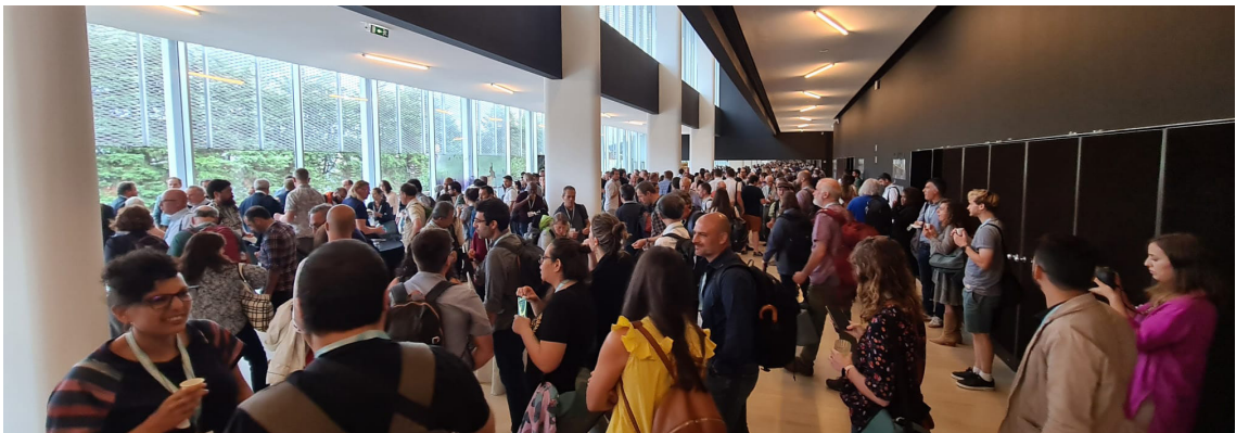
Foto 8 Conferencistas durante um coffee break .

no final dos trabalhos dos dois primeiros dias e um jantar social na noite de quinta-feira. A música tradicional de Coimbra, muito ligada à sua vida estudantil, foi proporcionada através da presença de um grupo musical de estudantes (Estudantina), que acompanhou o welcome drinking , e de um grupo de fados de Coimbra, que nos acompanhou durante o jantar social. Esperamos que os participantes na Conferência tenham levado consigo um pouco de Coimbra e da sua cultura no regresso às suas casas.