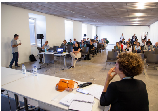
Foto 3 Sessão de apresentação de comunicações.