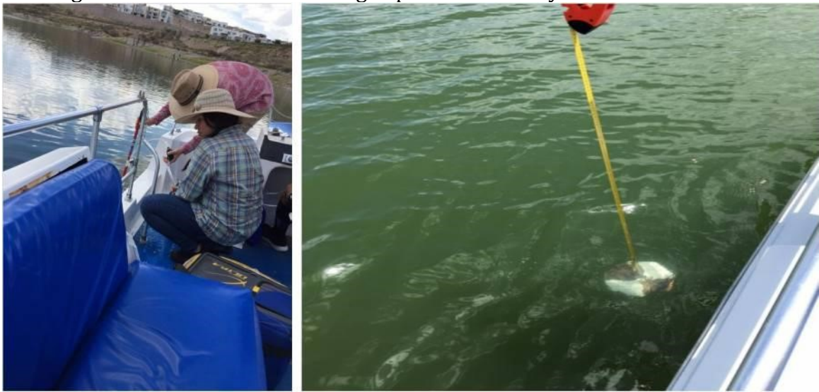
Figura 4. Toma de muestra de agua para clorofila A y medición de turbidez

La colección de las muestras se realizó a bordo de una lancha y fueron tomadas en la zona fótica, a 50 cm de profundidad (Figura 4a), se obtuvieron 600 ml de agua por muestra para ser filtrados, cantidad suficiente recomendada para el muestreo de fitoplancton en lagos. Las muestras se colocaron en envases protegidos de la luz y trasladadas en hieleras para ser filtradas lo más pronto posible, ya que la concentración de clorofila puede cambiar en cortos periodos de tiempo y en exposición de luz. Además, se midió la turbidez con un disco secchi en cada punto de muestreo registrando la visibilidad del mismo, esto se realizó tomando dos lecturas, la primera lectura es cuando se perdía de vista y la segunda cuando se volvía a observar, promediando ambas lecturas, realizándose en cada punto de muestreo (Figura 4b).