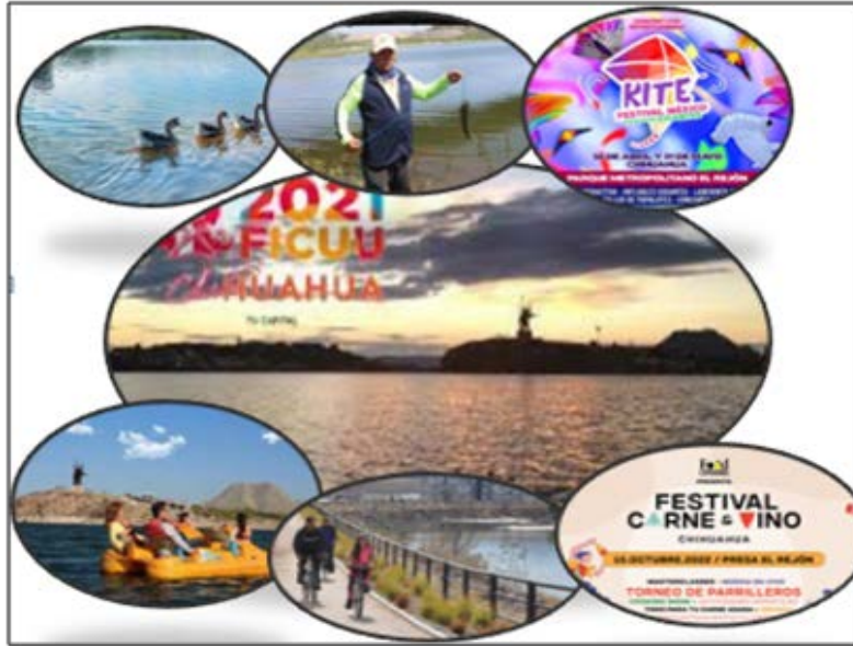
Figura 2.-Actividades deportivas, recreativas y culturales de la presa El Rejón