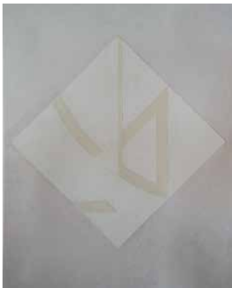
Figura 1 - Fernando Lanhas, O37-66, 1966.

Óleo.