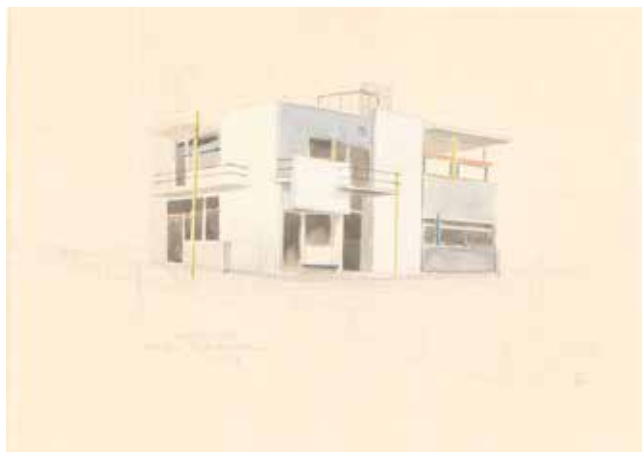
Figura 5 · Desenho de Fernando Lanhas, Perspetiva - Rua António Nobre, Porto, s.d. Caneta sobre papel. Fonte: Espólio de Fernando Lanhas na Fundação Instituto Marques da Silva, Porto.