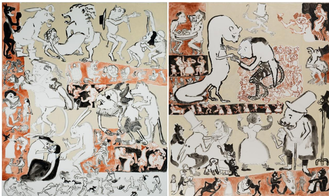
Figura 1 . Paula Rego (1983), Rigoletto (da série Óperas). Acrílico sobre papel, 239 x 202 cm. Casa das Histórias, Cascais, Portugal.

É a prática do desenho que a artista sempre manteve, bem como o interesse nos contos populares portugueses, o que lhe permitiu deixar a colagem em finais de setenta e trazer com autoridade, o desenho para a tela na série Óperas em 1983. As circunstâncias da realização desta série, consistiram em ter surgido a oportunidade de participar numa exposição coletiva em Nova Iorque intitulada "Eight for the eighties". Esta exposição foi comissariada por Moira Kelly, que sugeriu o tema à artista sabendo que Paula tinha assistido a várias óperas com seu pai. A participação dependia, no entanto, de ser capaz de produzir uma série de grandes telas em apenas quatro meses, a tempo da exposição, o que exigiu da artista pragmatismo e eficácia. A resposta de Paula foi substituir a pintura pelo desenho.