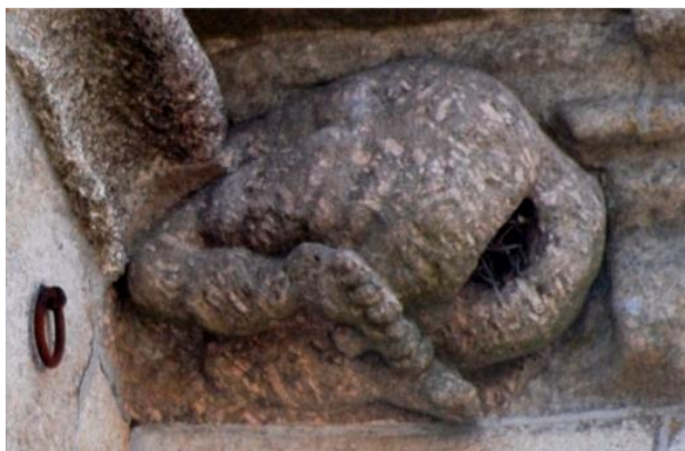
Figura 7 . Autor desconhecido (Séc. XIV). Gárgula da Sé da Guarda.

Paula Rego assume-se como continuadora da tradição visual grotesca portuguesa que teve expressões mais antigas como as gárgulas das igrejas medievais. Figurações que, tal como o imaginário dos contos populares portugueses, quando comparados com os equivalentes europeus são muito mais cruéis e sórdidos, como vem chamando atenção a artista.