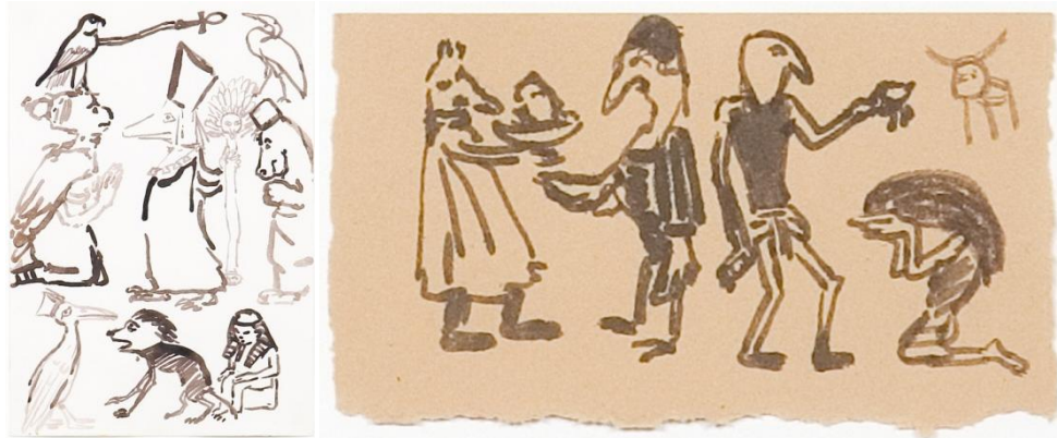
Figura 6 . Paula Rego (1983), Estudos para Aida (da série Óperas). Tinta sobre papel, 20,7 x 14,3 cm. Casa das Histórias, Cascais, Portugal.

disse referindo-se às mulheres musculadas, masculinas, exaustas e cheias de carácter das suas obras: "Ah yes, grotesque beauty. The Portuguese have a culture that lends itself to the most grotesque stories you can imagine" (Hattenstone, S., 2009).