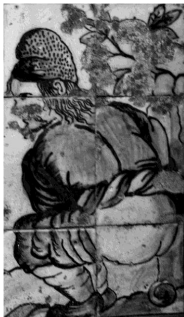
Figura 5. Autor desconhecido (Séc. XVII). Painel de azulejos, cerca de 30 x 20 cm. Palácio de Fronteira, Monsanto, Portugal.