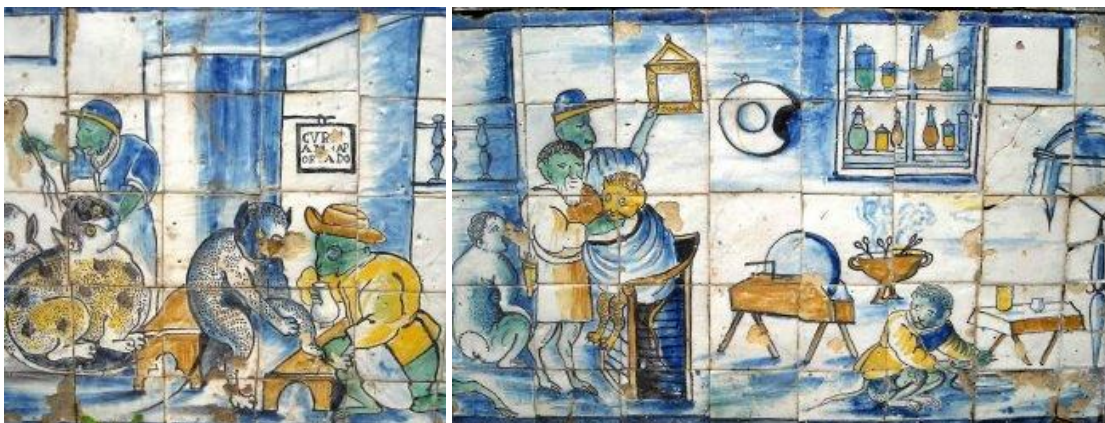
Figura 3 . Autor desconhecido (Séc XVII) Macacarias. Painel de azulejos, cerca de 50 x 21 cm. Palácio de Fronteira, Monsanto, Portugal.

As semelhança das Óperas com este painel são várias, e colocam-se tanto a nível técnico e formal como a nível semântico. Desde logo, a técnica do desenho é muito semelhante por tratar-se em ambos os casos de tinta aplicada com pincel, vivendo as figuras essencialmente do contorno linear das suas formas. No painel azulejar observa-se o uso restrito de cores composto pelo azul e o amarelo, e o uso pontual do verde. Também as pinturas de Paula Rego são resolvidas praticamente a duas cores: o preto e o vermelho e uso pontual do bege.