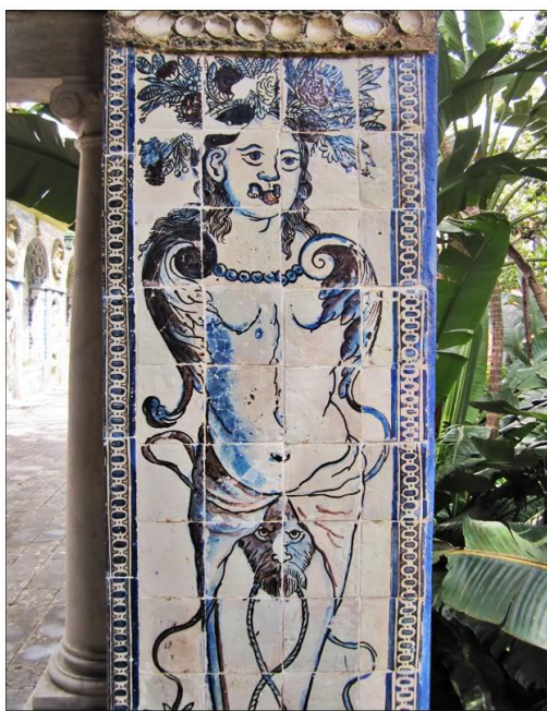
Figura 4. Autor desconhecido (Séc XVII) Painel de azulejos, Palácio de Fronteira, Monsanto, Portugal.

A série Óperas marca, na obra de Rego, a emergência de um universo feito de seres animais e humanos que interagem em igualdade de circunstâncias. Verifica-se que o painel das macacarias usa o mesmo dispositivo de transformação das personagens da narrativa em animais. Se no caso das óperas se seguem os libretos correspondentes, aqui coexistem macacos verdes vestidos à época e gatos em pelo. Os gatos vão à escola de música, ao médico e ao barbeiro. Apesar da piada da situação os gatos (crianças) têm um ar triste e sujeitam-se à disciplina imposta pelos macacos (adultos). Também nas Óperas, segundo Leonor Oliveira (2013) "a pintora salientou os conflitos humanos e o carácter trágico-cómico deste género.... elegeu situações que, muito de acordo com o processo que caracteriza o seu trabalho, rebaixa ao nível mais popular da representação teatral." Temos portanto, em ambos os casos, referentes literários que vão beber à fábula e à tragédia, géneros que remontam à cultura grega clássica.