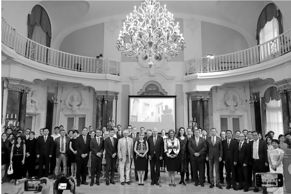
15 éves jubileumi gála az Aula Magnában 2022. június 21-én.

egyéni teljesítmény elismerésének örülhet. Létrehozta az egyetlen, kínaiak által elismert hivatalos regionális tanárképző központot, és megalapította a Középkelet-európai Kínai Tanárok Szövetségét. Az Intézet a Konfuciusz Könyvtár sorozatban 7 tudományos monográfiát, 2007 óta 18 Konfuciusz Krónikát jelentetett meg, továbbá támogatta a Távol-keleti Tanulmányok című folyóirat megjelenését, amelyből 2010 óta 21 szám látott napvilágot.