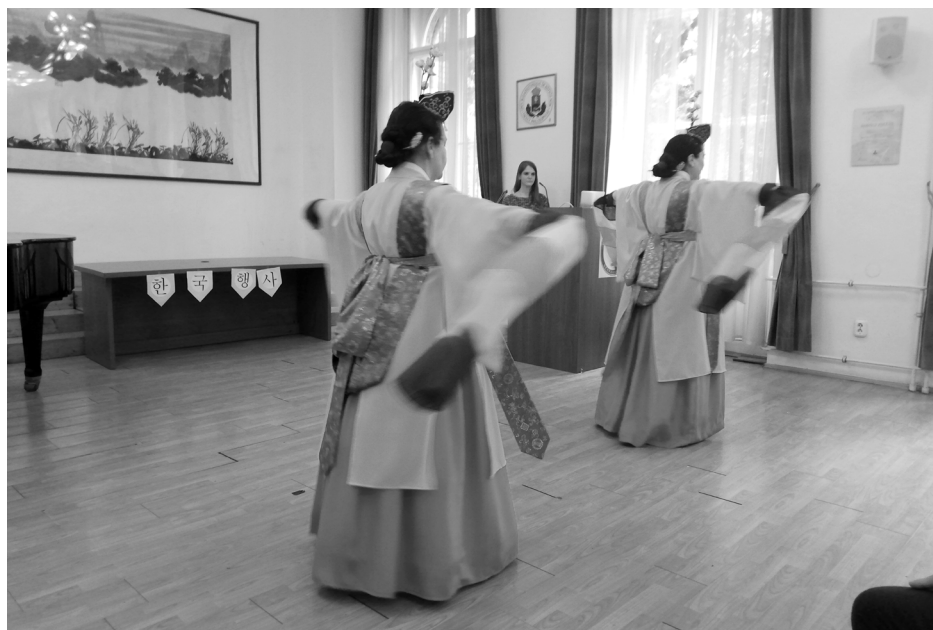
A Mugunghwa táncgyűttes előadása.

Az I. koreai fesztivál ötlete a tanszék oktatóiban fogalmazódott meg a COVID-időszak utáni élő oktatás újraindításának az öröme. Céljuk az volt, hogy összehozzák a koreai szak különböző évfolyamaira járó hallgatóit, különös tekintettel az egyetemet a karantén időszaka alatt elkezdő fiatalokra, hogy interaktív, színes programok keretében személyesebb formában ismertessék meg velük a koreai kultúra különböző területeit.