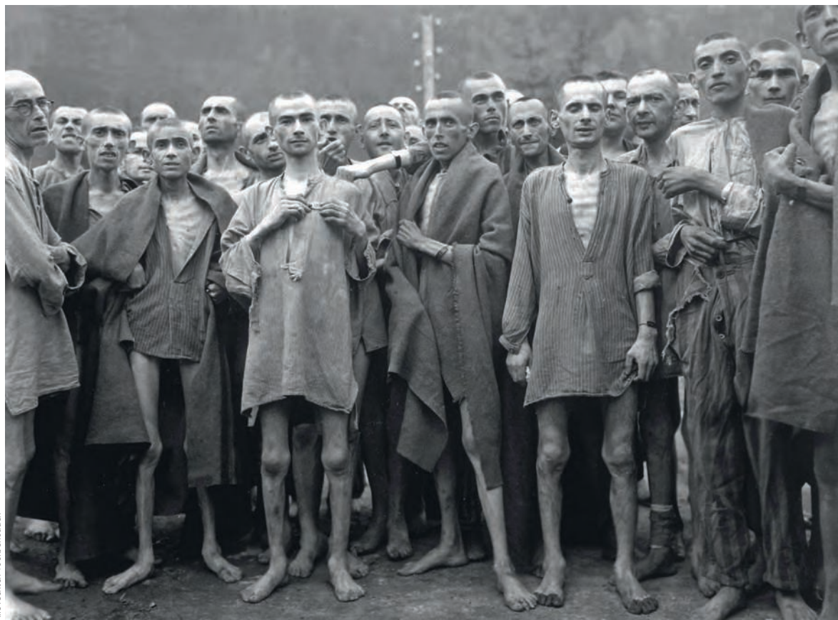
Alle rechten voorbehouden

algemeen geen plaats voor de slachtoffers (zie bijvoorbeeld Karstedt, 2008, p. 15). Ook al is deze uitspraak nogal apodictisch, de slachtoffers hadden er effectief geen enkel echt statuut en konden in die zin ook geen aanspraak maken op rechten. Ze genoten geen bescherming, waren geen partij in het geding en hadden geen recht op schadevergoeding. De enige manier om hun stem te laten horen, was als getuige, maar slechts een minderheid werd opgeroepen om te getuigen. Door de documenten die waren nagelaten door de nazitechnocratie, waren getuigenissen overbodig (zie meer bepaald Moffett, 2012.). De aanklagers konden dus de essentie van hun argumentatie baseren op de documenten die de Duitse administratie had nagelaten. De enige slachtoffers die het collectieve beeld hebben gevormd gedurende de processen die sommigen als de eerste internationale strafprocessen bestempelen, zijn niet degenen die hebben getuigd. Het zijn veeleer degenen die op de beelden van de Amerikaanse strijdkrachten bij de bevrijding van de concentratiekampen staan (Stevens, 1945). De slachtoffers verschijnen, zonder te spreken, om aan de