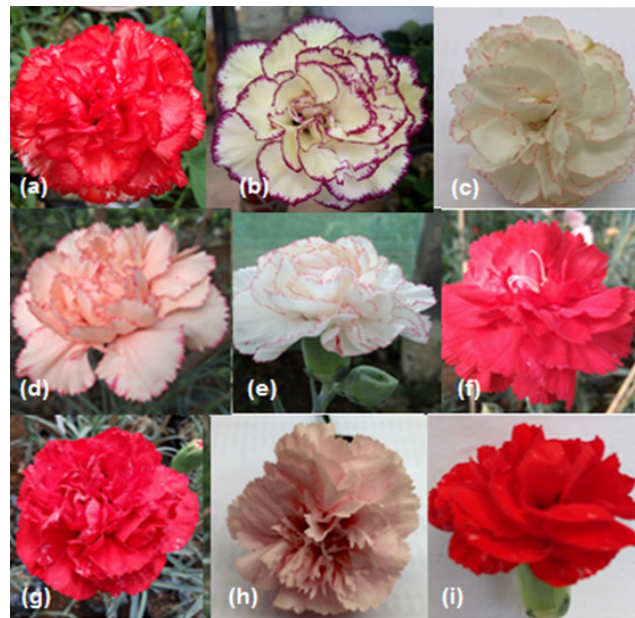
Gambar 1. Klon-klon anyelir hasil persilangan, (a) D 1.1, (b) D 3.13, (c) D 5.1, (d) D 5.4, (e) D 5.5, (f) D 8.5, (g) D 8.8, (h) D 13.13 dan (i) D 13.14