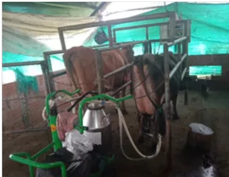
Figura 3. Área de ordeño, Martínez O, (2022).

OSMAR1673 6 DE DICIEMBRE DE 2022 03:54 UTC