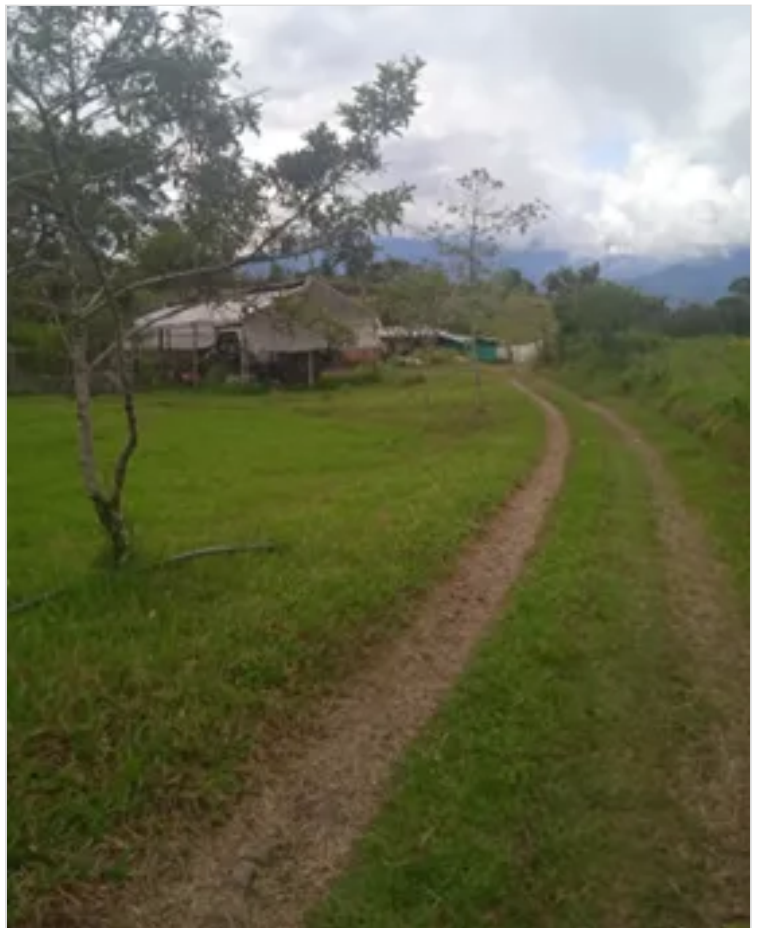
Figura 6. Praderas de pastoreo, Martínez O, (2022).

OSMAR1673 6 DE DICIEMBRE DE 2022 04:15 UTC