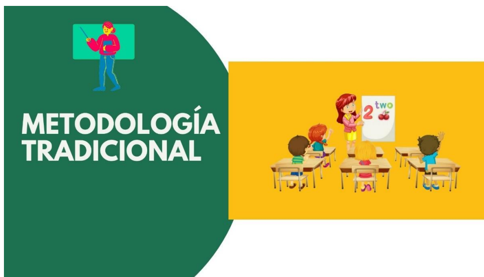
Ilustración 1. Metodología tradicional. Elaboración propia

He seguido trabajando con esta metodología ya que es la que se estaba utilizando dentro del aula cuando yo llegué, y también porque el alumnado que tenía era muy inseguro, por lo que tenía que ser de guía en todo momento. ¿Si no hubiese sido guía dentro del aula el alumnado habría aprendido más? Pienso que es un paso muy grande el que deben de dar, por eso yo en mis actividades he intentado ir introduciendo principios de otras metodologías para que se fuesen acostumbrando, pero creo que es un proceso que lleva su tiempo y no se lo podía cambiar yo en varios meses que he estado con ellos. En esta metodología se usa las explicaciones y los libros de texto, personalmente pienso que los libros de texto es otra cosa que con el paso del tiempo va a ir desapareciendo.