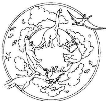
Ilustración 5. Mandala. Extraído de Pinterest

También añadiría una mejora, que sería trabajar durante más tiempo dicho proyecto, ya que se afianzará de una mejor manera. Pero es cierto que debido al miedo de que nos cortase las clases por el covid-19, no quise alargar la extensión de las actividades y solo lleve a cabo esas actividades.