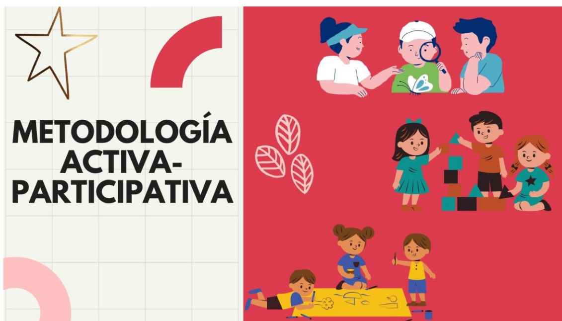
Ilustración 2. Metodología Activa- Participativa. Elaboración Propia

Por otro lado, la metodología activa-participativa tiene un enfoque más globalizador, ya que se centra en el desarrollo de las capacidades generales del alumnado. En esta metodología el docente es el encargado de coordinar la clase y el alumnado es el que hace el papel central, teniendo contacto con el medio, aprendiendo a través del aprendizaje autónomo. Es cierto que para trabajar la creatividad es bastante mejor la metodología activa-participativa, ya que en todo momento el alumnado está experimentando y practicando con el medio que nos rodea. Pero ¿Cómo pasar a trabajar de dicha manera con el alumnado que no está acostumbrado? La verdad que ha sido un poco complicado, ya que el alumnado no estaba hecho a ese tiempo de metodología y se sentía perdido en varias ocasiones, cuando no se daba una explicación exacta de lo que debían de realizar, sino que en todo momento esperaban unas órdenes y cumplirlas. Pero después de trabajar en varias ocasiones con dicho método, fue algo más cómodo y pienso que como la seño iba a seguir trabajándolo iba a ser muy interesante para el alumnado, ya que de esta manera aprenden muchísimo más.