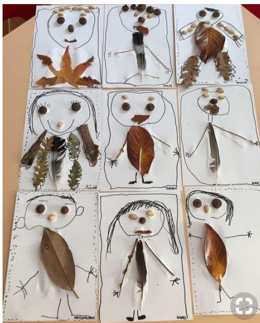
Ilustración 6. Ejemplo actividad.

En esta podemos observar cómo se quedaría la actividad una vez realizada por el alumnado.