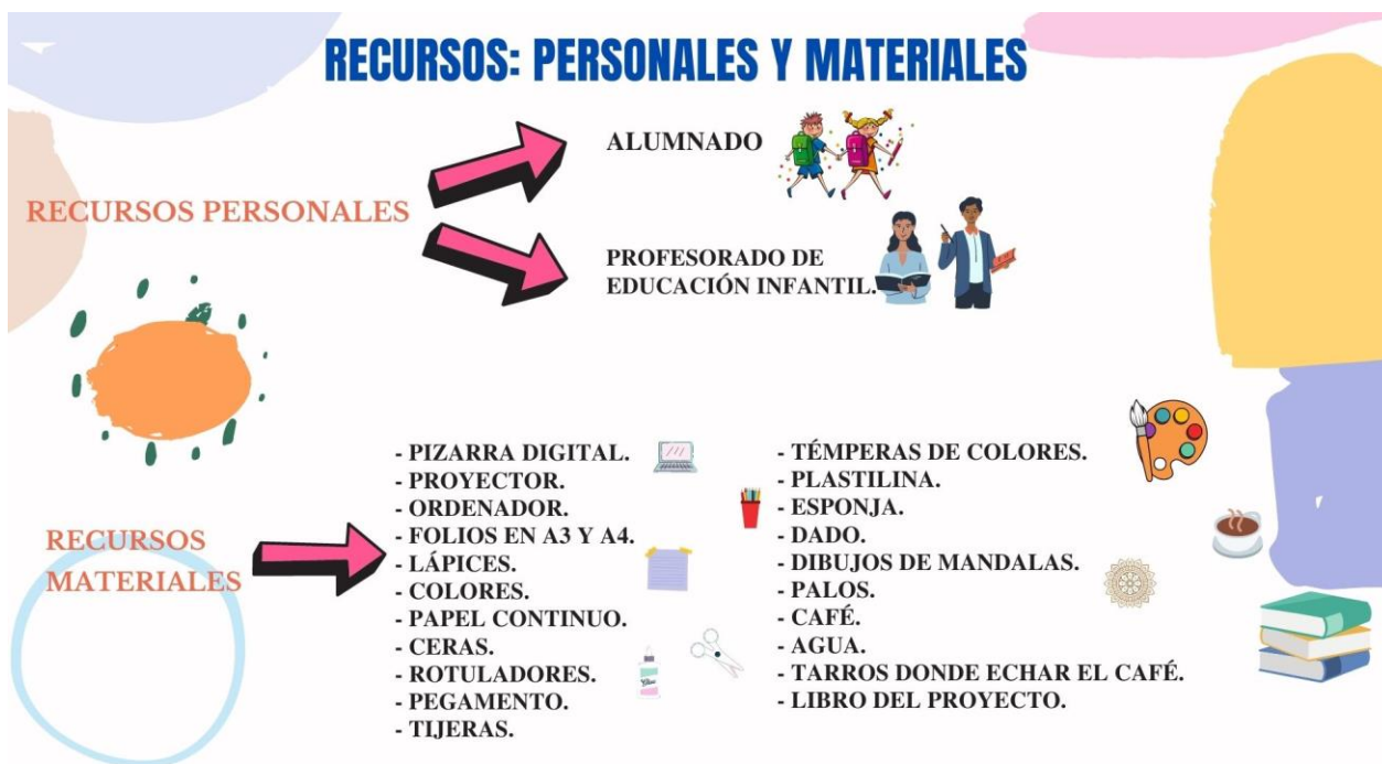
Ilustración 3. Recursos. Elaboración propia