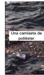
Story 5 113 visualizaciones