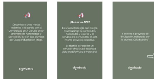
Story 1 131 visualizaciones

1. Carrusel de publicaciones en stories de Instagram.