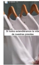
Story 4 116 visualizaciones