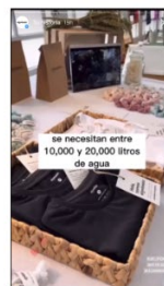
Story 3 120 visualizaciones