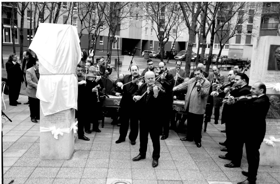
3. kép. A Muzsikus cigányok parkja avatóünnepsége 2013. október 26-án.

elfogadott, és a magyar kultúra részét képezi. Ezen túl pedig nem csupán a fővárosi, hanem az ország minden roma fiatalja számára példaképként szolgálhat. 73