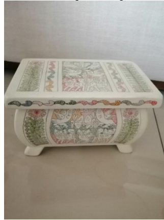
Caja de Olinalá