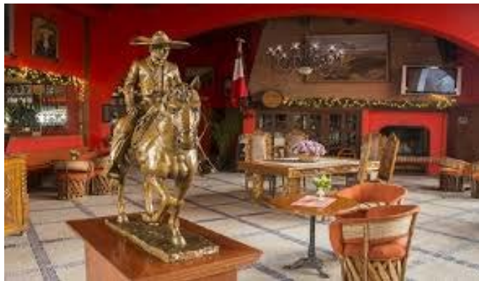
Figura3: Mobiliario en la Hacienda el Parián en Toluca

El Mobiliario novohispano en México aún cuenta con diversos ejemplos, como el ubicado en haciendas y hoteles ubicados en edificios considerados patrimonio histórico y cultural., algunos de estos muebles continúan ejerciendo como referentes para la elaboración de productos actuales como los muebles tradicionales de Guerrero elaborados en cedro blanco y rojo, los de San Luis Potosí o del Estado de México, que aún conservan referentes estilísticos del mobiliario de las antiguas haciendas novohispanas.