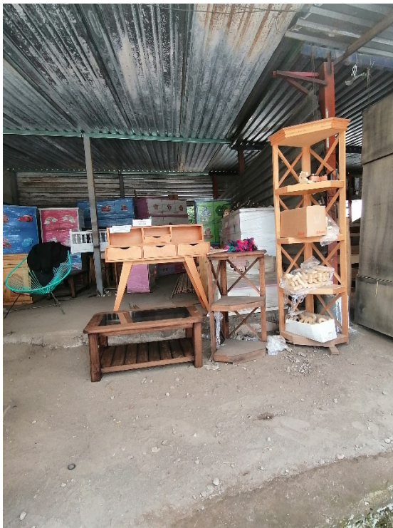
Figura 6. Locales semiabandonados con escasa mercancía tradicional en Tenancingo. Cabecera municipal.

Durante la conquista, fue evangelizado en primera instancia por los frailes agustinos y perteneció a la encomienda del español Juan Salcedo, es hasta 1800 que los frailes carmelitas inician la construcción del actual convento del Carmen, importante inmueble de la región y en 1878, se le da el rango de Ciudad de Tenancingo.