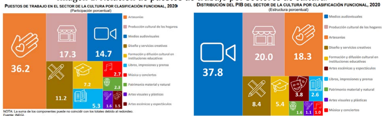
Imagen 1. Relación de puestos de trabajo por sectores de cultura.