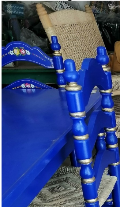
Figura5. Mobiliario de Tenancingo con referentes neoclásicos

La cultura novohispana se divide en cuatro etapas principales que ofrecen referentes estilísticos característicos de la sociedad, de la economía, y del nivel tecnológico. El primer referente formal se basa en los estilos del Renacimiento que corresponden con los primeros objetos traídos por los españoles durante la conquista, posteriormente y el más difundido en México es el Barroco que inspira las piezas torneadas con carretel y botón que actualmente se siguen empleando en las sillas tradicionales. Los dos últimos estilos de esta época son el Neoclásico y Romántico que emplean en el mobiliario las patas en línea recta y con esferas como remates de algunos elementos estructurales. El identificar estos estilos en el mobiliario tradicional posibilita estructurar una narrativa que fundamenta el patrimonio cultural de la región.