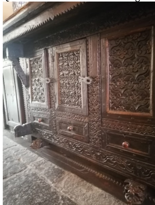
Figura 4. Mobiliario del Lobby del Hotel Quinta Real de Puebla de los Ángeles

http://federaciondehaciendas.org/hacienda-del-parian/