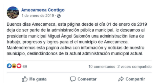
FIGURA 2. PÁGINA DE FACEBOOK

El Ayuntamiento, acorde con la tecnología y la comunicación que posibilita, ha establecido páginas de Facebook, por ejemplo, la administración 2016-2018 contó con la página Amecameca contigo , en donde a través de diferentes publicaciones daba a conocer acontecimientos relevantes de la administración pública municipal. Dicha página se mantuvo vigente desde el 27 de diciembre de 2015 hasta el 01 de enero de 2019 (figura 2).