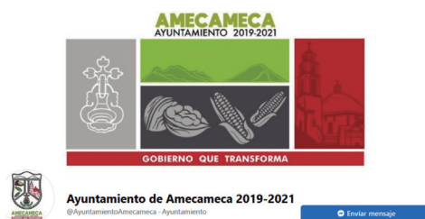
FIGURA 3. PÁGINA DE FACEBOOK

Ayuntamiento de Amecameca 2019-2021 es el título de la página de Facebook que utiliza la administración 2019-2021 (figura 3).