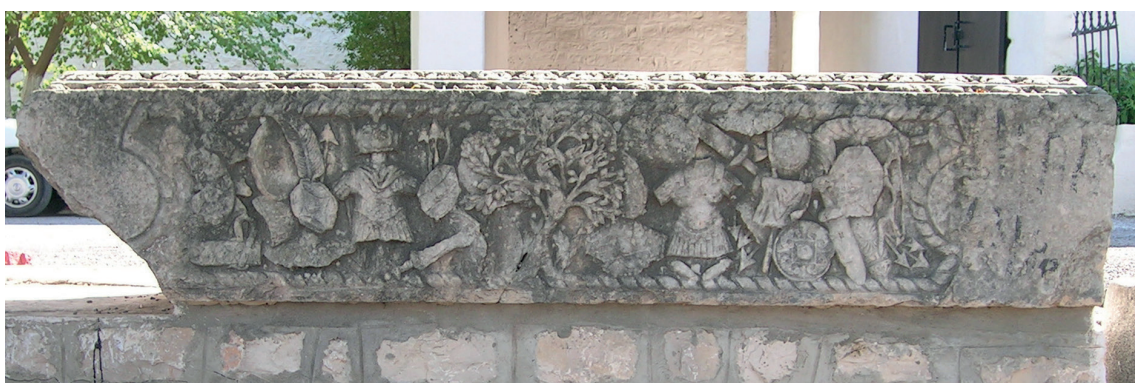
Fig. 8. Téboursouk, Délégation . Elemento del fregio-architrave del Capitolium di Numluli, dettaglio del soffitto con un fregio d'armi.