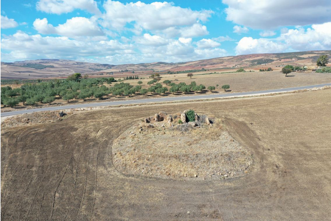
Fig. 11. La terrazza con il tempio a corte, da Est.