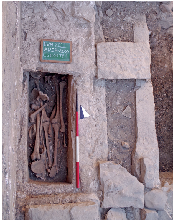
Fig. 28. L'interno della tomba lungo la parete settentrionale del mausoleo, dopo lo scavo parziale del riempimento.