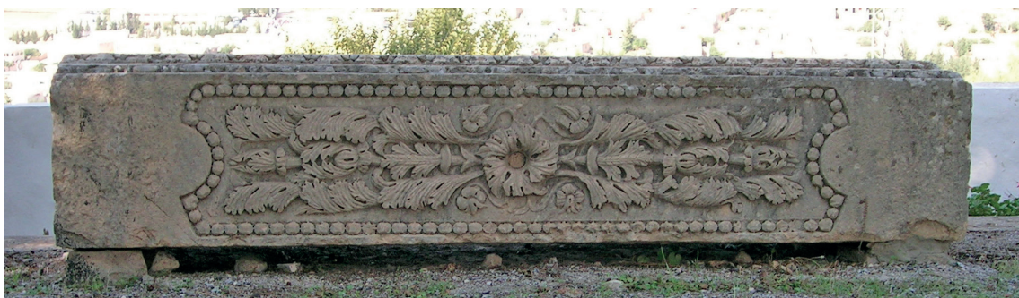
Fig. 9. Téboursouk, Délégation . Elemento del fregio-architrave del Capitolium di Numluli, dettaglio del soffitto con una decorazione vegetale.