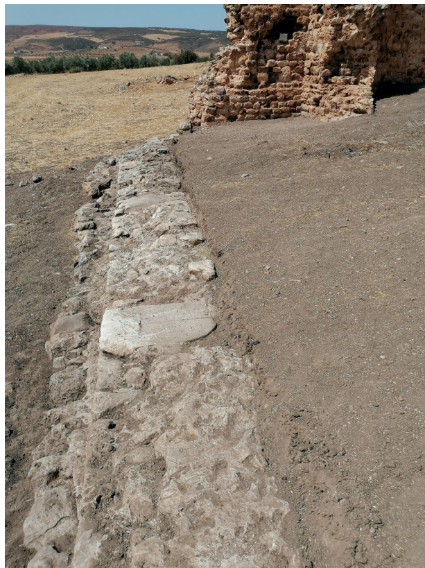
Fig. 23. Il lato meridionale della basilica con le fondazioni rinforzate; nel muro è reimpiegata una stele funeraria centinata