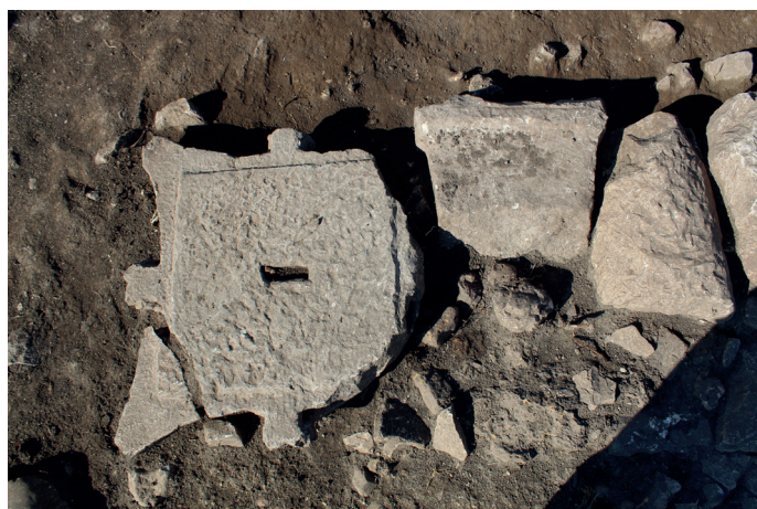
Fig. 16. Il capitello corinzio reimpiegato come elemento costruttivo nell'edificio medievale, in corso di scavo.