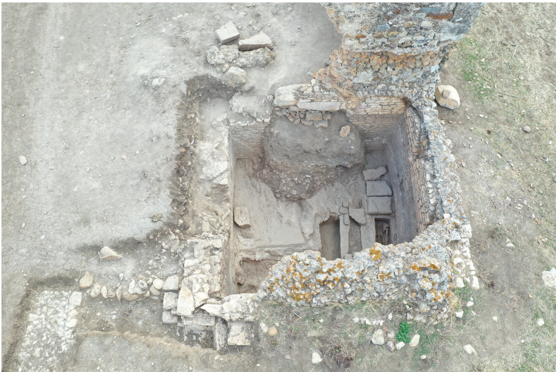
Fig. 25. L'ingresso del vano verso l'abside della basilica, con l'architrave in posto.