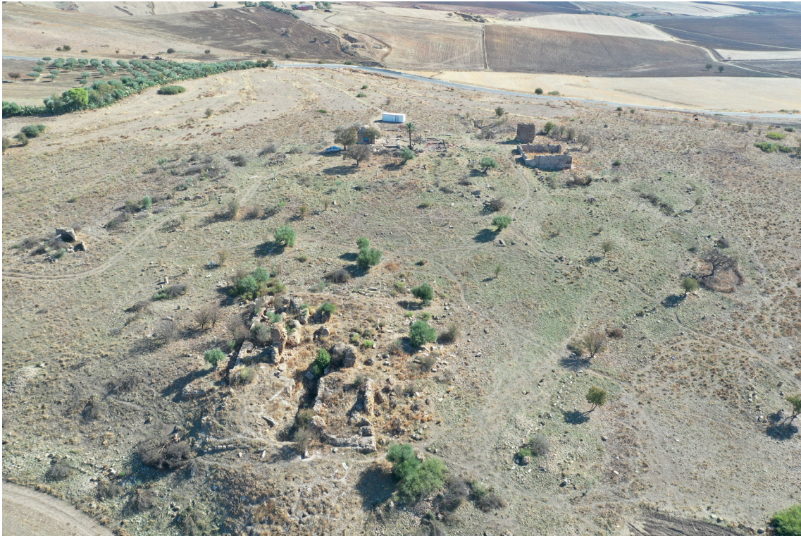
Fig. 10. Le grandi terme meridionali di Numluli , da Ovest. In secondo piano è il foro.

come invece viene di norma interpretato, mentre il minore è molto probabilmente la curia del municipium , così almeno lascia intuire la nicchia ricavata al suo interno nella parete orientale, destinata ad ospitare la statua di una divinità o dell'imperatore. Nella parure monumentale della città si riconoscono poi due impianti termali (fig. 10), un grande tempio a corte con 5 celle su una terrazza ai margini orientali dell'abitato (fig. 11) e, infine, un martyrium quadrilobato posto su una piattaforma non lontano da una basilica paleocristiana, all'estremità occidentale (fig. 12); quest'ultimo edificio e il foro con il Capitolium sono stati prescelti per essere oggetto dei primi scavi da parte della Missione.