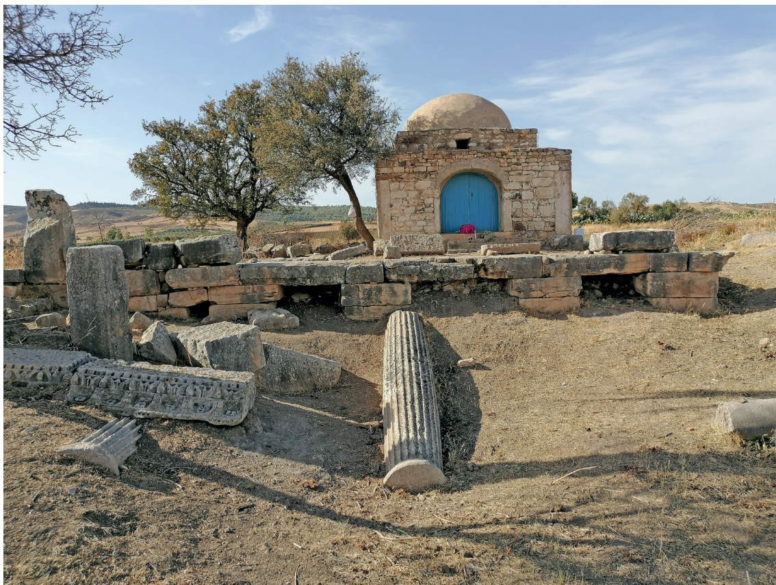
Fig. 5. Il podio del Capitolium con gli elementi architettonici in crollo davanti alla fronte.