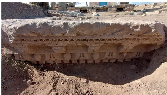
Fig. 17. Il nuovo elemento della cornice del Capitolium , in corso di scavo.