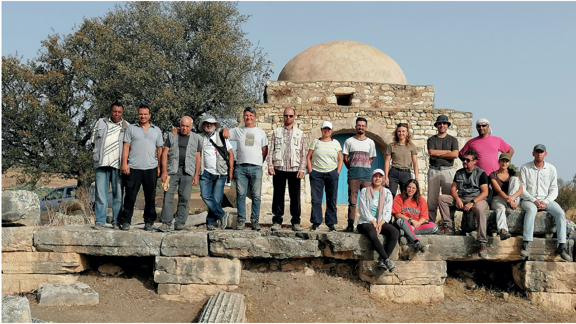
Fig. 13. I membri della Missione Archeologica Tuniso-Italiana INP-Uniss a Numluli .

tamente davanti al Capitolium (fig. 14), in modo da includervi anche il saggio che venne disordinatamente realizzato nel 1891 per mettere in luce, insieme al podio del tempio, gli elementi architettonici del crollo della fronte, posti a circa un metro e mezzo di profondità 4 . Nella parte meridionale del settore, non intaccata dagli sterri di fine Ottocento, lo scavo ha rivelato fasi di frequentazione di età araba poco al di sotto dell'attuale piano di campagna (fig. 15): sporadiche testimonianze rimandano al periodo successivo alla costruzione del marabout, che è possibile collocare con precisione nel 1890 5 , ma livelli insediativi individuati da strutture e materiali più consistenti rimontano certamente ad età medievale. L'interesse di questa scoperta è evidente, dal momento che nella letteratura sin qui edita non era ancora stata segnalata una rioccupazione postclassica nel sito, ove in effetti tra i reperti di superficie non si erano rilevati materiali di tale facies. Anche Numluli si inserisce così in quella rete di centri sia della media valle della Medjerda sia di regioni contermini della Tunisia dove le ricerche recenti stanno mettendo in evidenza in maniera sempre più costante la presenza di livelli di età medioevale, o con una continuità insediativa rispetto alla fase bizantina o con una ripresa dell'occupazione dopo uno iato 6 : in ogni caso la dinamica poleogenetica che è alla base di questi fenomeni appare decisamente diversa rispetto ai periodi precedenti.