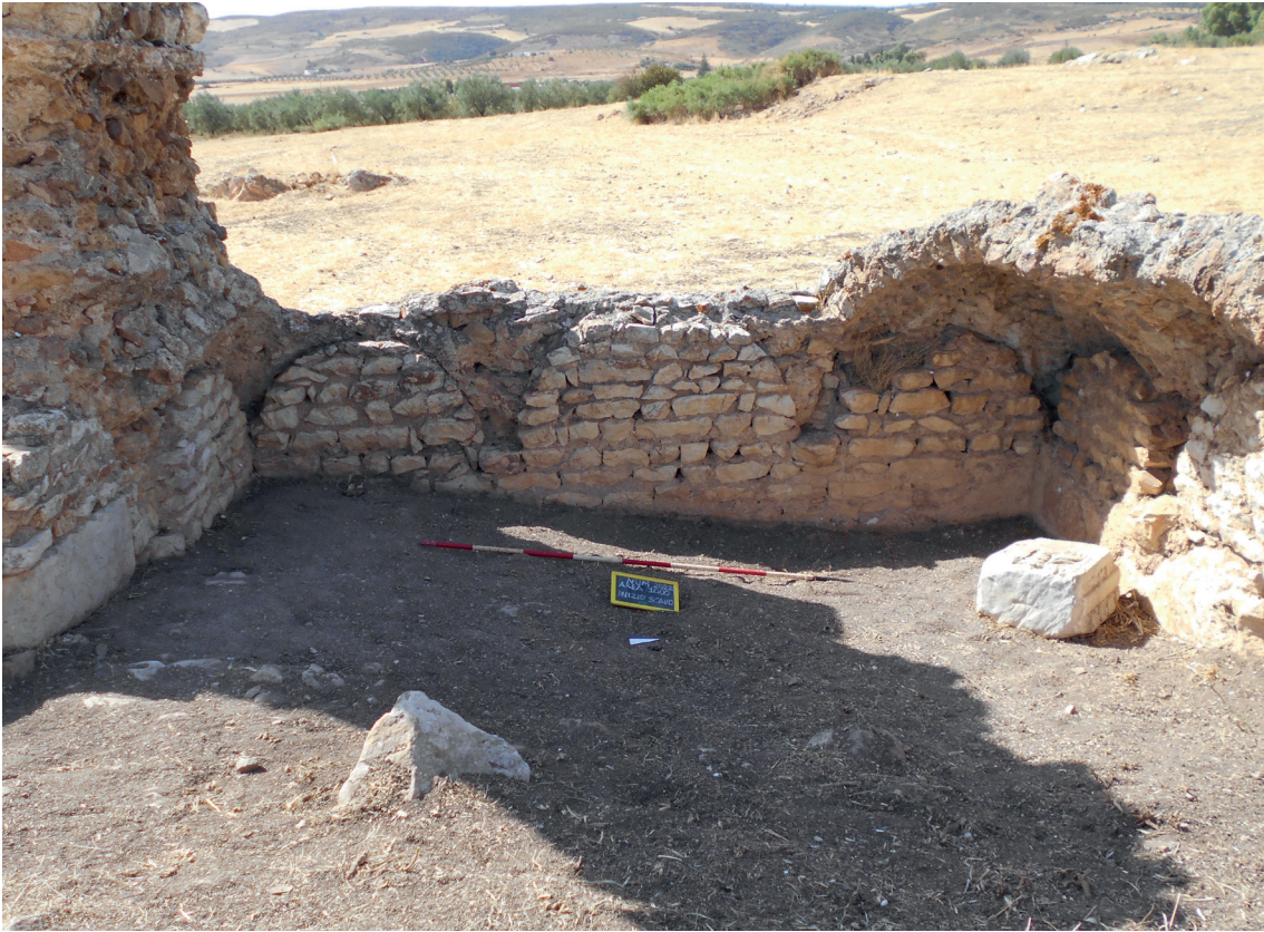
Fig. 24. Il vano con la volta a ombrello a destra dell'abside, prima dello scavo.