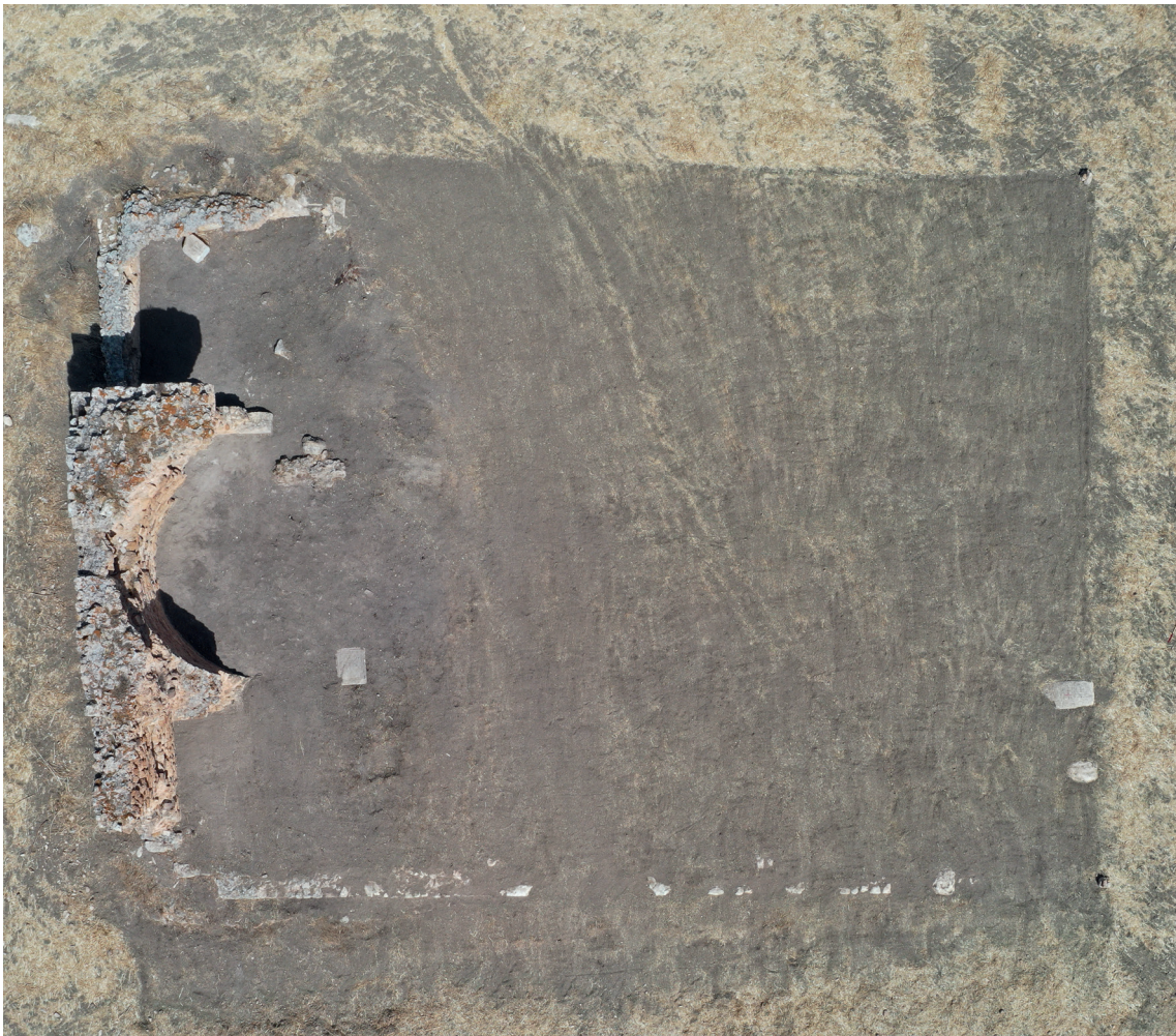
Fig. 19. L'edificio absidato ai limiti occidentali della città, dopo la pulizia preliminare allo scavo.