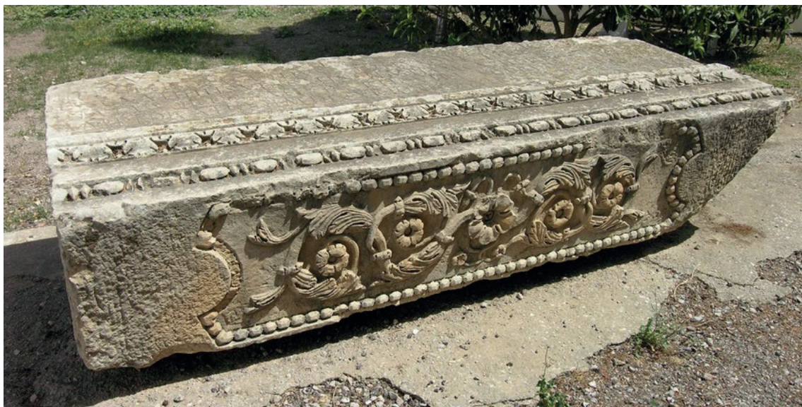
Fig. 7. Téboursouk, Délégation . Elemento del fregio-architrave del Capitolium di Numluli con l'iscrizione dedicatoria.