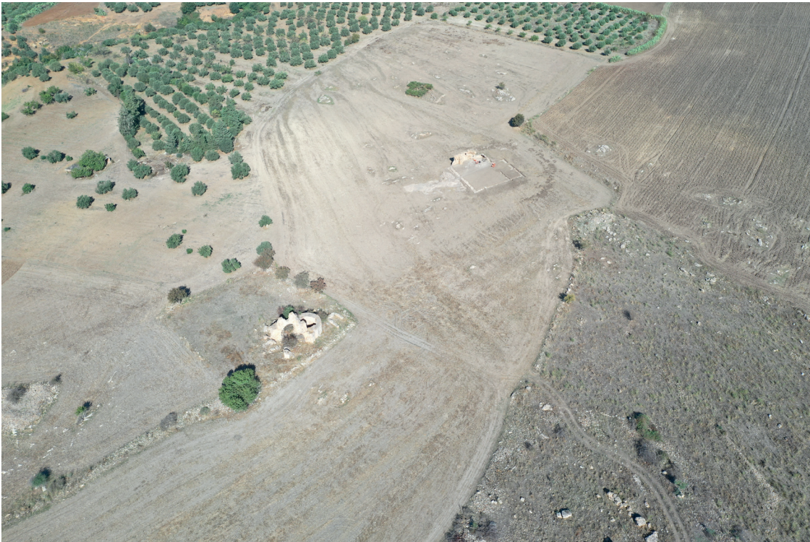
Fig. 12. La terrazza con il tetraconco (a sinistra) e la basilica paleocristiana (in alto).