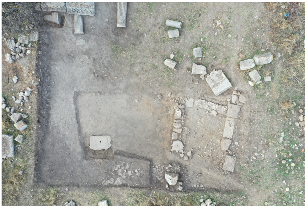
Fig. 15. La parte meridionale del settore nel foro con i livelli insediativi di età medievale.