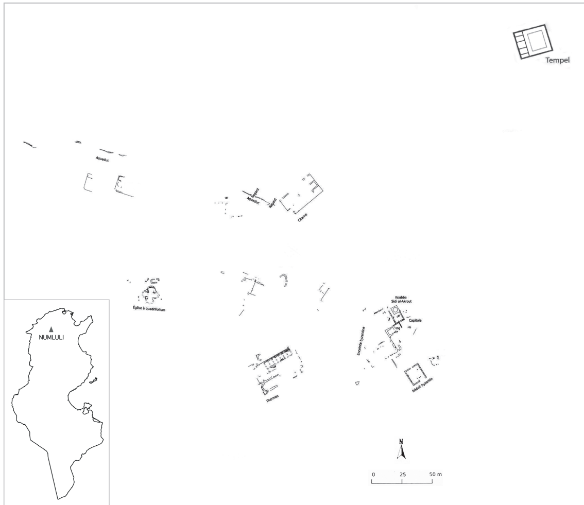
Fig. 2. Numluli , planimetria generale del sito. Rielaborazione da De Vos, Attoui (2013), tav. 144 integrata da Scheduling (2019), tav. 9.

numerali, queste ultime sviluppatasi soprattutto più di recente portando alla pubblicazione di interessanti lavori con utili descrizioni, spesso corredate da planimetrie generali della città romana 3 (fig. 2).