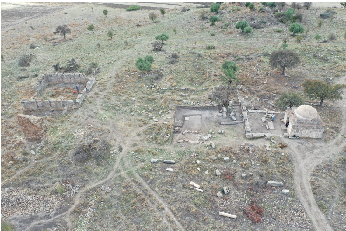
Fig. 4. Il foro e i suoi monumenti, da Est.