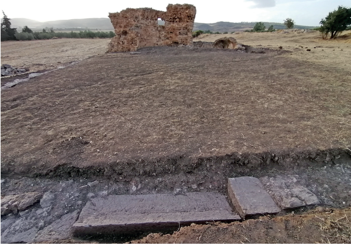
Fig. 22. L'ingresso al centro della fronte orientale della basilica con la soglia monolitica in posto.