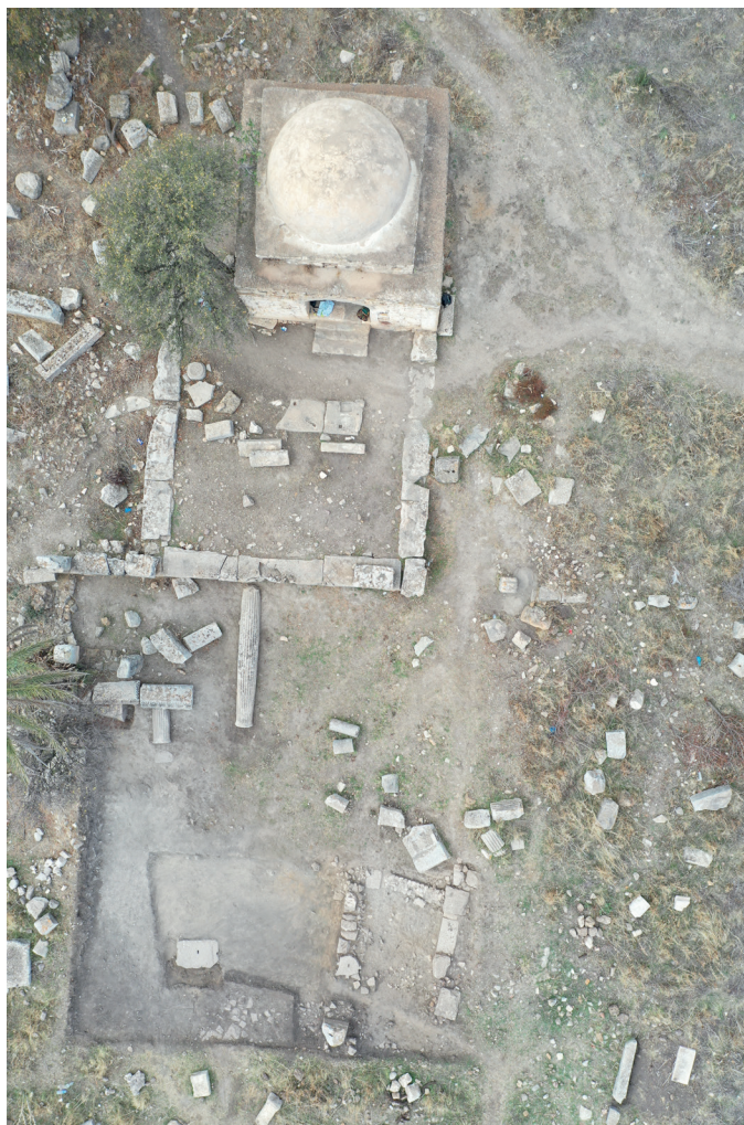
Fig. 14. Il settore di scavo nel foro, a ridosso del Capitolium .

inglobando un segmento di un muro precedente realizzato con l'uso di malta come legante, al quale sono stati giustapposti, ma senza alcun legante, blocchi di reimpiego e un grosso capitello corinzio (fig. 16), utilizzato come semplice elemento costruttivo, proveniente verosimilmente dal crollo del vicino Capitolium . Si noti che finora non era stato ritrovato alcun capitello di questo tempio: in effetti i due capitelli corinzi presenti nello spartitraffico di TébourSouk insieme alle due basi di colonna e ai relativi fusti scanalati (fig. 6), questi ultimi provenienti per certo da Numluli , sono di dimensioni diverse da quello appena ritrovato e non sono stati dunque prelevati dal foro del municipium . Non lontano da questa struttura, verso ovest, è stato poi ritrovato un nuovo elemento della cornice (figg. 15, 17), pressoché integro e decisamente meglio conservato rispetto a quelli già noti, il cui contesto di giacitura è ancora da indagare, mentre sotto i materiali già in vista del crollo della fronte è apparso un elemento del fregio-architrave con il soffitto decorato (fig. 18), al momento solo parzialmente in luce ma che risulta diverso nell'ornato da quelli conservati alla Délegation di TébourSouk.