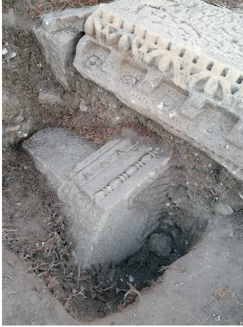
Fig. 18. Il nuovo elemento del fregio-architrave del Capitolium , in corso di scavo.