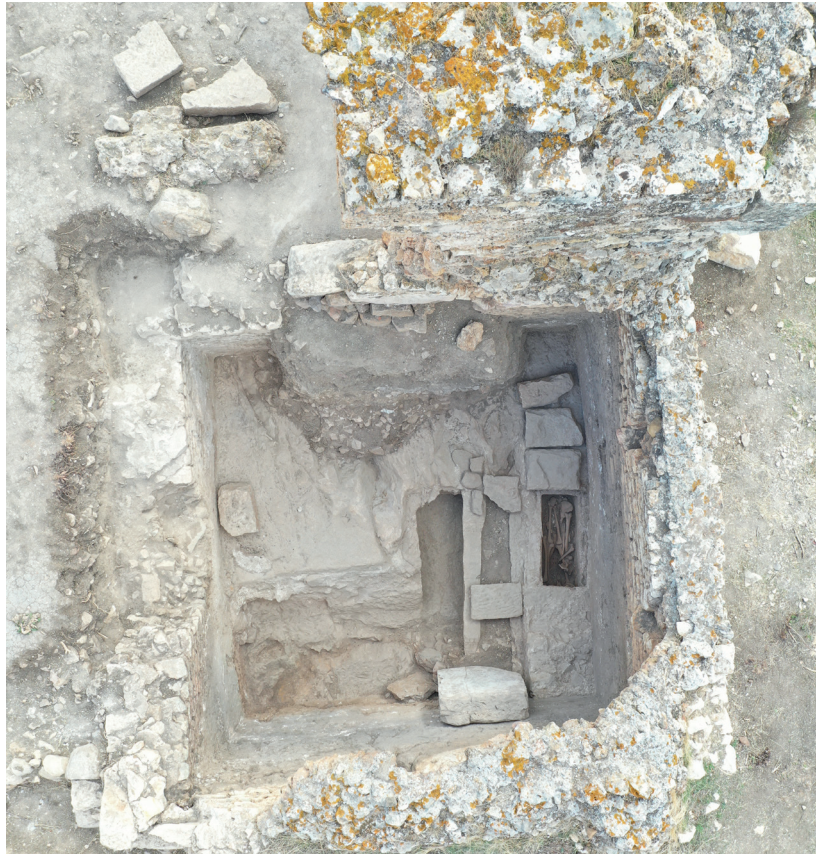
Fig. 26. Il vano annesso alla basilica a scavo terminato, con le tombe in evidenza.

lastroni della copertura originaria: non è stata ancora oggetto di scavo ma certamente è stata aperta già in antico. L'ultima forma, accanto alla parete settentrionale del mausoleo, è stata invece ritrovata ancora provvista della copertura (fig. 27), per quanto le lastre fossero solo in parte sigillate con malta, mentre alcune erano appena appoggiate alle spallette: alla testa meridionale della tomba palesi tracce di bruciato in un punto delimitato da alcune pietre sono forse evidenza del rito del refrigerium . Lo scavo del riempimento, al momento solo parziale, ha rivelato come i lastroni semplicemente appoggiati sulla tomba siano stati più volte sollevati in antico e poi riposizionati per sistemare al suo interno in deposizione secondaria accumuli di ossa sconnesse, collocandole al di sopra di un defunto già qui sepolto, posto con la testa a Nord (fig. 28).