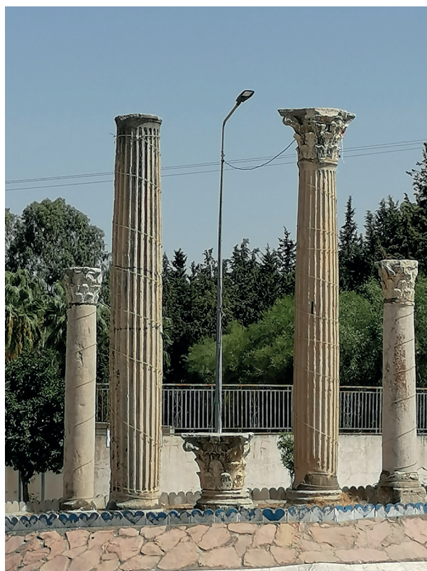
Fig. 6. Téboursouk, due fusti di colonna scanalati del Capitolium di Numluli.