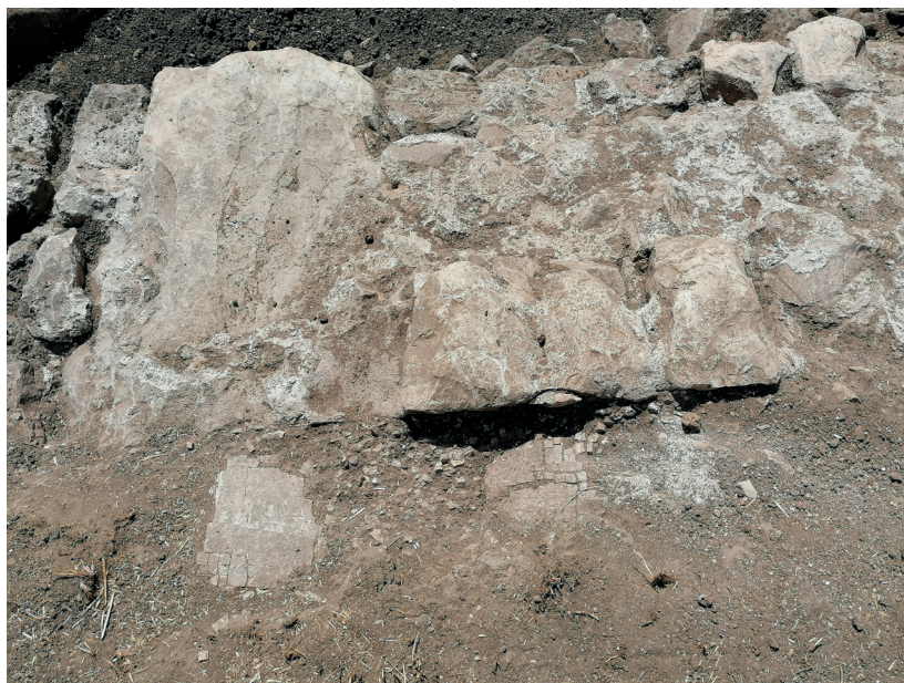
Fig. 20. Resti del pavimento a mosaico dell'edificio abbaside, dopo la pulizia preliminare.