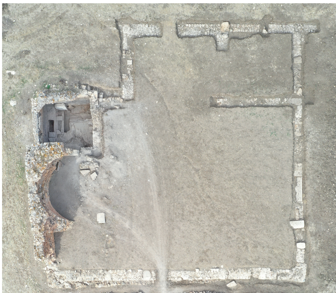
Fig. 21. Il complesso della basilica paleocristiana a tre navate dopo lo scavo superficiale.