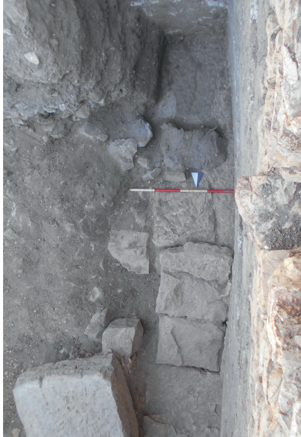
Fig. 27. La tomba lungo la parete settentrionale del mausoleo con le lastre della copertura in posto e le tracce di bruciato accanto.