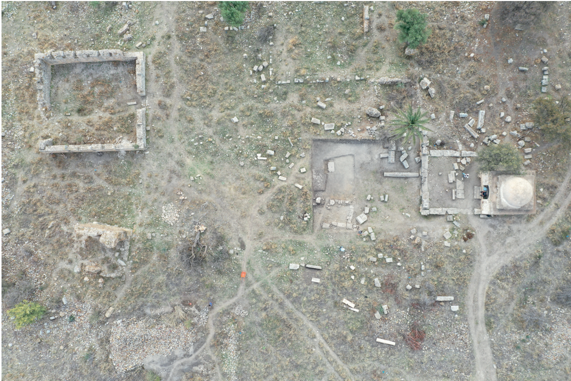
Fig. 3. Il foro di Numluli : sul lato settentrionale (a destra) il podio del Capitolium con il marabout di Sidi Al Akrouf.