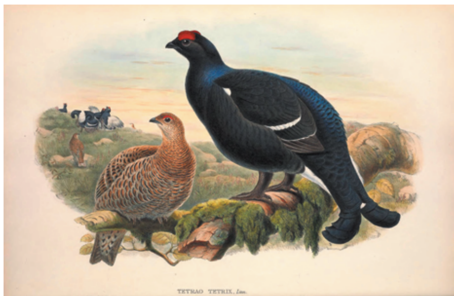
Рис. 14. Тетерев ( Lyrurus tetrix ), самец (справа) и самка (слева). John Gould. The Birds of Great Britain. Vol. 4. London: Taylor and Francis, 1873