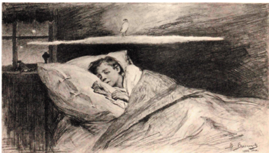
Рис. 17. В. М. Васнецов. Иллюстрация к «Перепелке» (1882). Рассказы для детей И. С. Тургенева и графа Л. Н. Толстого. Москва: Издание П. А. Берс и князя Л. Д. Оболенского, 1883. Печатается с разрешения Российской государственной библиотеки, Москва