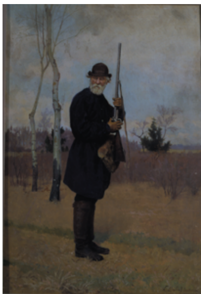
Рис. 2. Н. Д. Дмитриев-Оренбургский. И. С. Тургенев на охоте (1880). Печатается с разрешения Института русской литературы Российской академии наук (Пушкинский Дом), Санкт-Петербург