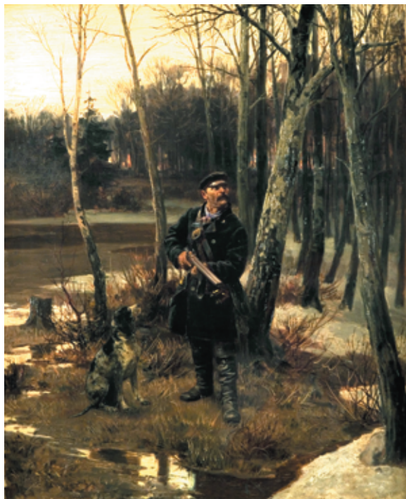
Рис. 5. Русская ружейная охота. И. М. Прянишников. На тяге (1881).