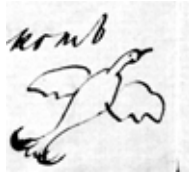
Рис. 9. И. С. Тургенев. Тетерев (рисунок чернилами) из письма к А. А. Фету от 16 (28) июля 1860 года