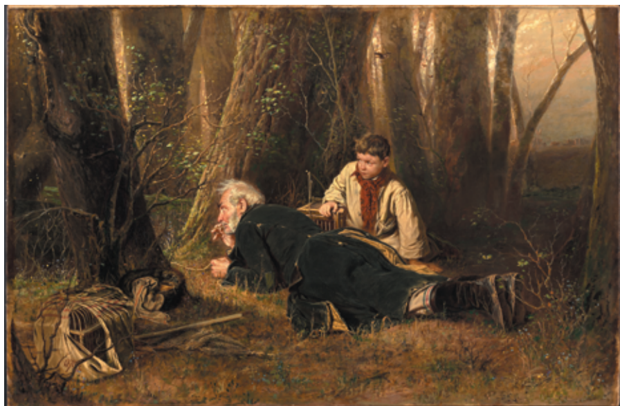
Рис. 15. В. Г. Перов. Птицелов (1870).