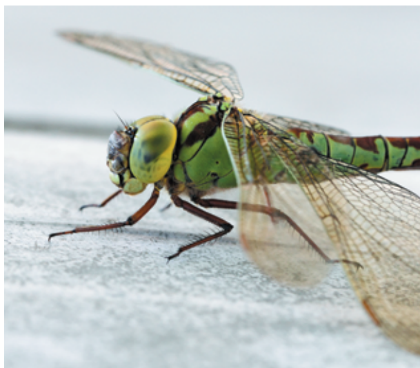
Рис. 12. Aeshna viridis , самка.