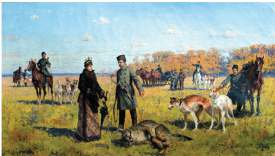
Рис. 3. Русская псовая охота. А. Д. Кившенко. Заструненный волк (1891). Печатается с разрешения Иркутского областного художественного музея им. В. П. Сукачева, Иркутск