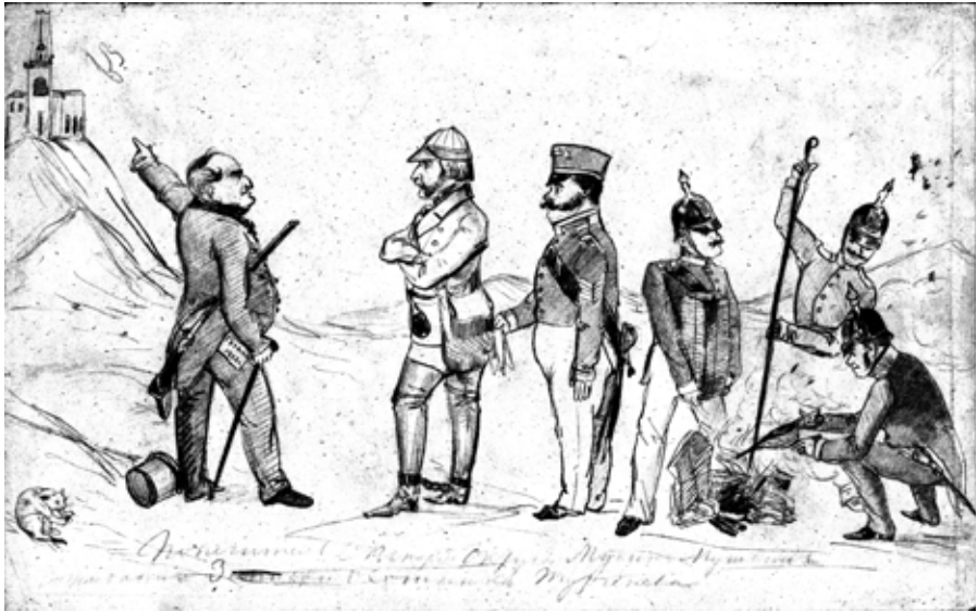
Рис. 10. Л. Н. Ваксель. Попечитель Санкт-Петербургского учебного округа М. Н. Мусин-Пушкин сжигает «Записки охотника» И. С. Тургенева (1852).