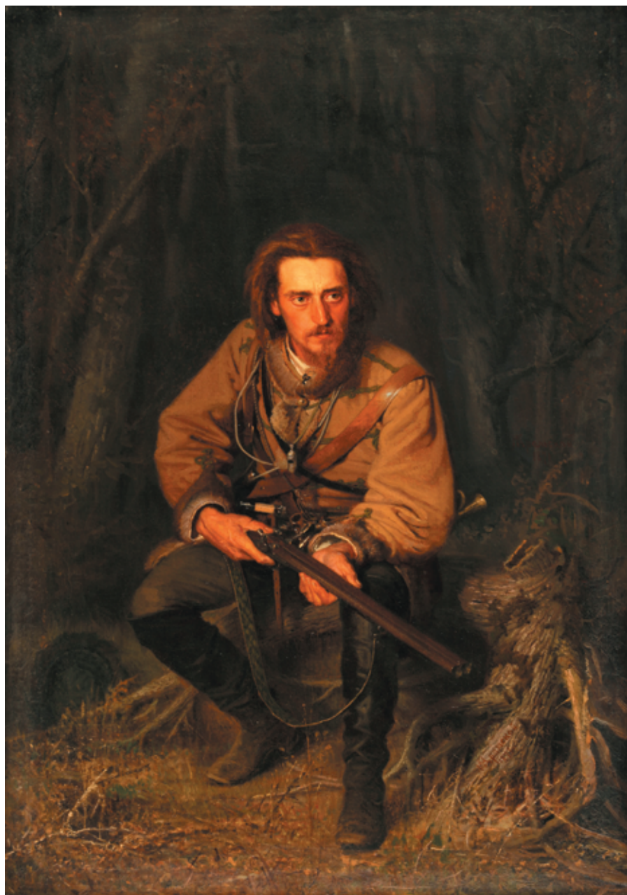
Рис. 8. И. И. Крамской. На тяге (1871).