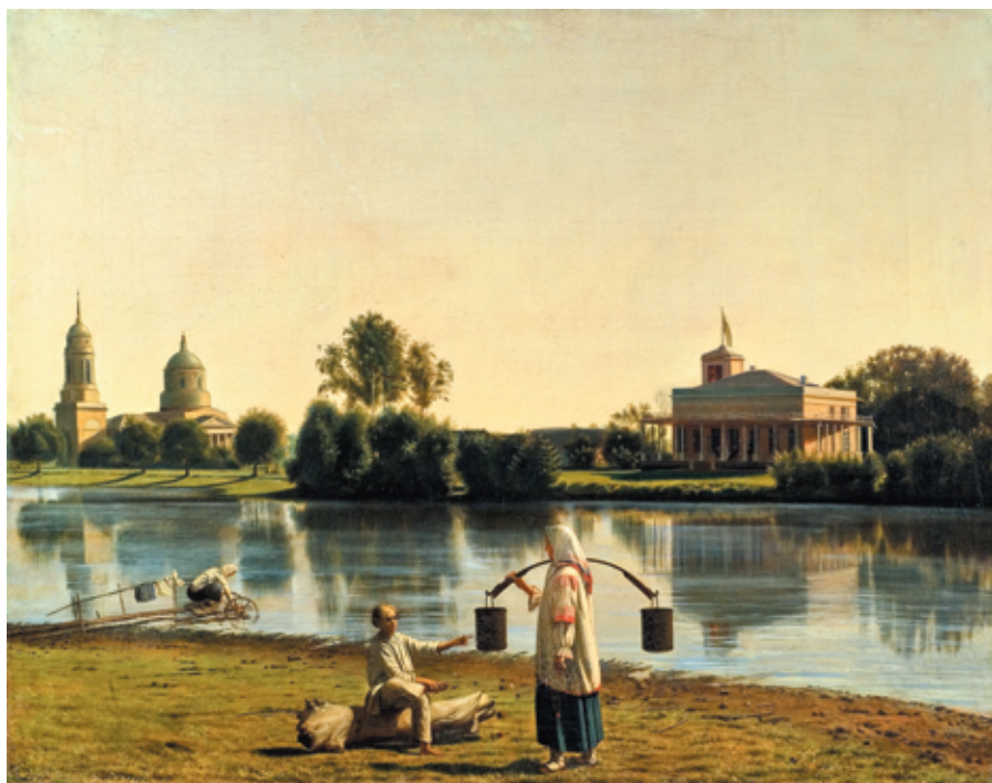
Рис. 13. Г. В. Сорока. Вид озера Молдино (усадебя Спасское Тамбовской губернии) (1840-е годы).