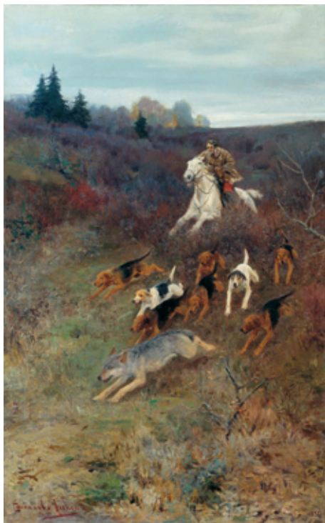
Рис. 4. А. С. Степанов. По волку с гончими (1895).