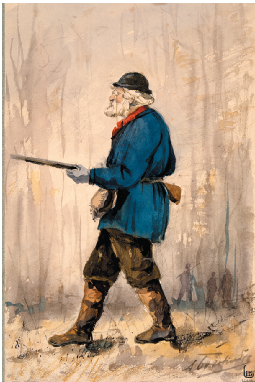
Рис. 19. А. П. Боголюбов. Сегодня я более собою доволен (1880). Печатается с разрешения Государственного Русского музея, Санкт-Петербург