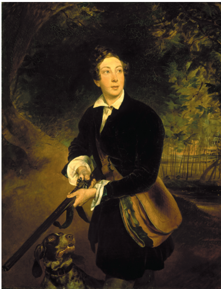
Рис. 7. К. П. Брюллов. Портрет графа А. К. Толстого в юности (1836).