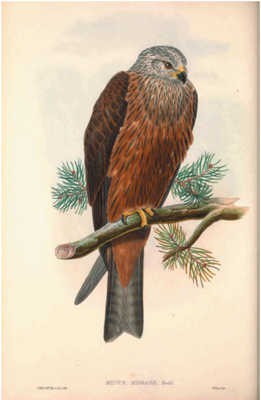
Рис. 11. Черный коршун ( Milvus migrans ). John Gould. The Birds of Great Britain. Vol. 1. London: Taylor and Francis, 1873