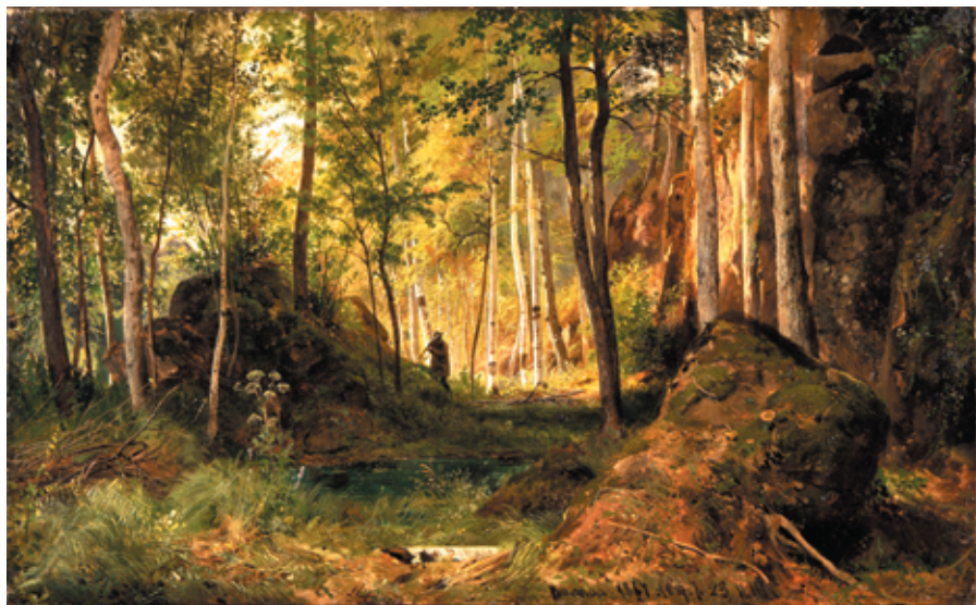
Рис. 6. И. И. Шишкин. Пейзаж с охотником. Остров Валаам (1867). Печатается с разрешения Государственного Русского музея, Санкт-Петербург