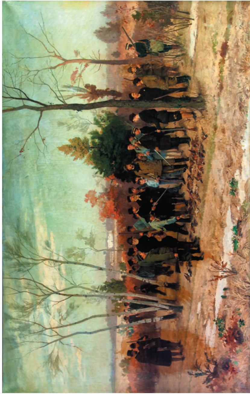
Рис. 18. Н. М. Дмитриев-Оренбургский. Охота великого князя Николая Николаевича у барона Ури Гинцбурга в Шамбодуне (1880).