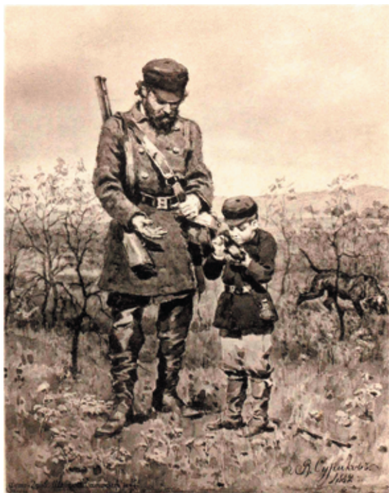
Рис. 16. В. И. Суриков. Иллюстрация к «Перепелке» (1882). Рассказы для детей И. С. Тургенева и графа Л. Н. Толстого. Москва: Издание П. А. Берс и князя Л. Д. Оболенского, 1883.