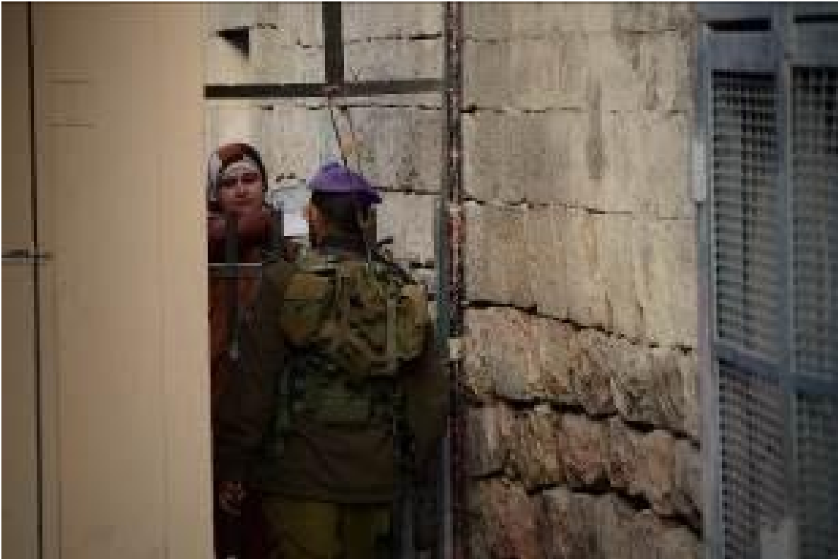
Figure 2 - Palestinian teachers are stopped, often times delayed and searched regularly at the Checkpoints

Se supone que las escuelas son zonas de paz, lugares protegidos -incluso en tiempos de guerra- que mantienen a los niños a salvo y les proporcionan las herramientas necesarias para convertirse en defensores de la paz. Sin embargo, según el Manual de las leyes de la guerra de Israel, el estatuto de las escuelas puede cambiar de civil a militar dependiendo de la situación y las necesidades militares de las fuerzas israelíes. En un mundo en el que las necesidades de seguridad redefinen rápidamente la situación y las acciones, las fuerzas israelíes han explotado el concepto y lo han llevado al límite. Entre el 29 de enero y el 2 de febrero de 2015, se produjeron dos incursiones militares en la escuela Ibrahimi de Hebrón/Khalil. El primer intento fue impedido por el director y los profesores, mientras que en el segundo intento una unidad de 6 soldados consiguió asaltar la escuela y detener a un niño de 14 años bajo la afirmación de que había sido fotografiado tirando piedras.