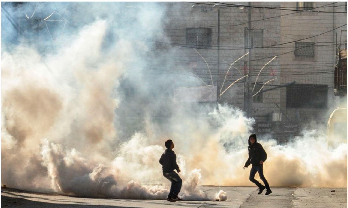
Figure 1 - Nowhere to run. Young Palestinians scramble to find safety from tear gas (CPT - Palestine 2015)

El escenario más común de estos incidentes fue la respuesta de los soldados israelíes o de la policía fronteriza a un puñado de escolares que arrojaban piedras, lo que supone una amenaza insignificante para las fuerzas israelíes en comparación con el uso desproporcionado de la fuerza. Los niños palestinos de Hebrón han sido testigos y sujetos de la violencia y la humillación que ha traído consigo la ocupación durante toda su vida. Años de frustración, violaciones y la ausencia de lugares seguros para jugar, llevan a algunos a tomar una piedra y lanzarla a los búnkeres, a los puestos de control y a las torres militares que ensucian la ciudad (CPT-Palestine, 2015).