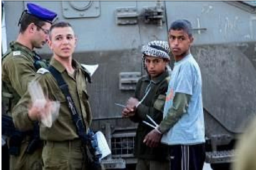
Figure 4 - Israeli settlers said that children were throwing stones: no need to investigate any further for evidence. Israeli soldiers detained two Palestinian children, obliged them to sign documents in Hebrew, handcuffed and blindfolded them and drove them to the military base

Alrededor de 500-700 niños palestinos son arrestados, detenidos y procesados en el sistema de tribunales militares israelíes cada año. La mayoría de los niños palestinos detenidos son acusados de lanzar piedras, y tres de cada cuatro experimentan violencia física durante el arresto, el traslado o el interrogatorio. Ningún niño israelí entra en contacto con el sistema de tribunales militares" (DCI - Palestina, 2016).