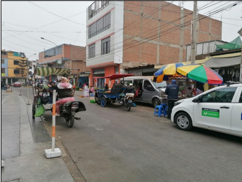
Martes 24 de mayo del 2022, 11:17 am.

Así mismo, se desarrolla el último escenario urbano por las noches, entre las 7:00 pm y las 12:00 am, en este horario, también es evidente, incluso más atrevido, la apropiación del espacio por parte de los comerciantes, y, generando más actos negativos de su parte, de hecho, aquí la informalidad es dueña de la calle; en este escenario se observó, del mismo modo, la venta de productos de comida, que están denominados como comida rápida o “fast food”, como las pizzas, las hamburguesas los broaster, etc.; este horario está determinado por que la gente llega a su hogar, después de cumplir con sus jornadas laborales o estudiantiles, y, el comportamiento humano que más resalta es el cansancio y el agotamiento físico, por esta razón, el escenario urbano se vuelve un área de recepción para estas personas, debido que, llegan, se cruzan con la venta de estos productos, consumen algún tipo de alimento y, luego, se retiran de una manera más sosegada a sus casas; por consiguiente, esto genera que el comportamiento social determine que la característica física de este escenario urbano que se presente sea bastante relajado.