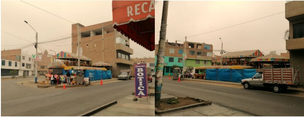
Comercio y Recreación informal 6:48 pm

Según todo lo descrito en lo observado y en lo manifestado en las entrevistas por los propios actores, nos lleva a concluir que la conducta social es la que genera la necesidad de consumo ofrecido en los diferentes escenarios, como nos menciona Silva, A. (2016), Los escenarios urbanos se forman acorde a las prácticas sociales que se realicen ahí, esto quiere decir, que son representaciones que los actores sociales ponen en escena. Lo cual confirma nuestro resultado, la consulta social impacta de manera negativa al uso del espacio público, puesto que ellos mismos generan que los espacios se vean invadidos por un uso que no es el que corresponde, pero que satisface sus necesidades.