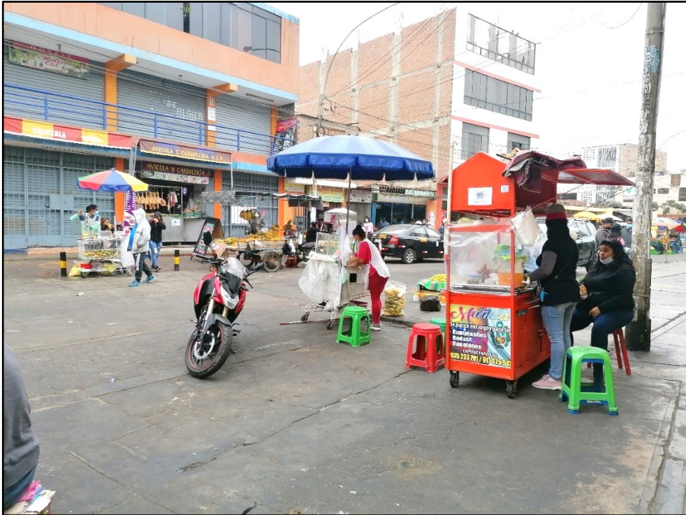
Jueves 12 de mayo del 2022, 8:30 am.