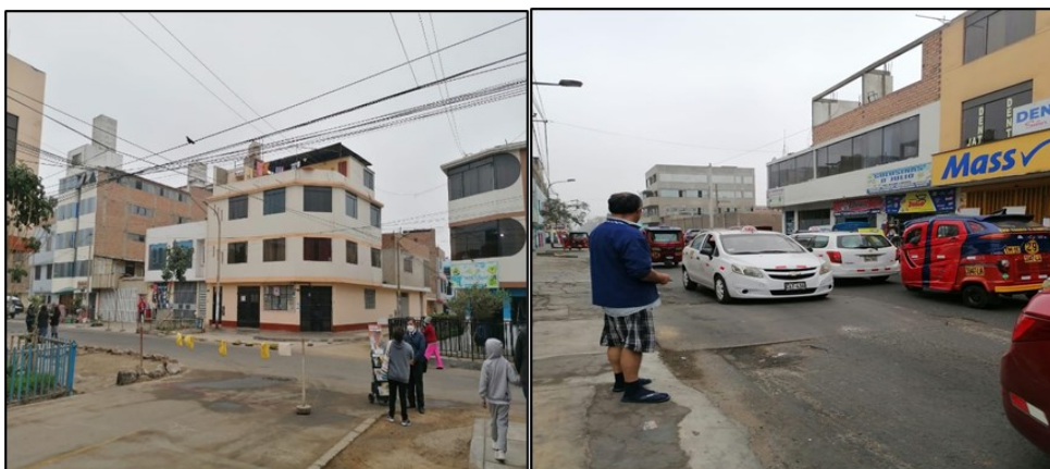
interacción social, hora: 3:50 pm.

Según lo descrito en lo observado y manifestado por los actores de la urbanización, se concluyó que la interacción social influye de manera directa y a favor del desarrollo y mejora de la urbanización, puesto el promover la identidad territorial es muy importante, el apego al lugar, sentirlo como “propio”, que “les pertenece”, este pensamiento y sentimiento es crucial ya que influye significativamente en la formación de valores cívicos, especialmente la