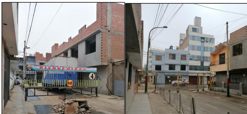
Calles enrejadas, hora: 3:23 pm