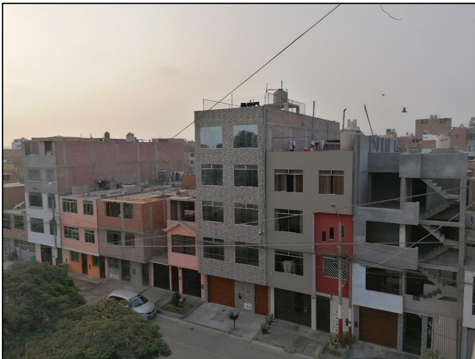
Jueves 26 de mayo del 2022, 5:02 pm.

Grado de consolidación en la urbanización Miguel Grau