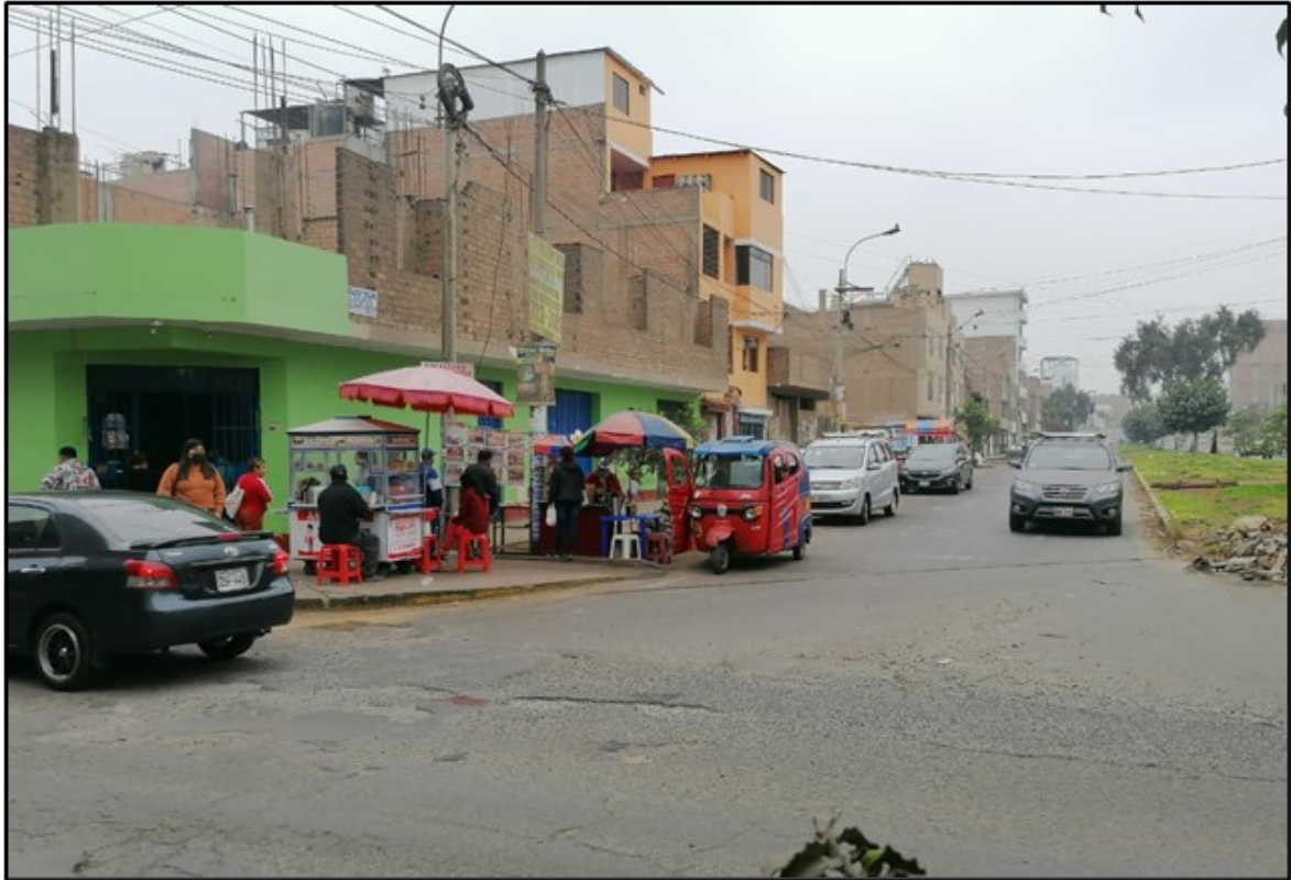
Comercio informal 8:12 am.