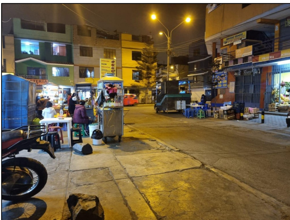
Jueves 26 de mayo del 2022, 8:42 pm.

Al mismo tiempo que se observó estos escenarios, y, en segundo lugar, esta información se contrastó con la opinión y experiencia propia de los entrevistados, se resultó y concluyó al problema general que, en efecto, la formación, evolución y características físicas de estos tres escenarios urbanos que se presentan a distintas horas del día, está determinado por el comportamiento de las personas en el lugar; además, se evidenció un dato muy relevante para nuestra investigación, que estas conductas y comportamiento de las personas están definidas por sus rutinas diarias o actividades cotidianas, son estas actividades que suelen realizar durante el día, así como, por la educación y formación que han tenido a lo largo de sus vidas; de este modo, contrastamos este resultado con la teoría de la autora Meneses (2009) dónde menciona que las conductas y comportamientos de los individuos, se dan, por una parte, por el significado que han adquirido durante toda su vida, esto quiere decir, en la formación de su experiencia individual y colectiva, y por otro lado, es el resultado de sus nociones e ideas que constituyen el mundo en el que viven a diario. En este caso, validamos lo mencionado por la autora, y, de la misma forma, recalamos la importancia de entender cómo se define el comportamiento humano,