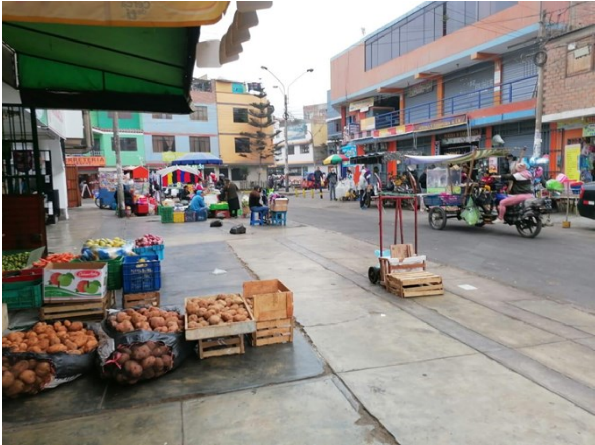
Fotografía propia: Comercio informal 12:30 pm.

finalmente, el escenario de la noche (7:00 pm. y las 12:00 am.), los productos son de consumo de alimentos listos para consumir, como comida rápida, además de ofrecer una alternativa de distracción para los niños ya que en distintas ocasiones instalan una especie de mini feria que es accesible económicamente para los usuarios.