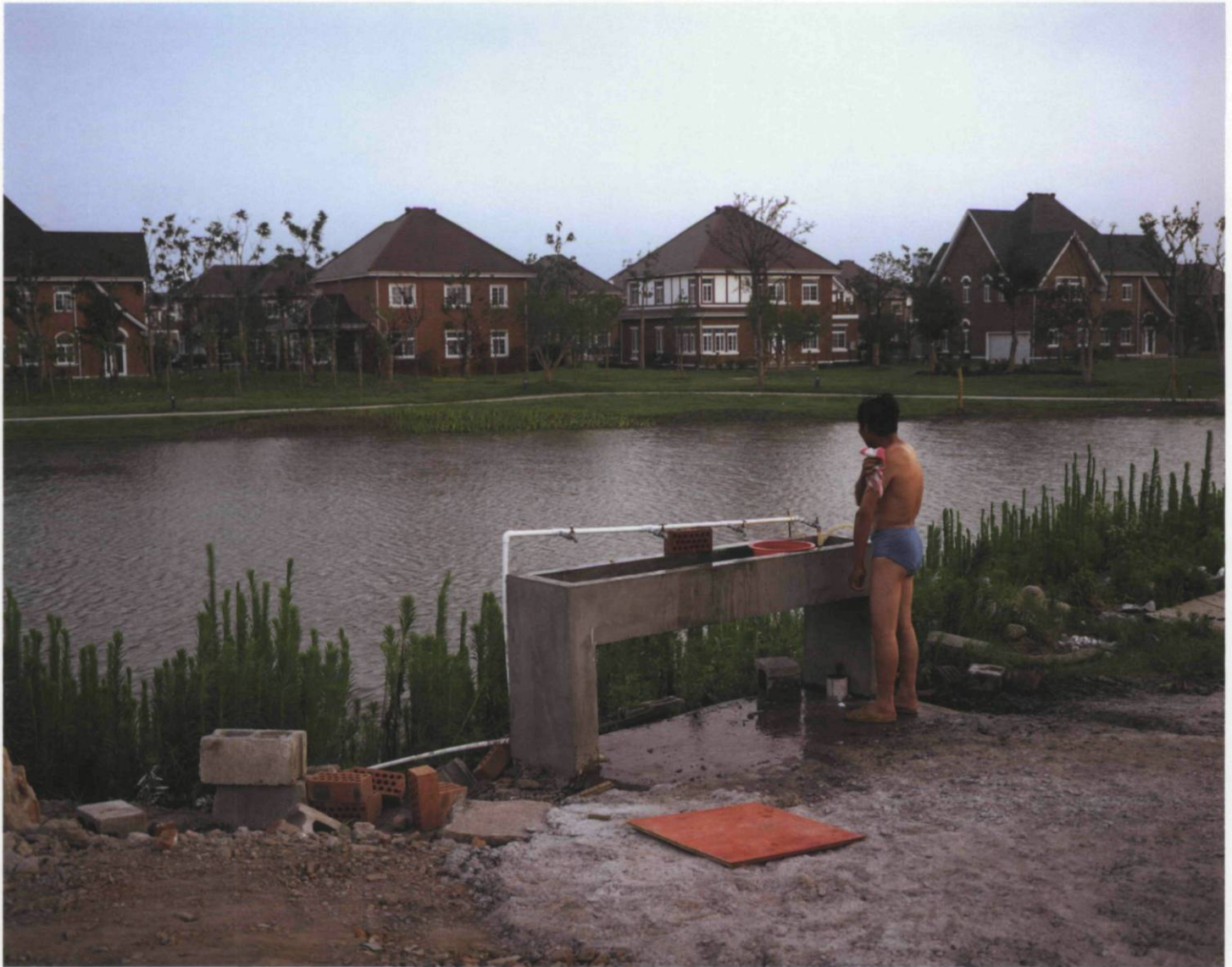
Thames Town, Songjiang District, 2005