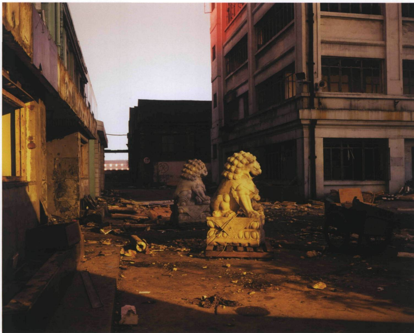
Condemned Factory, Moganshan Lu, 2002