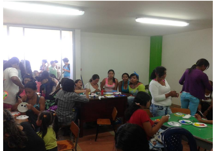
Encuentros Familiares "Formándonos para Formar" 2014