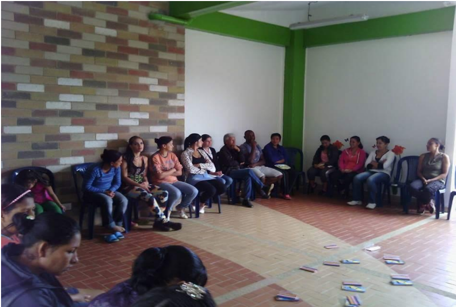
Encuentros Familiares "Formándonos para Formar" 2015