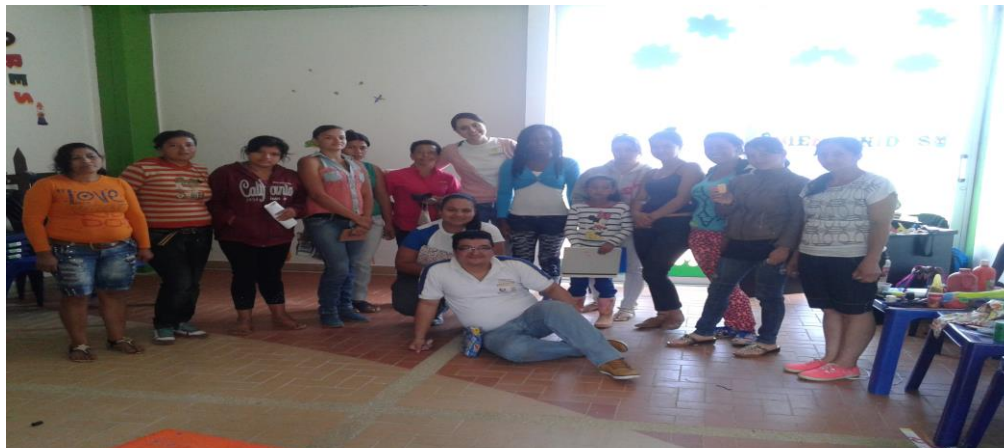
Encuentros Familiares "Formándonos para Formar" 2015