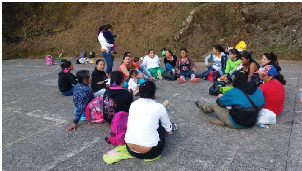
Figura 1. La familia como referente junio 06-2017.

e. Figuras. Fotos correspondientes las evidencias de cada una de las actividades realizadas.