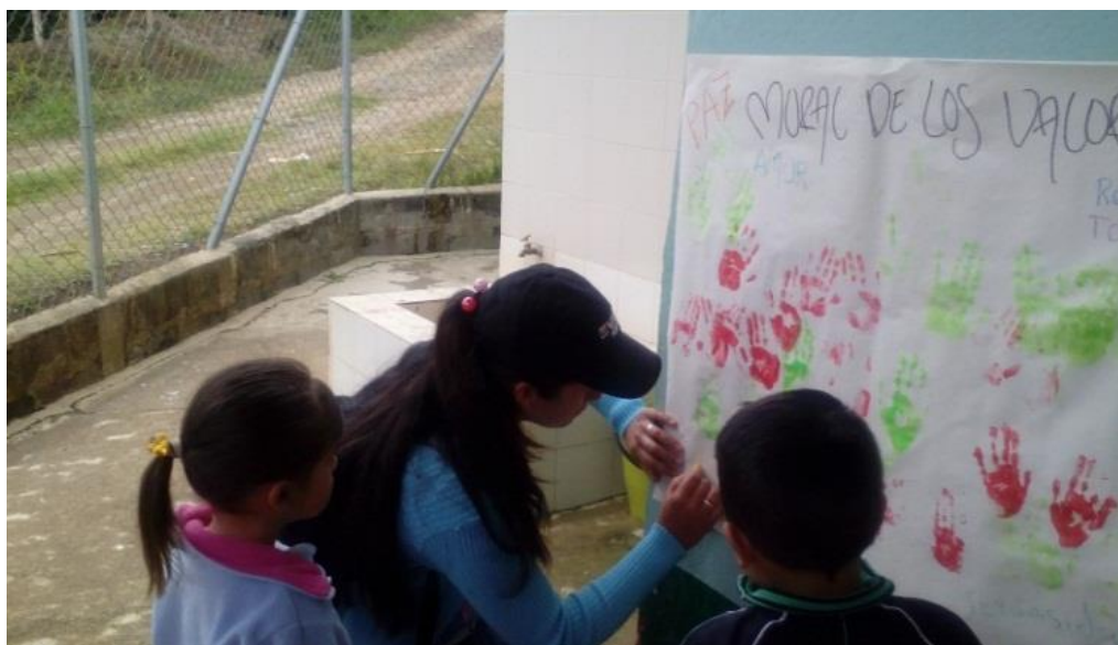
Figura 20. Elaboración de mural agosto 22 de 2017.