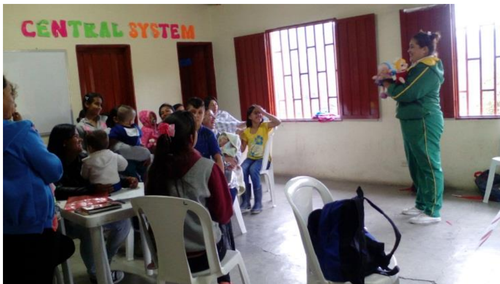
Figura 9. Títeres sobre autocuidado julio 12 de 2017.