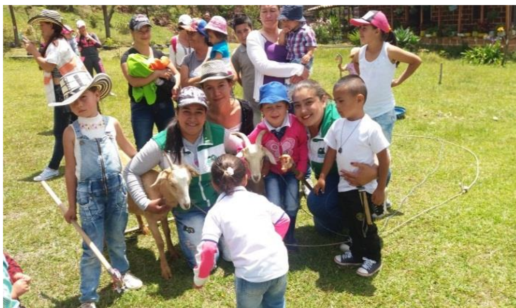
Figura 14. Salida pedagógica agosto 01 de 2017.