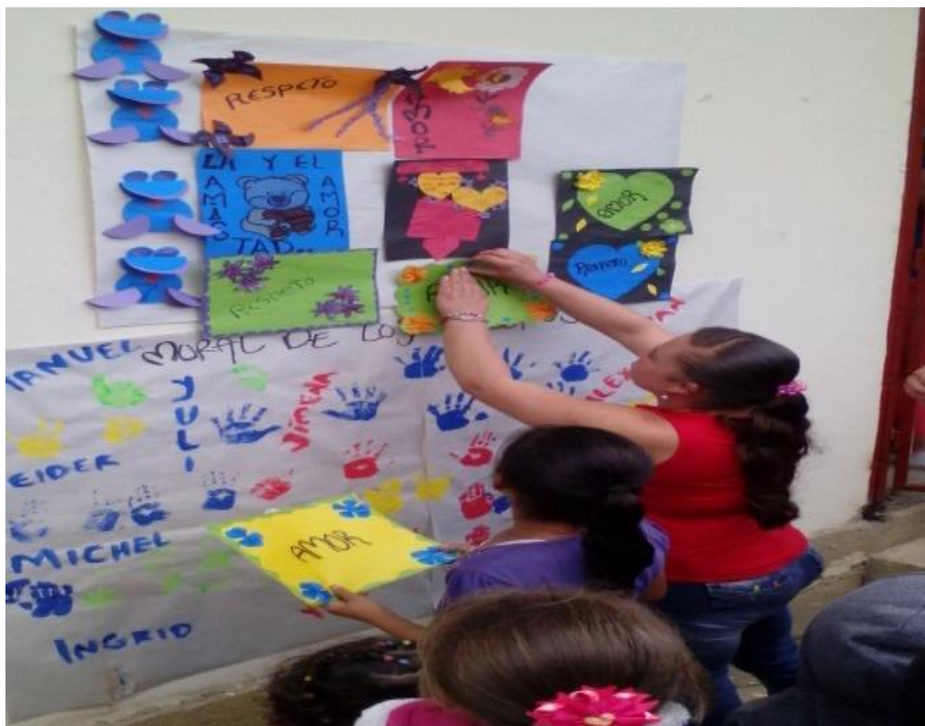
Figura 21. Elaboración de mural agosto 23 de 2017.