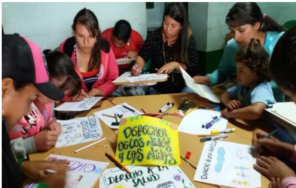
Figura 19. Cartilla sobre los derechos de los niños y las niñas agosto 16 de 2017.