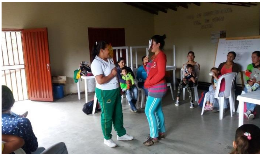
Figura 16. Cuento “Choco encuentra una mamá” agosto 08 de 2017.