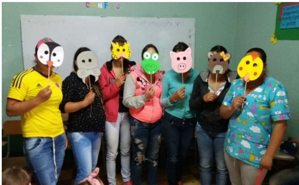
Figura 17. Cuento “Choco encuentra una mamá” agosto 09 de 2017.