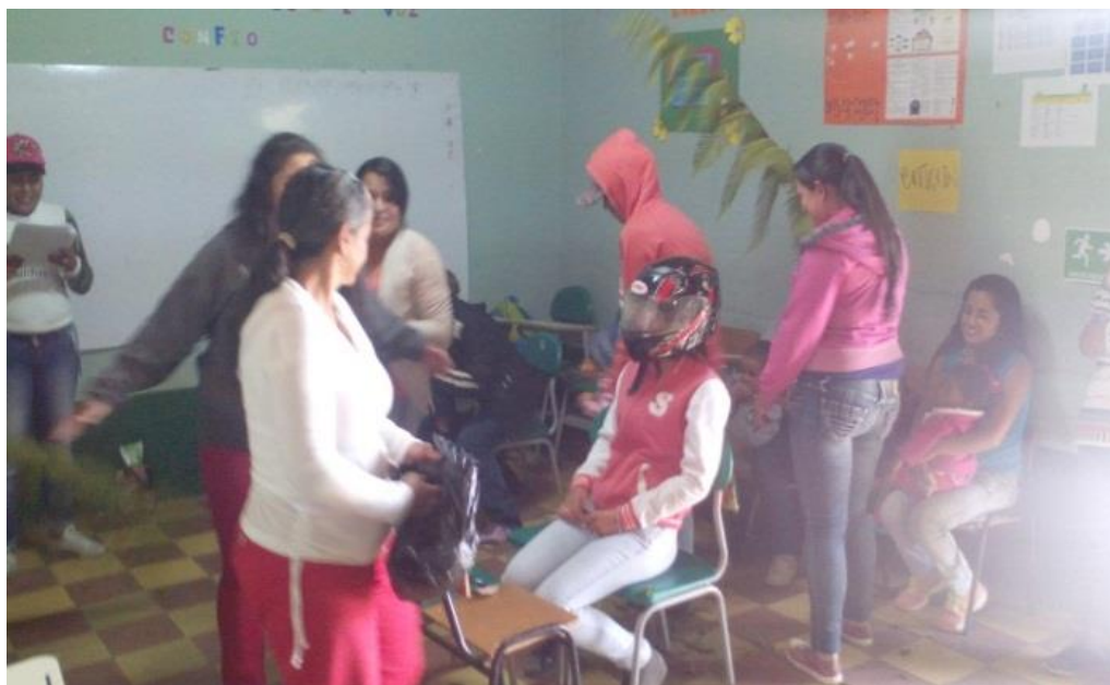
Figura 3. Lectura del cuento “La niña de la caja de cristal” junio 20 de 2017.