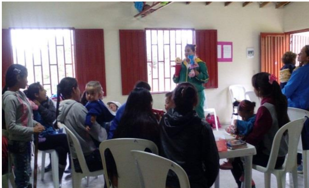
Figura 8. Títeres sobre autocuidado julio 11 de 2017.