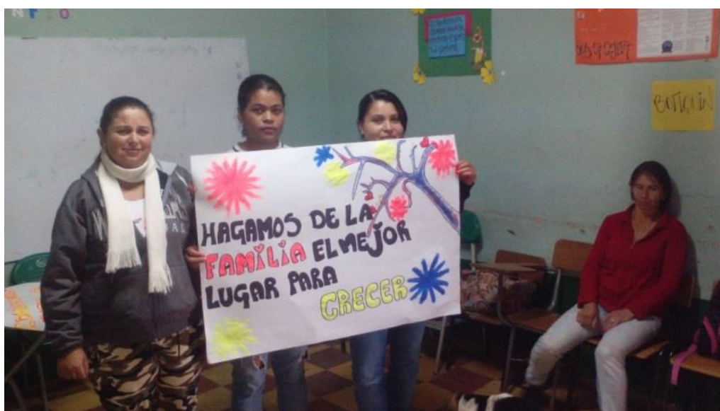
Figura 2. La familia como referente junio 07-2017.