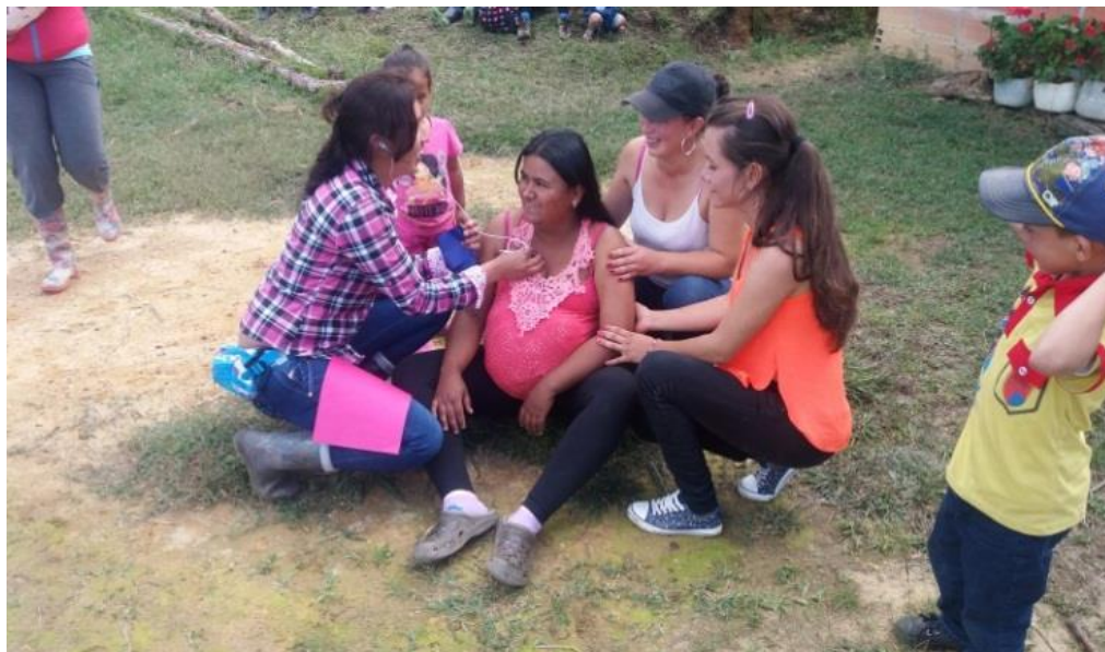
Figura 5. Obra de teatro sobre los valores junio 28-2017.