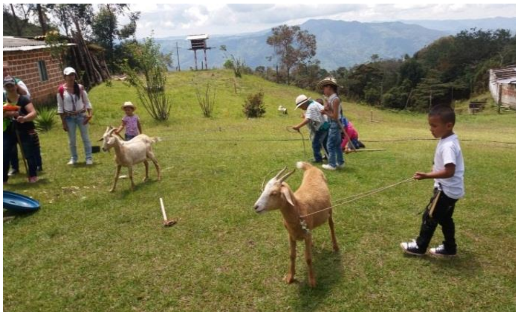
Figura 15. Salida pedagógica agosto 02 de 2017.