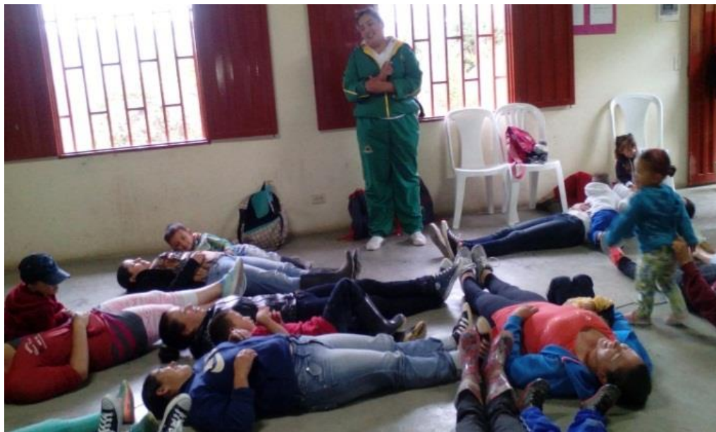
Figura 7. Autocuidado y cuidado mutuo julio 05 de 2017.