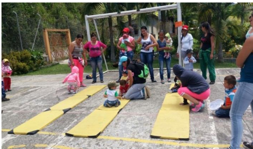
Figura 10. Actividades lúdicas julio 18 de 2017.