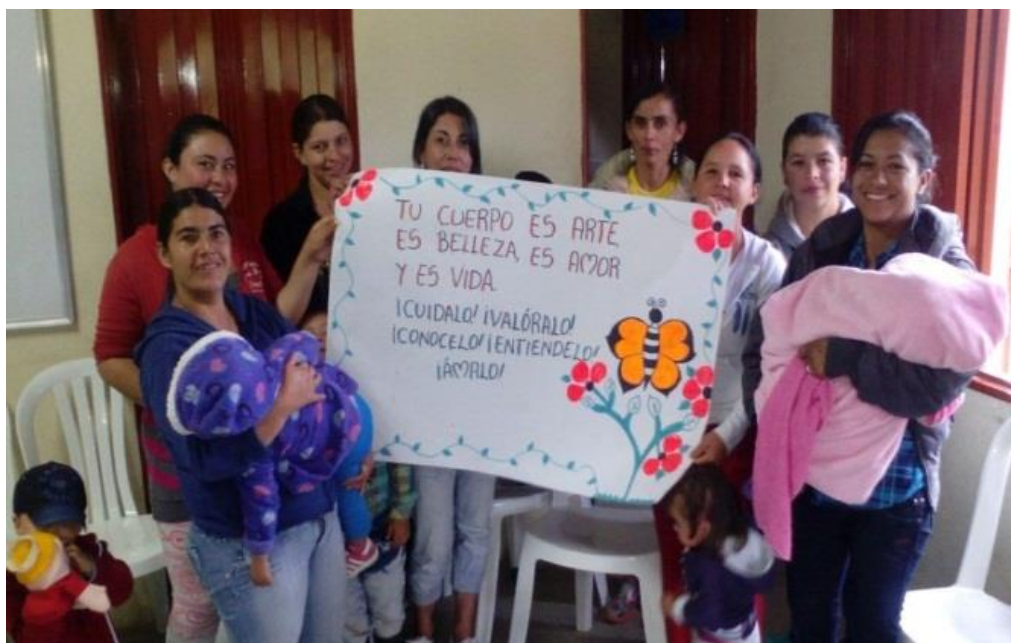
Figura 6. Autocuidado y cuidado mutuo julio 04 de 2017.