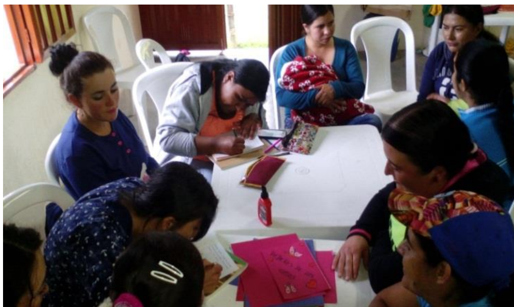
Figura 18. Cartilla sobre los derechos de los niños y las niñas agosto 15 de 2017.