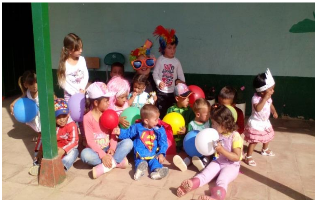
Figura 23. Festival de terminación septiembre 06 de 2017.