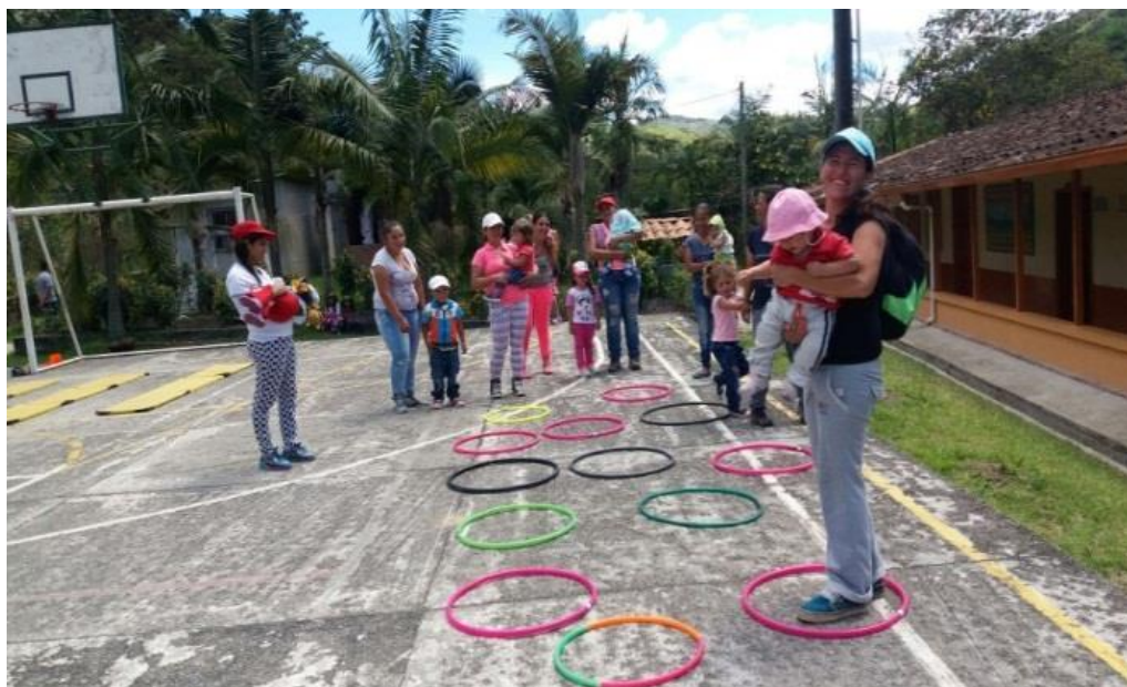
Figura 11. Actividades lúdicas julio 19 de 2017.