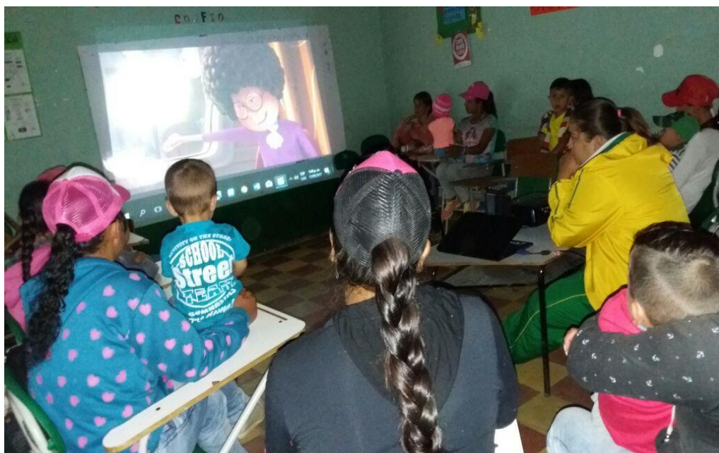
Figura 12. Película “El Lorax en busca de la Trúfula perdida” julio 25 de 2017.