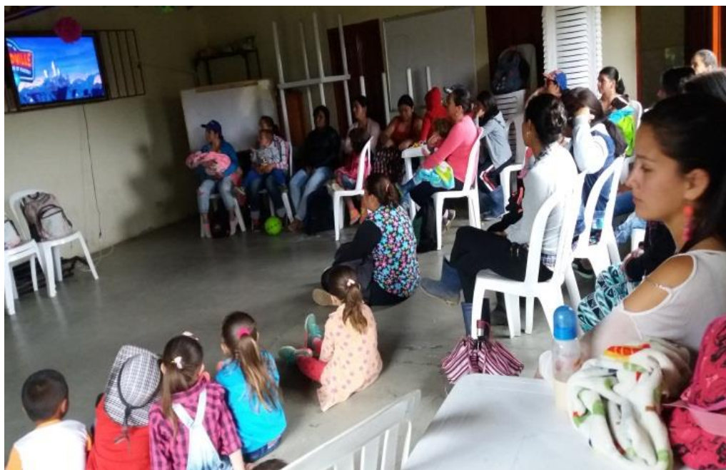
Figura 13. Película “El Lorax en busca de la Trúfula perdida” julio 26 de 2017.