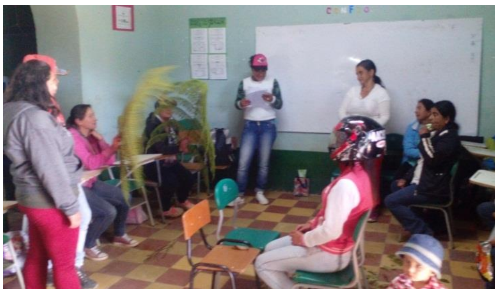
Figura 4. Lectura del cuento “La niña de la caja de cristal” junio 21 de 2017.