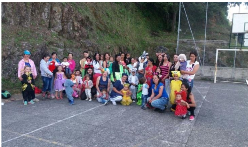
Figura 22. Festival de terminación septiembre 05 de 2017.