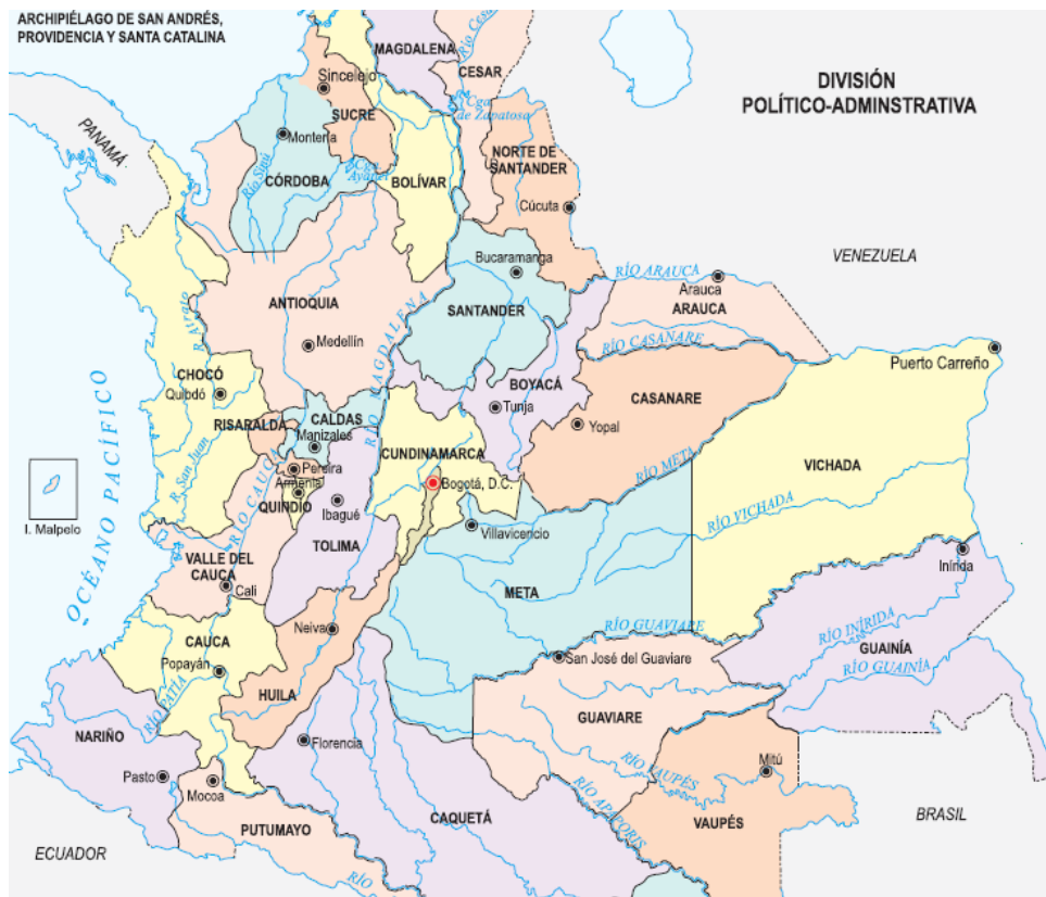
Ilustración 1. División político-administrativa de Colombia.

Ubicado el Macizo Colombiano, donde nace la cordillera Oriental y los ríos Magdalena, Cauca, Cauquetá y Patía; al igual las cordilleras Central y Oriental se destacan el valle del río Magdalena y Suaza y el páramo de Sumapaz. El río Magdalena es el eje del sistema hidrográfico de Huila, en el que confluyen ríos y quebradas que nacen en las divisorias de las cordilleras. Límites: Al norte con los departamentos de Cundinamarca y el Tolima al sur con los de Cauca y Cauquetá, al oriente con los departamentos de Meta y Cauquetá, y hacia el