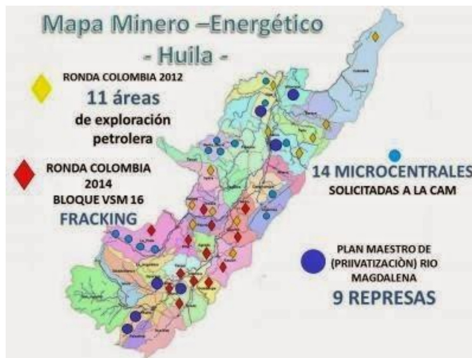
Ilustración 2. Mapa Minero-Energético del departamento del Huila.

Como claramente se evidencia en la anterior cartografía, el departamento del Huila es bañado de extremo a extremo por el imponente río Magdalena, lo que se traduce en una afectación directa para la población huilense en cuanto al mal aprovechamiento de esta fuente hídrica.