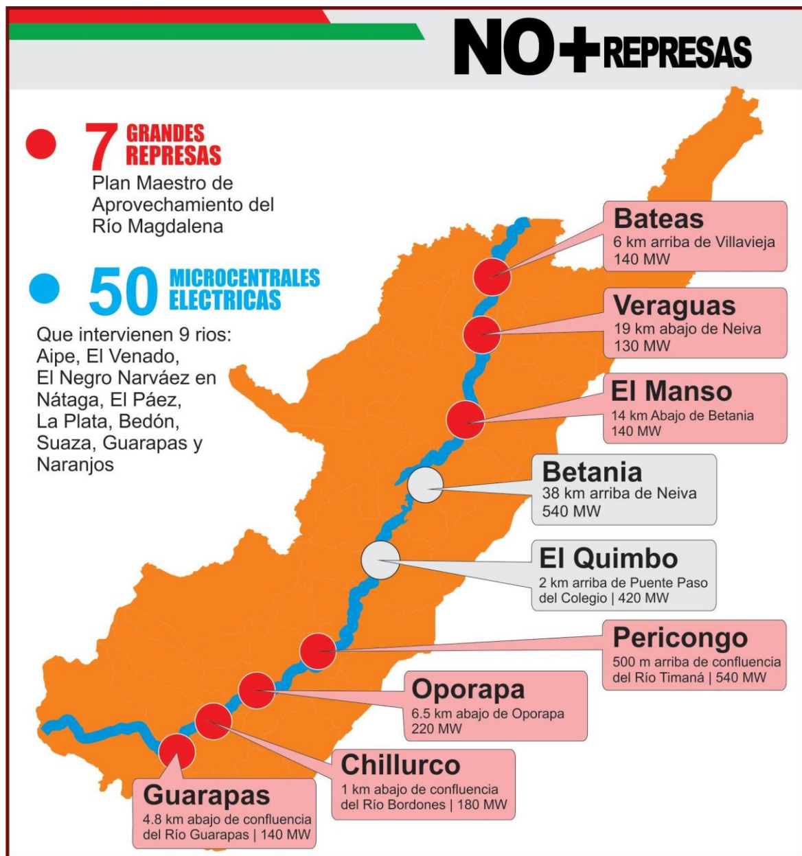
Ilustración 4. Mapa de visualización de proyectos hidroeléctricos en el departamento del Huila.

En la anterior ilustración se puede evidenciar la proyección de la construcción de siete represas más a lo largo del recorrido del río Magdalena en el departamento; esto se traduce en un represamiento del río, en la destrucción de dinámicas poblacionales tanto humanas como vegetales y animales que se asientan hoy en los territorios en donde se pretenden estas construcciones.