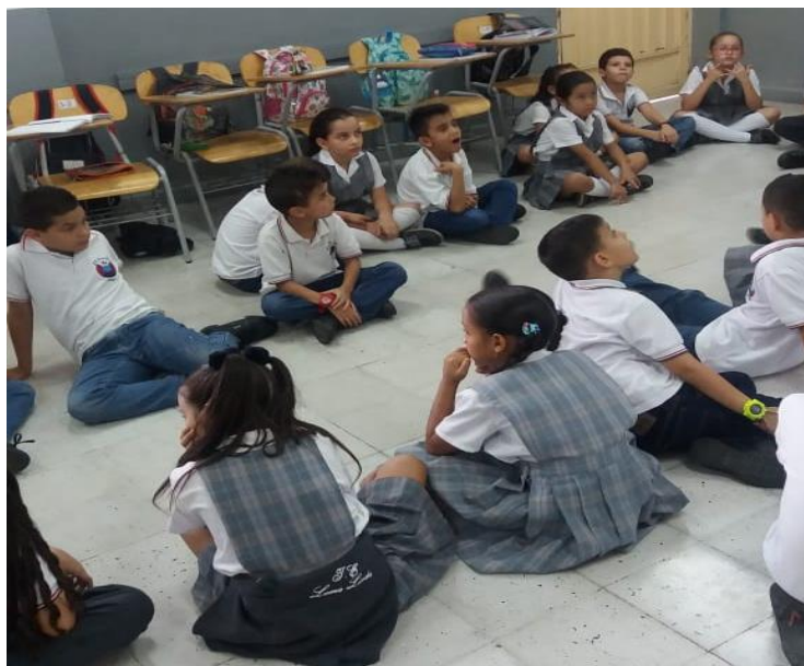
Figura 3. Teléfono roto.