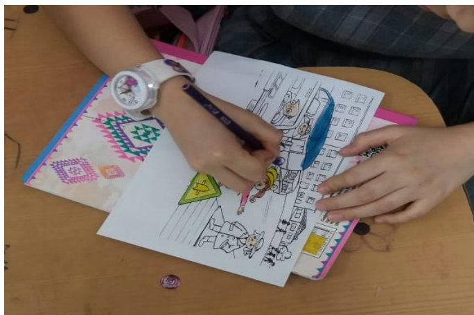
Figura 5. La ciudad sin colores.