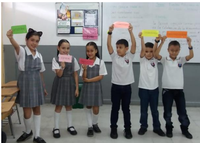
Figura 10. El reinado de los valores.