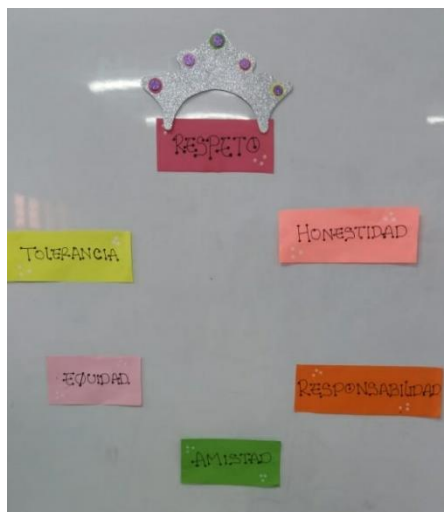
Figura 11. El reinado de los valores.