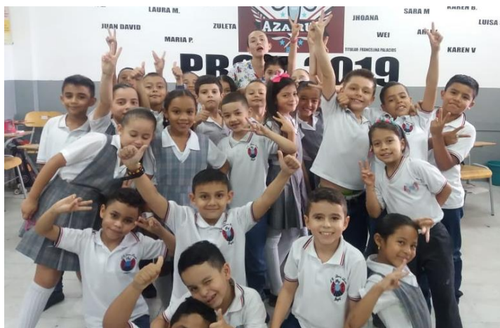
Figura 4. Entendiendo las diferencias.