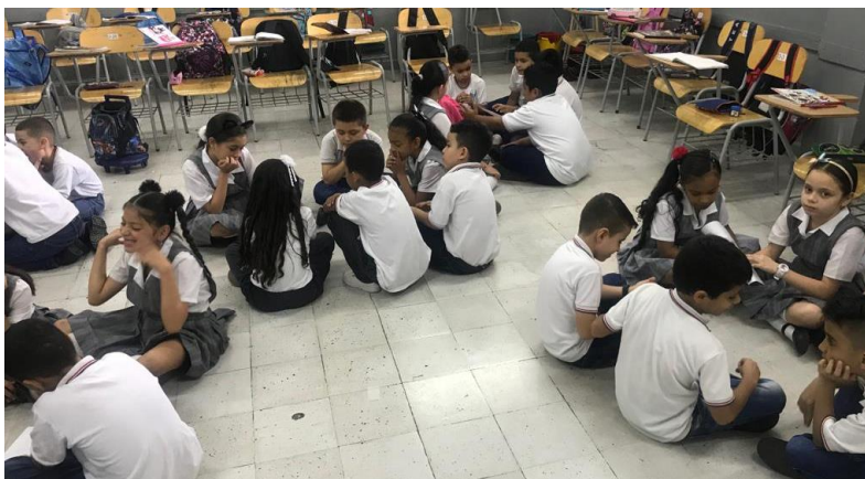
Figura 9. El cuento de la empatía.