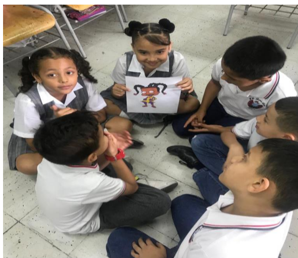
Figura 8. Describamos con amor.