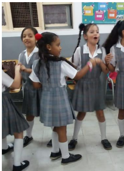
Figura 6. El baile de las emociones.