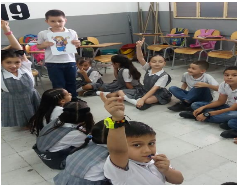
Figura 1. La telaraña.