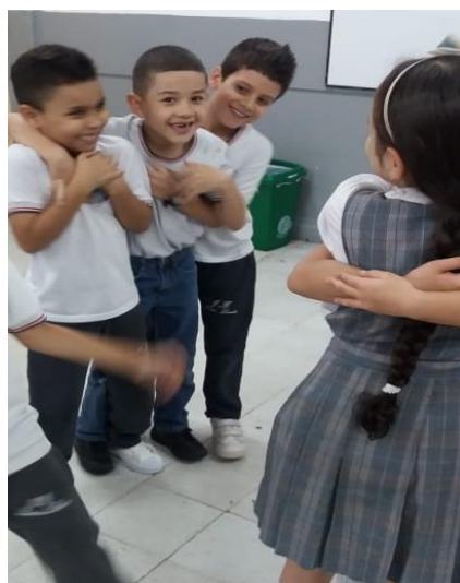
Figura 7. El baile de las emociones