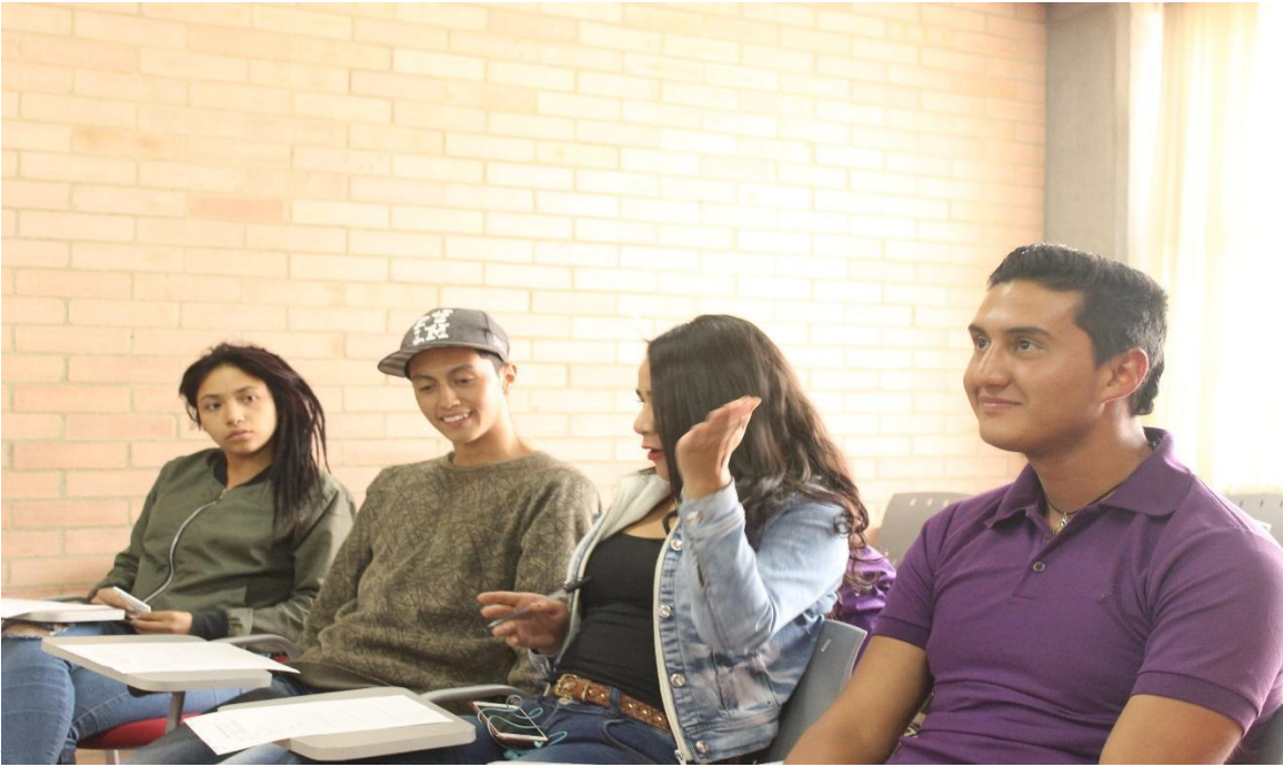
g Imagen II. Grupo focal.