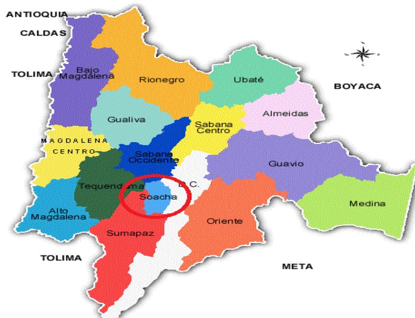
Figura 2 Mapa de ubicación del municipio en el departamento de Cundinamarca