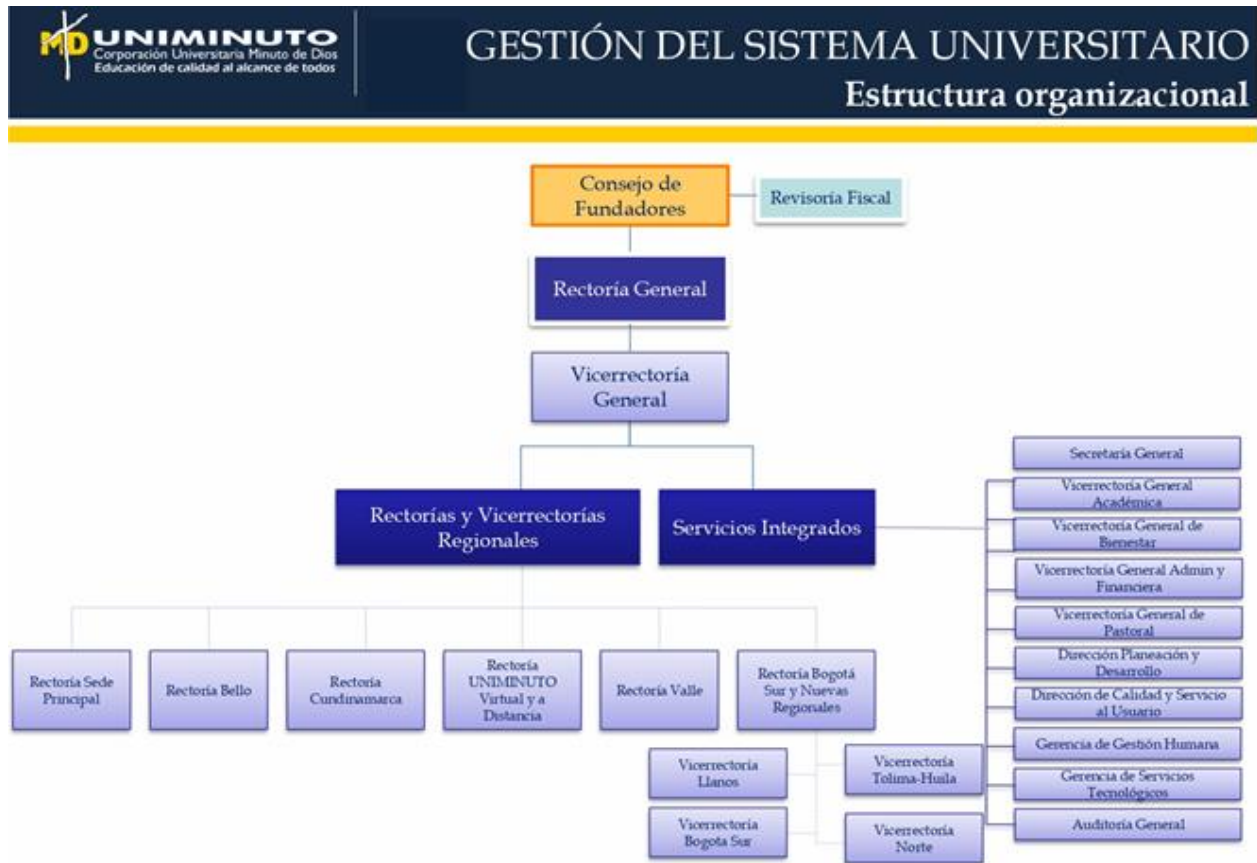
Figura 1 Organigrama Corporación Universitaria Minuto de Dios.