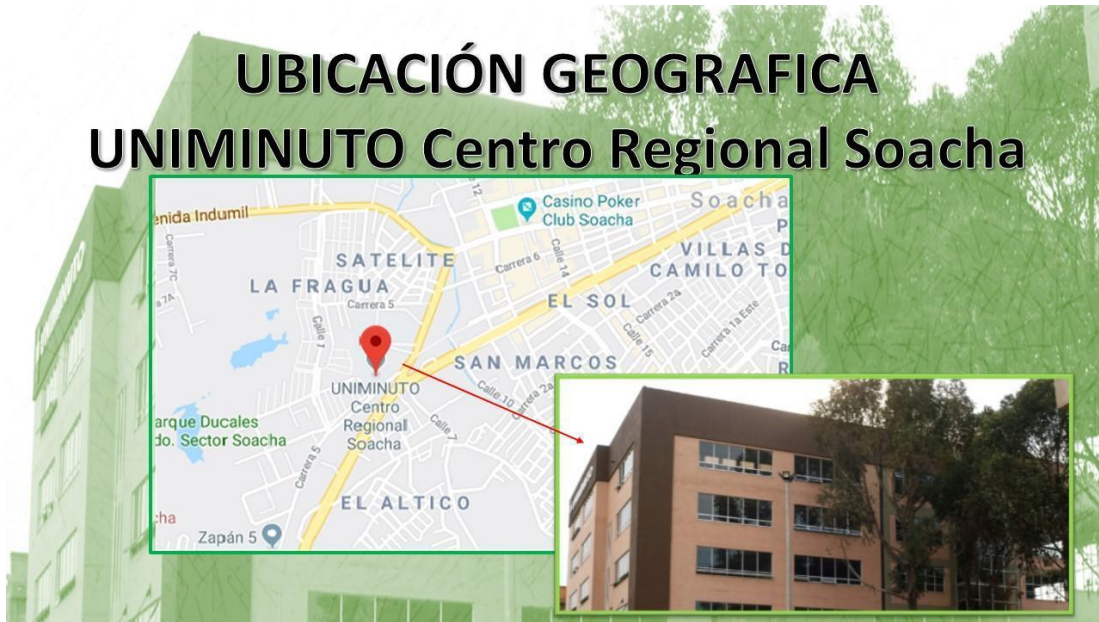
Figura 4. Ubicación geográfica Uniminuto Centro Regional Soacha.