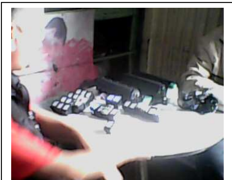
Foto3: Comercialización de mercancía

Cada uno de los análisis y de las conclusiones a las que hemos llegado en la primera fase de esta investigación se basa en el estudio del trabajo de M.A.K. Halliday (1994), principalmente porque se ocupa de los dialectos sociales en el ámbito urbano y cómo afectan la conformación de las personas.