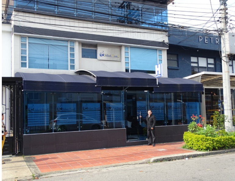
Figura 2. Fachada del Hotel Sweet Home

Actualmente cuenta con una capacidad de 20 habitaciones para hospedar un total de 52 huéspedes en habitaciones (sencillas, dobles, triples y cuádruple) como misión tiene proveer un servicio integral de hotelería de calidad y calidez a todos sus huéspedes y clientes haciendo de la excelencia su carta de presentación, instalaciones cómodas localizadas en una gran casa de barrio de 3 pisos que le dan al huésped esa sensación de llegar a casa, cada vez que ingresa a este hotel.