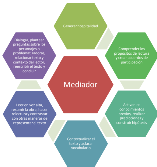
Ilustración 2. Esquema del proceso de lectura para la secuencia didáctica.

El cuento elegido por la investigadora para desarrollar los encuentros de lectura en familia se titula Paco Yunque, escrito hacia 1931 por Cesar Vallejo. Es un cuento infantil que rompió con los esquemas de su época, que posibilita que a través de la lectura profunda de la vida de unos personajes, se pueda pensar la propia vida.