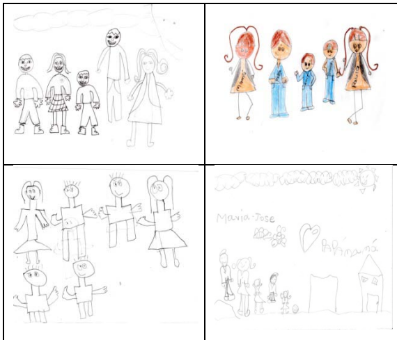
Ilustración 1. Dibujos de las cuatro familias, elaborados por los niños.

En la búsqueda de un tema central de estudio, se empezó a hacer seguimiento a cuatro familias. Algunas de las principales problemáticas psicosociales evidenciadas al interior de ellas son: la agresión física y psicológica entre sus miembros, la irresponsabilidad de uno de ellos frente a la formación de un hogar, el descuido del lugar que se habita e igualmente de la presentación personal.