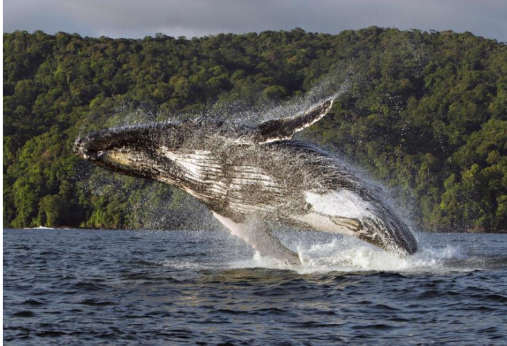
Imagen N°1.

Esta guía es una herramienta muy útil para saber cómo proceder en los recorridos que se realicen en los sitios de interés. Contiene las rutas y la duración, lo que facilita la planeación de las visitas a los diferentes puntos turísticos más destacados de la región.