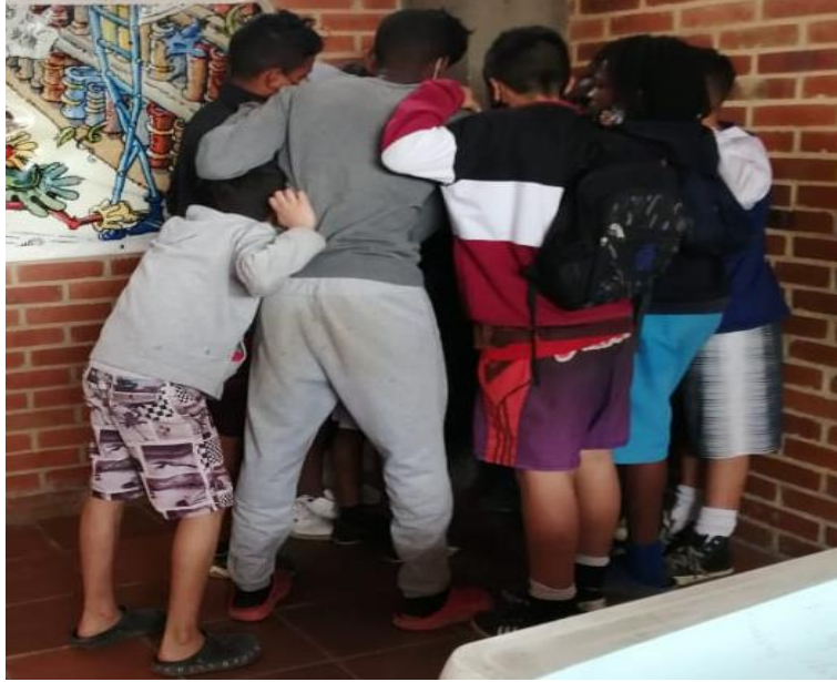
ILUSTRACIÓN 10 PARTICIPANTES ESCUELA CORINTOS DE AFRODES

Lo cual se logra evidenciar en relación a lo señalado por Hernández, Luna y Cadena, (2017), debido a que establece la construcción de una cultura de paz como un reto educativo, donde pretende darse cuenta del valor de cada sujeto, que es el valor que se transmite para buscar soluciones a los conflictos, por medio de acciones destinadas a establecer una cultura desde un proceso permanente destinado a comprender y absorber las causas profundas de los conflictos, promover y finalmente crear la paz. En otras palabras, priorizar las capacidades endógenas para fortalecer la democracia, la formación de la sociedad civil, contribuyendo al propósito de reconstruir la sociedad misma y consolidar dinámicas de paz, tal como lo señala, uno de los líderes de la escuela, Javier: