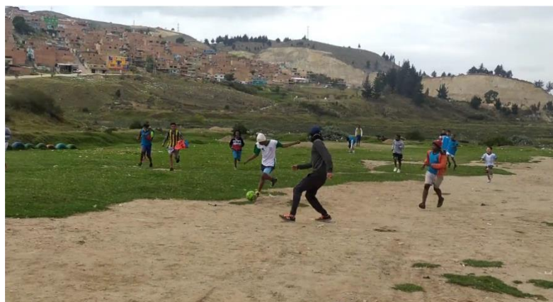
ILUSTRACIÓN 12 ESCUELA CORINTOS DE AFRODES (IMAGEN PROPIA)

tranquilos, felices, dicen como lo hicieron? y si ustedes no les cobran y ellos no están aquí obligados o el papa le está pagando, como hace él para estar aquí y estar tan felices?” (Javier, 2020)