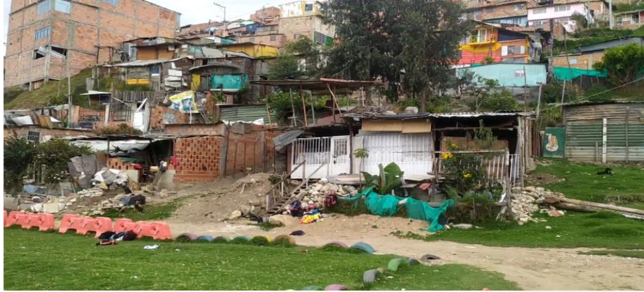
ILUSTRACIÓN 5 SECTOR RINCÓN DEL LAGO, 2020. (IMAGEN PROPIA)

A propósito de la organización comunitaria y la lucha popular dentro de los territorios, Haesbaert, Pulido y Rojas ( como se citó en Ramirez y Lopez, 2015) , exponen la importancia de la diversidad de los actores sociales, ya que, estos son quienes delimitan, controlan, construyen y configuran el territorio a partir de relaciones de conflicto, cooperación, reciprocidad y complementariedad, entendiendo qué el territorio no solo reproduce sociedad sino que se conciben relaciones sociales y estas crean a su vez territorios marcados desde la lucha por la conquista de derechos y del bienestar de la comunidad y de los diversos actores presentes.