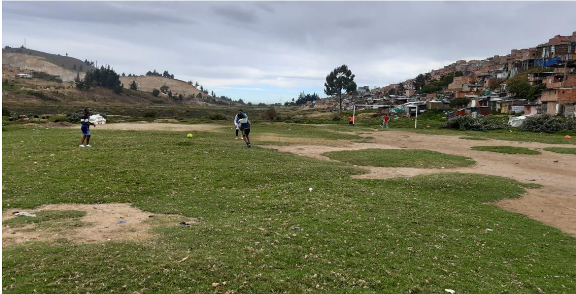
ILUSTRACIÓN 4 CANCHA DE ENTRENAMIENTO RINCÓN DEL LAGO

El territorio aparte de ser un espacio geográfico en el cual se refleja el abandono por parte del Estado por la ausencia de vías, de vivienda digna, infraestructura deportiva, centros de salud y servicios básicos, se convierte en un lugar de confluencia de actores que se encuentran en conflicto constante como en disputa por su identidad, por la tierra, por las relaciones económicas, y los grados jerárquicos que allí convergen, así mismo, se denota la presencia de múltiples culturas a causa del desplazamiento forzado, lo cual conlleva a modificar las dinámicas dentro del territorio como también a propiciar espacios organizativos y comunitarios con el fin de obtener una mayor calidad de vida por medio de la presencia y responsabilidad del Estado, ya que, los distintos gobiernos han invisibilizado este territorio bajo el pretexto de ser un barrio o lugar en estado de invasión, generando un abandono estatal profundo, limitando el acceso a servicios básicos, a una mejor infraestructura vial, al acceso a viviendas dignas. Esta falta de reconocimiento gubernamental ha propiciado la organización social y barrial con el fin de exigir sus derechos por el motivo de ser humanos, ciudadanos y unas víctimas más del Estado.