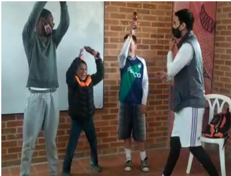
ILUSTRACIÓN 8 “Grupo N°1 socio-drama realizado con participantes Escuela Corintos de AFRODES, Biblioteca la isla”

“GRUPO N°2 SOCIO-DRAMA REALIZADO CON PARTICIPANTES ESCUELA CORINTOS DE AFRODES, BIBLIOTECA LA ISLA”