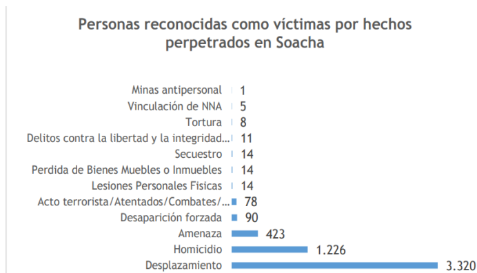
ILUSTRACIÓN 1

La configuración urbana del municipio ha estado directamente relacionada con el desenvolvimiento y las consecuencias del conflicto armado o la violencia ya que es una de las principales zonas con más carga poblacional de grandes dimensiones, esto se evidencia en el plan de desarrollo de Cundinamarca 2016 – 2020 sobre población en condición de desplazamiento forzado víctima del conflicto y por la violencia económica y otros procesos migratorios. Como se evidencia en la siguiente gráfica, pues, de 5.204 personas reconocidas como víctimas por hechos ocurridos en el municipio. De los hechos registrados, el desplazamiento forzado ya sea, inter e intraurbano, los homicidios, y las amenazas, han sido los hechos más recurrentes., esta situación afecta principalmente a las poblaciones vulnerables, étnicas, indígenas, desplazadas, migrantes, desempleadas, víctimas del postconflicto y población con bajos niveles de escolaridad, la situación es similar para todo el Departamento, pero los eventos se concentran principalmente en: Suacha, ya que el municipio acoge a más del 50% de la población desplazada de Cundinamarca.