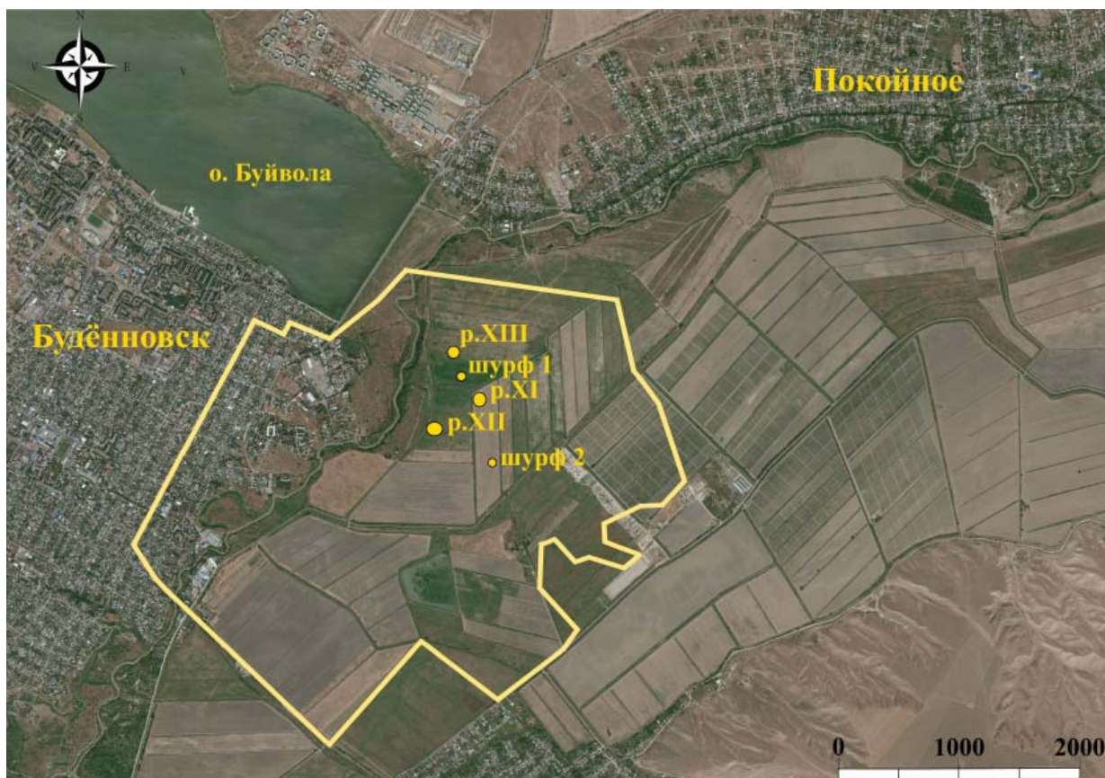
Рис. 2. План Маджарского городища с нанесением раскопов и шурфов, исследованных археологической экспедицией «Каффа»