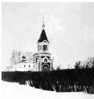
Рис. 10. Георгиевская церковь с колокольней (начало XX века)

Для удовлетворения духовных потребностей жителей Коннозаводской слободы в 1848 году ближайший к дому управляющего жилой флигель был перестроен в здание белокаменной церкви, освященной в честь Георгия Победоносца (Георгиевская церковь). В начале XX века рядом с ней из красного кирпича была возведена двухъярусная колокольня, решенная в эклектичном стиле конца XIX века и завершавшаяся легким шатром (рис. 10) [О Починках ..., 1997, с. 40, 48].