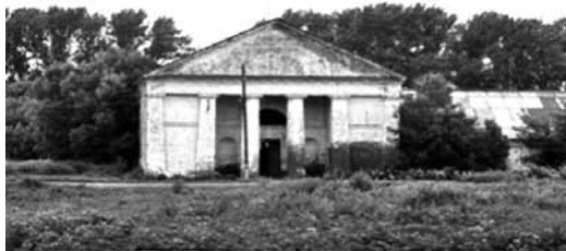
Рис. 7. Торец манежа (2009 год)

Торцовый фасад прямоугольного в плане большого манежа представлен в виде четырехпилястрового портика с треугольным фронтоном. В центре находилась ниша, оформленная двумя колоннами (рис. 7) [Материалы ...].