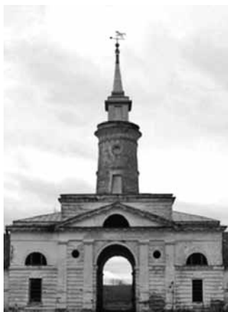
Рис. 4. Центральные ворота (2009 год)