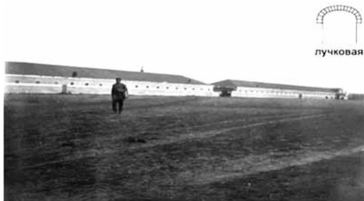
Рис. 6. Южная линия конюшен (начало XIX века, фотография Е. Ф. Гетлинга)

Торцовый фасад прямоугольного в плане большого манежа представлен в виде четырехпилястрового портика с треугольным фронтоном. В центре находилась ниша, оформленная двумя колоннами (рис. 7) [Материалы ...].