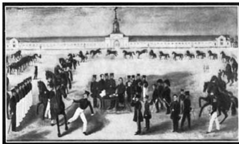
Рис. 3. Конюшни Починковского конного завода (рисунок середины XIX века)