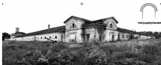
Рис. 5. Восточная линия конюшен (2009 год)