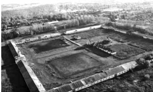
Рис. 2. Вид Починковского конного завода сверху (2009 год)