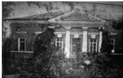
Рис. 9. Дом управляющего конным заводом (начало XX века)

Рядом с ним находились два деревянных флигеля для заводской канцелярии, которые сгорели во время пожара 29 сентября 1855 года [ГУ ЦАНО, ф. 2013, оп. 602, д. 2116, л. 24 об.]. К югу от западного флигеля располагался лазарет, представлявший собой вытянутое перпендикулярно улице каменное одноэтажное здание с рядами больших окон с полуциркульными завершениями. В XX веке при нем функционировала лаборатория [Материалы ...; Махаев].