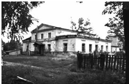
Рис. 8. Внешний облик одной из казарм (2009 год)

В 1791 году Коннозаводская слобода состояла из двух улиц, расположенных вдоль реки Рудни параллельно друг другу, с домами служащих и казармами [РГАДА, ф. 1356, оп. 1, д. 2762, л. 1 об.; Илюшечкин, 1997, с. 19]. В 1823 году казармы были отремонтированы, в дополнение к ним построили еще пять жилых флигелей, представлявших собой небольшие одноэтажные здания в пять окон по главному фасаду и с трехколонными мезонинами. Они образовали улицу, перпендикулярную уже существовавшей застройке (рис. 8) [Материалы ...].