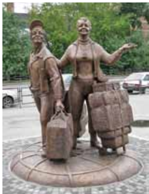
Рис. 1. Памятник «Челнокам» на вокзале г. Екатеринбурга

этапом зарождения и становления цивилизованного потребительского рынка в России. И это правильная постановка вопроса, так как говорить о функционировании полноценного потребительского рынка в хронически дефицитной экономике СССР было бы явным преувеличением.