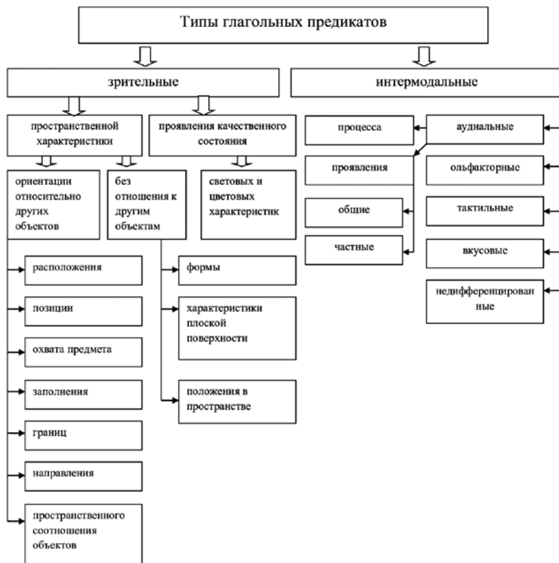
Рис. 1. Классификация глагольных предикатов описания

Представить классификацию глагольных предикатов можно в виде схемы (рис. 1).