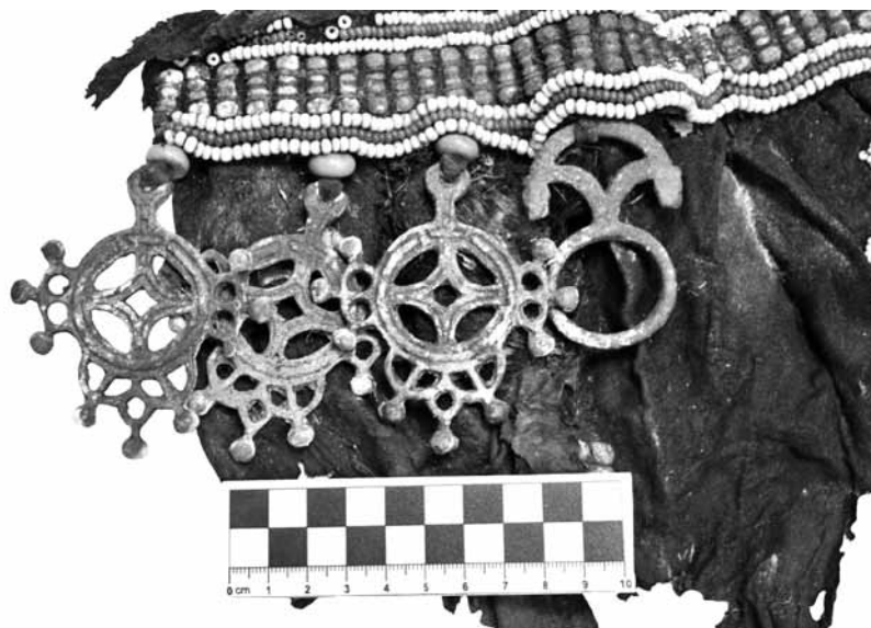
Рис. 2. Бисерная опояска и металлические подвески

рые также идентичны с подвесками нагрудника из Оленекского музея [ОИ-ЭМНС № КП Б 8412345]. Шесть — ажурные в виде колец, внутри которых находится сквозная фигура ромба, а сами кольца с трех сторон украшают трехконечные ажурные спайки с шарообразными концами (рис. 2). Сохранившаяся нижняя часть одежды на обеих половинах переда сохранила по одному бисерному орнаменту, который очень часто встречается в отделке одежды XVII—XVIII веков и описывается М. М. Носовым как «перевернутые сердечки, продолжения сверху которых перекрещиваются и образуют ромбики» [Носов, 1988, с. 13]. В других источниках такая бисерная отделка представляется как традиционный мотив «ынахсыт», который мог быть связан с культом плодородия и использован в одежде как знак благословления и благопожелания : «чтобы скот в будущем размножался» [Мир древних ..., 2013, с. 13; Петрова, 2006, с. 30]. Аналогичные вышитые из бисера фигурки украшали спинку тангала из могильника Киис Тиэрбит [Носов, 2010, с. 38—39]. Снизу бисерной отделки прикреплена одна четырехконечная орнитоморфная подвеска с пятью сквозными отверстиями. Также, вероятно, деталями пальто являлись пара идентичных медных подвесок треугольной формы со сквозным ажурным орнаментом, однако места их крепления при осмотре были не ясны.