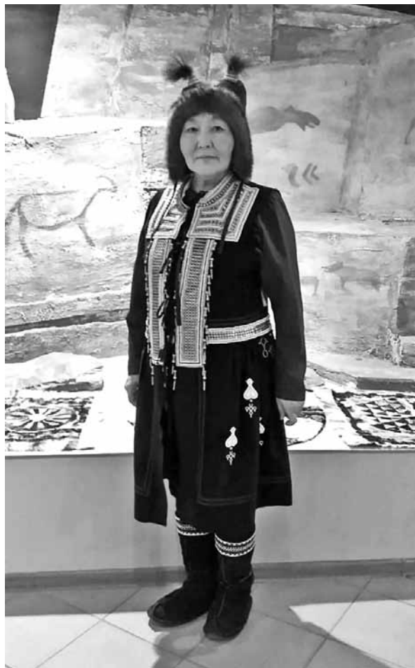
Рис. 3. Общий вид реконструированного тангалая. Мастер В. В. Никифорова

якутского «сарыы тангалая» — летней нарядной женской одежды замужней женщины. Так же, как и тангалай из ОИЭМНС, он может быть безрукавным и без меховой отделки. К отличительным чертам тангалая из погребения Ат-Дабан VI можно отнести приspущенную линию талии и узкие нагрудники.