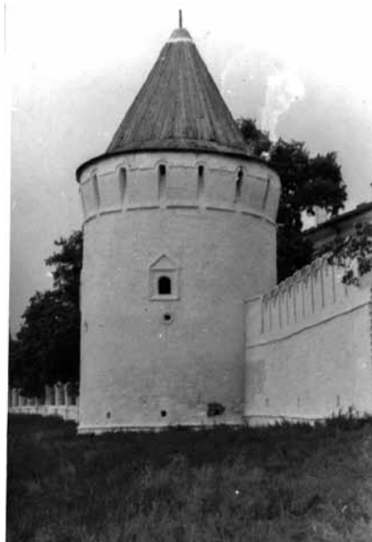
Рис. 3б. Южная башня с реконструированными круглыми бойницами и пряслем Софийского двора после реставрации

Таким образом, все кремлевские стены так и не были восстановлены. Однако уже восстановлены (фактически отстроены заново) восточная квадратная и северо-восточная круглая башни, а также несколько прясел. В 2006 году конфигурация выстроенной реставраторами в 1950—1960-х годах южной стены ограды Софийского двора в очередной раз была изменена: зигзагообразный выступ у Архиерейского дома был спрямлён, и стена немного отступила к югу [Загваздин, 2018, с. 155].