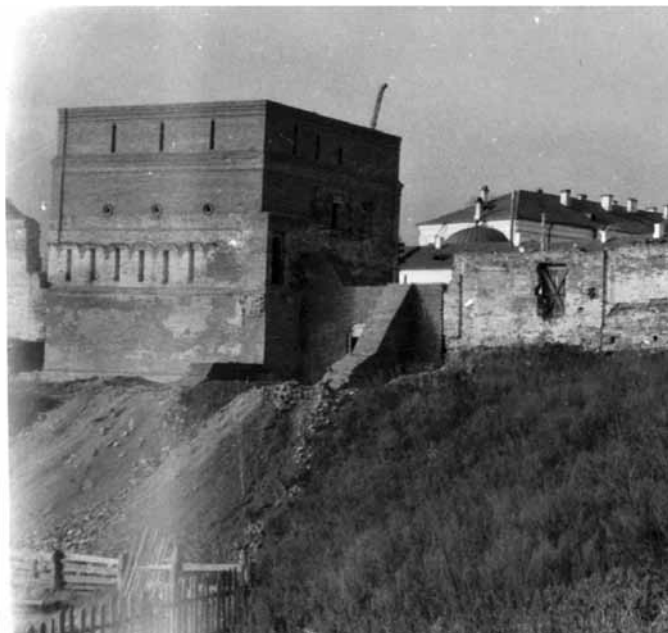
Рис. 2. Фото после реставрации 1961 года восточной квадратной башни Софийского двора с остатками стены конца XVII века на середине высоты

В самом начале XIX века в юго-западном углу ограды возвели круглую башню с большими арочными проёмами на втором ярусе; башня эта не имеет ничего общего с архитектурным стилем более ранних крепостных стен. В 1843—1845 годах архиерей В. Алявдин приказал разобрать стену ограды Софийского двора между центральными круглыми башнями южной стороны на кирпич, который пошел на строительство каменной церкви в загородной Архиерейской роще. В 1887 году обрушилась юго-восточная башня, руины тут же разобрали на кирпич. В XIX веке снесли и северную стену Софийского двора. Только раскопки позволили обнаружить места, где раньше стояли три круглые и одна квадратная башня западной стены и квадратная северо-восточная башня [Кочедамов, 1963, с. 90—92, 133, 144].