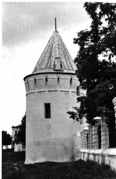
Рис. 3а. Южная башня и участок ограды Софийского двора до реставрации