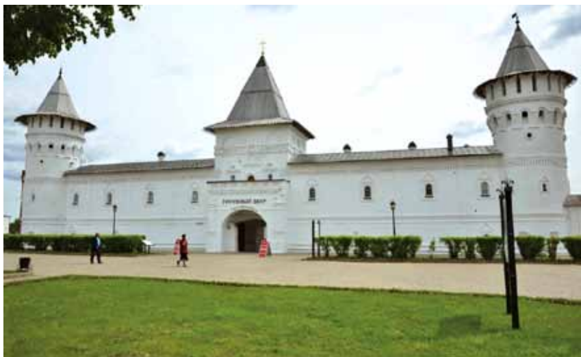
Рис. 5. Западный фасад Гостиного двора.

С позднейшими перестройками и реставрациями, но относительно оригинальными, дошли до нас Гостиный двор и Рентерея. Сегодня наиболее впечатляющим крепостным сооружением Тобольска выглядит Гостиный двор (рис. 5). Однако если мы посмотрим на его фотографии до реставрации, то увидим на них вполне мирное казенное сооружение с большими окнами и без возвышающихся башен [Кочедамов, 1978, с. 168].