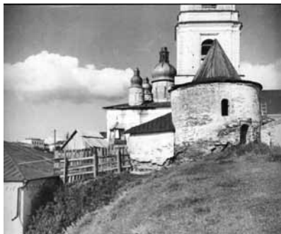
Рис. 4а. Фотография 1950-х годов. Тобольский кремль до и в процессе реставрации. Павлинская башня. Позади ее — Софийский собор и колокольня