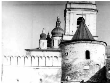
Рис. 4б. Фотография 1950-х годов. Пряло Тобольского кремля, Павлинская башня в процессе реставрации

С позднейшими перестройками и реставрациями, но относительно оригинальными, дошли до нас Гостиный двор и Рентерея. Сегодня наиболее впечатляющим крепостным сооружением Тобольска выглядит Гостиный двор (рис. 5). Однако если мы посмотрим на его фотографии до реставрации, то увидим на них вполне мирное казенное сооружение с большими окнами и без возвышающихся башен [Кочедамов, 1978, с. 168].