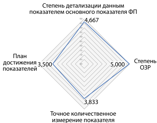
Рисунок 1. Лепестковые диаграммы, иллюстрирующие согласованность мнений экспертов для дополнительных (процессных) показателей).

Доля пациентов с СД1 и СД2, нуждающихся в заместительной почечной терапии, от всех пациентов с СД1 и СД2, имеющих ХБП, процент