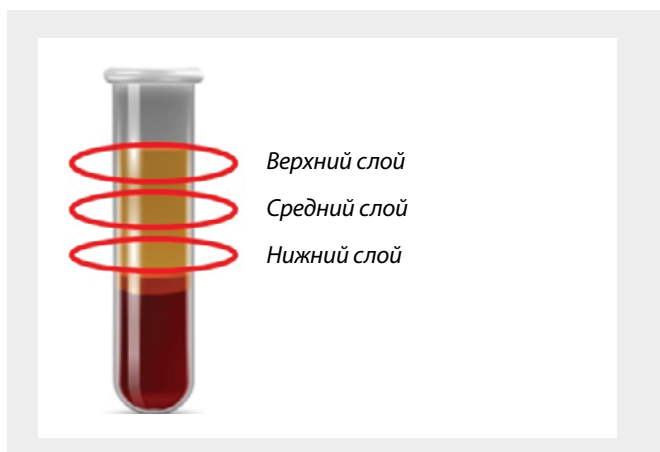
Рисунок 1. Области для отбора проб обогащенной тромбоцитами плазмы после центрифугирования образцов Figure 1. Areas for sampling platelet-rich plasma after sample centrifugation

из слоев после центрифугирования. Подсчет клеточных элементов крови проводился в камере Горяева и по методу Фонио, в дальнейшем вычислялся интегральный показатель по двум методам.