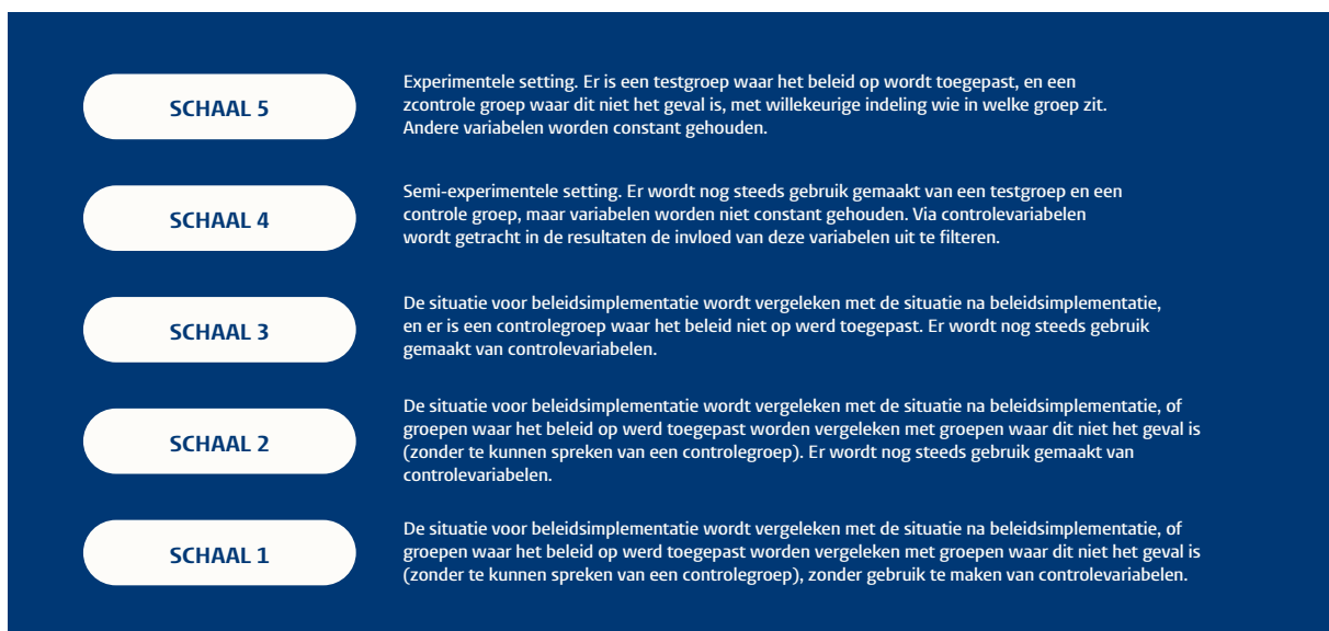
Figuur 3: een visualisering van de Maryland Scientific Methods Scale.

Hoewel ex durante en ex post evaluaties niet het onderwerp uitmaken van deze handreiking, is het belangrijk om bij de ex ante evaluatie al te gaan nadenken over het type evaluatie die men na de ex ante evaluatie wil uitvoeren, omdat dit invloed heeft op de