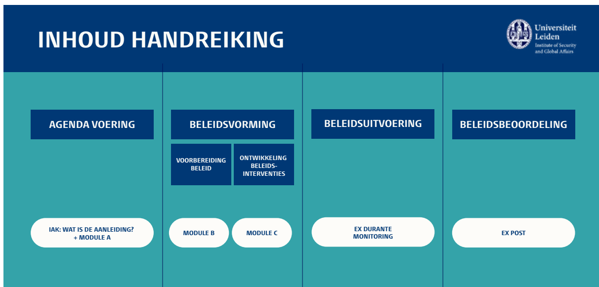
Figuur 1: relatie tussen de beleidscyclus en de handreiking

In deze handreiking worden de verschillende modules onder elkaar geplaatst, en elke module bestaat uit een aantal stappen die chronologisch wordt doorlopen. In de praktijk is het de bedoeling om alle stappen in chronologische volgorde worden doorlopen. Echter, soms is het voldoende om vast te stellen dat een stap reeds eerder werd doorlopen, bijvoorbeeld het vaststellen van redenen voor overheidsinterventie. In dat geval kunnen de argumenten worden hernomen, en hoeft de volledige oefening niet opnieuw worden gemaakt. Indien een stap echter volledig overgeslagen wordt, heeft dit een impact op het nut van de ex ante evaluatie.