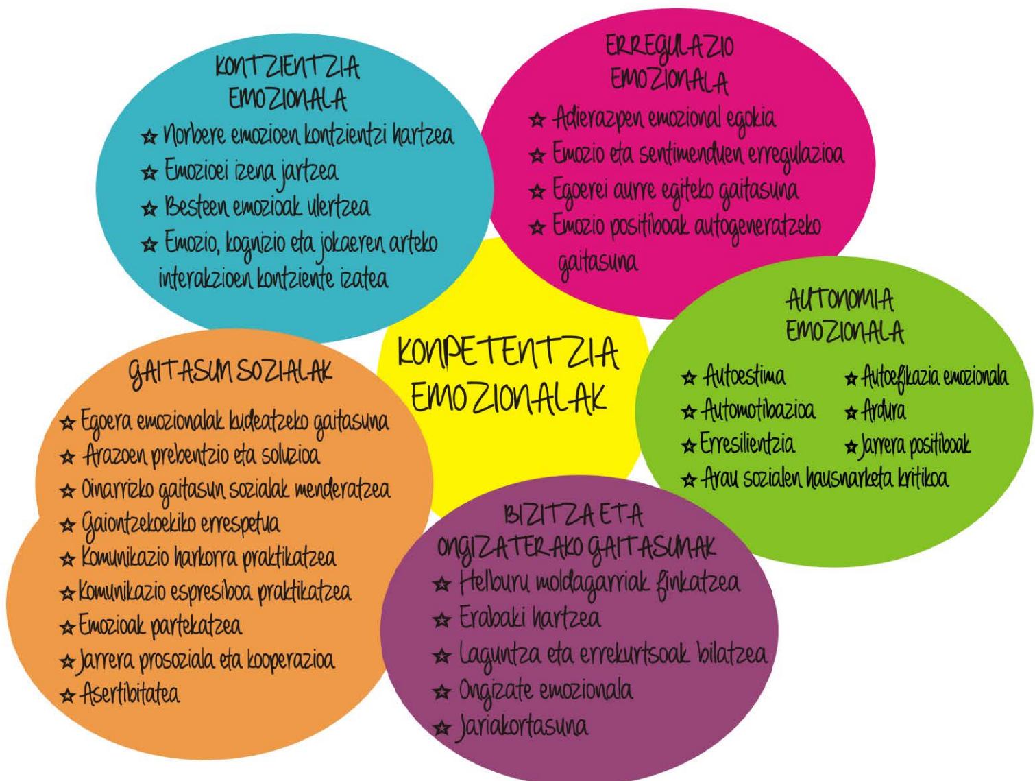
Irudia 2: Kompetentzia Emozionalak Bisquerra (2016)

Kompetentzia emozionalen eredu hau, autore ezberdinek landu izan dute; ondorengo irudian Bisquerra-k (2016) aurkezten duen proposamen bat ageri da, Goleman-en teoriari jarraiki, kompetentzia bakoitzaren barruan mikro-kompetentzia batzuk aurkezten dira: