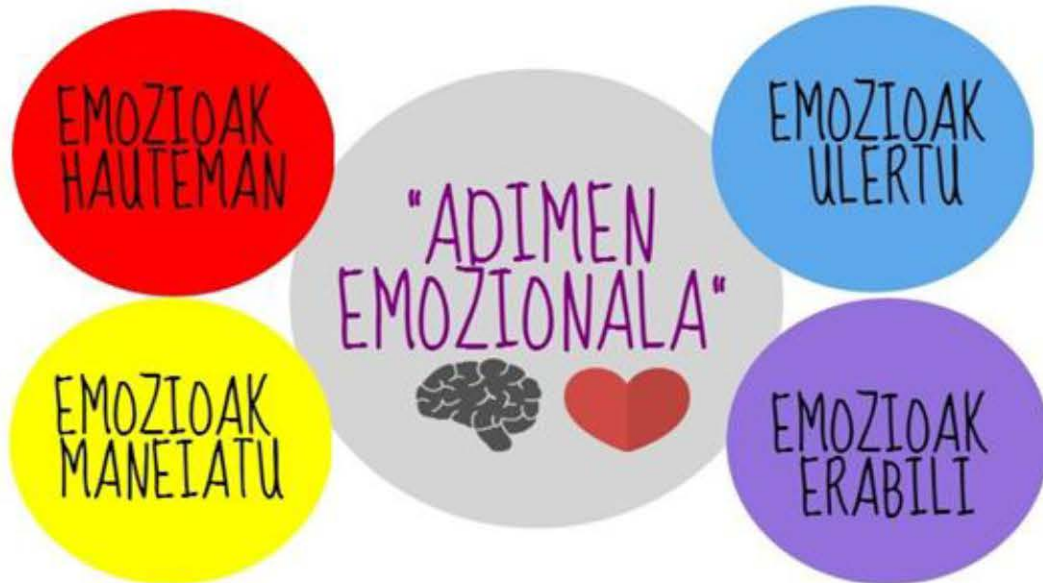
Irudia 1: Adimen Emozionalaren gaitasunak.

ezagutzeko gaitasuna; hirugarrena, emozioak erregulatzeko gaitasuna; eta azkenik, pentsamendua errazteko emozioak aurkitzeko edo sortzeko gaitasuna.