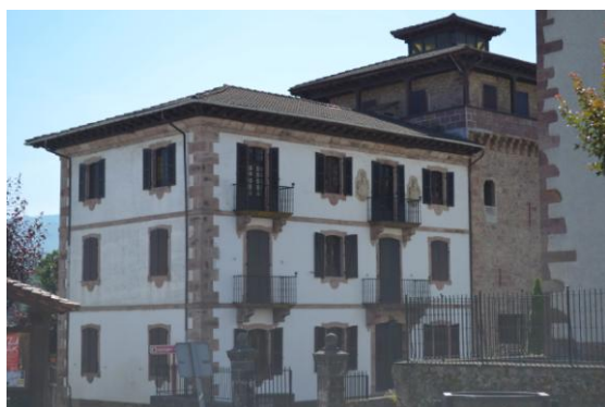
Irudi 6. Jauregizuria