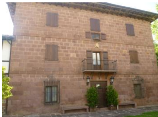
Irudi 5. Apeztegia