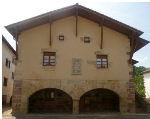
Irudi 4. Arretxea