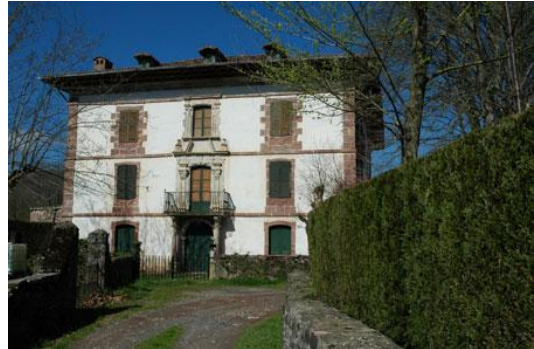
Udaletxeko web orri ofizialetik, http://www.baztan.eus/es/ (azken bisitaldia 2015.06.23)