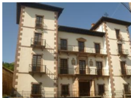
Irudi 7. Erratzuko Gaston Iriarte