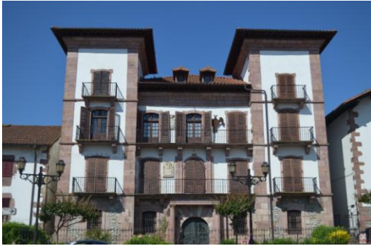
Egileak berak egina