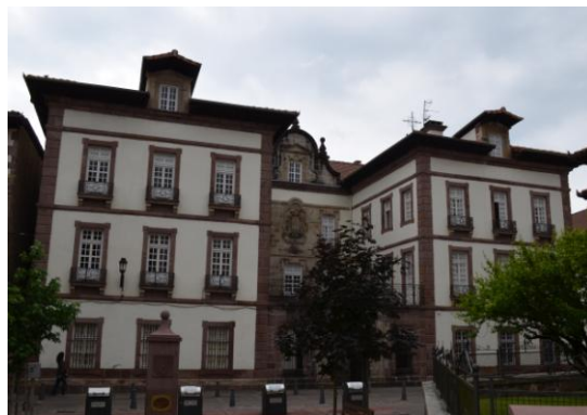
Irudi 3. Arizkunenea

Udaletxeko web orri ofizialetik, http://www.baztan.eus/es/ (azken bisitaldia 2015.06.23)