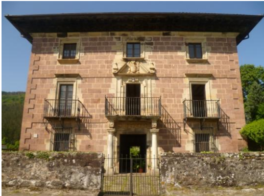
Egileak berak egina