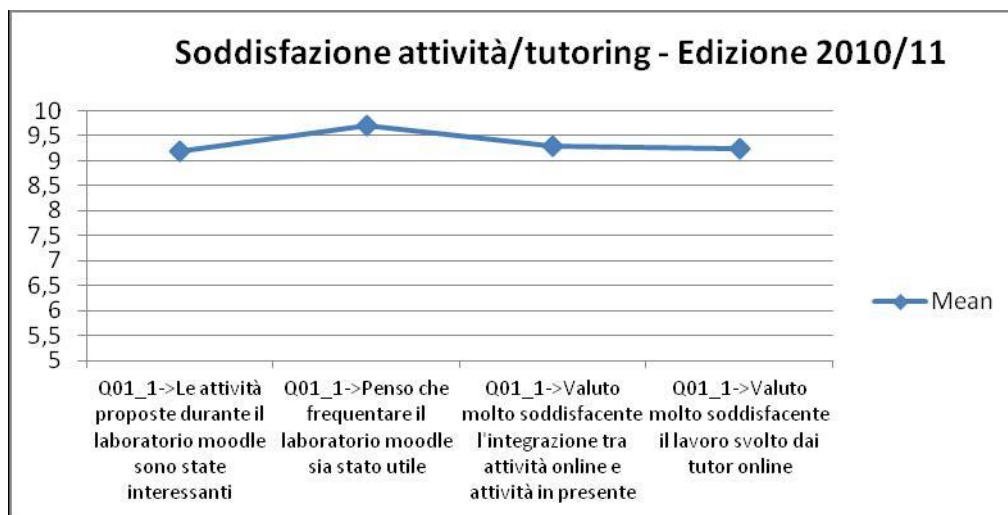
Figura 1 - Soddisfazione tutoring – Edizione laboratorio 2010/2011

Relativamente al confronto delle medie dell'analisi longitudinale si è avuto un aumento per la motivazione intrinseca (tale aspetto potrebbe essere dovuto al fatto che lo studente consolida una motivazione dovuta a fattori interni e, per esempio, si convince maggiormente della scelta universitaria effettuata o delle caratteristiche del percorso scelto) (Mason, 2006; Rienties et al., 2009; Mirisola, Benigno & Chifari, 2011), un decremento della motivazione estrinseca, un aumento dell'abilità di problem solving (tale elemento potrebbe essere favorito dalla tipologia di attività proposte e dai quesiti posti nei forum) (Mattana, 2014), così come del locus of control sia interno che esterno (Cascio, Botta, & Anzaldi, 2013) e delle abilità informatiche (Eachus & Cassidy, 2006).