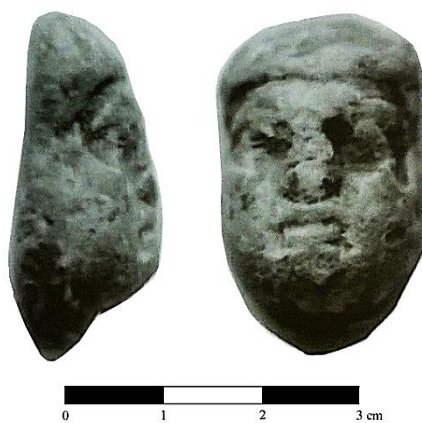
Fig. 4 - Peso in piombo configurato a testa di sileno da Amrit (da Elayi - Elayi 1997, tav. XXXVI).