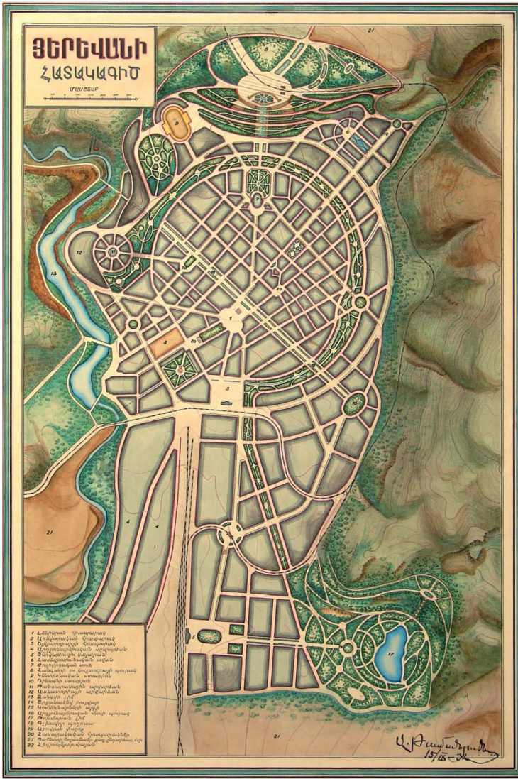
Fig. 1 - Piano Generale di Erivan, 1932. Erivan, masterplan, 1932.

Sebbene fosse stata originariamente prevista già nel piano del 1924, la sua costruzione non fu mai portata a termine; sono occorsi infatti oltre ottant'anni dal piano di Tamanian e dieci dalla fine dell'Unione Sovietica, prima che il consiglio comunale di Yerevan deliberasse in favore della costruzione del viale, avendone intuito le potenziali ricadute in termini economici e di sviluppo urbano. Al fine di realizzare la Northern Avenue conformemente al progetto originario, si sono peraltro dovuti acquisire e demolire centinaia di alloggi popolari costruiti abusivamente nell'area nel corso degli anni.