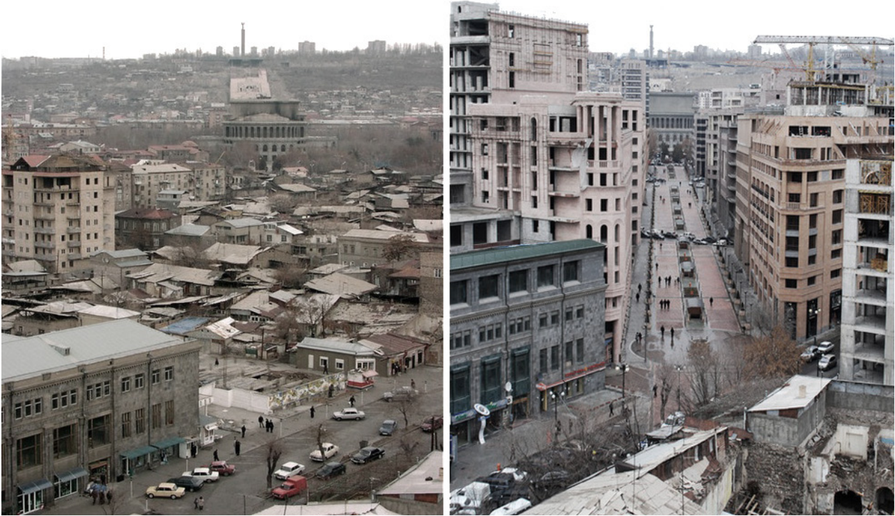
Fig. 3 - L'area della Northern Avenue prima e dopo gli interventi di ristrutturazione. The area of the Northern Avenue, before and after the intervention of urban development.

nuovi quartieri costruiti intorno a Yerevan fossero poi intitolati alle comunità decimate dai turchi nel corso del genocidio armeno, come ad esempio i distretti di Arabkir, Malatya-Sebastia e Nork Marash, che presero il nome dalle città omonime. L'apporto di Tamanian, che cercò sempre di far convivere (anche a dispetto delle indicazioni fornitegli dalle autorità sovietiche) le tradizioni nazionali con la costruzione urbana contemporanea, fu poi determinante nel trasformare la cittadina in una moderna capitale, la dodicesima dell'Armenia, prima dalla ricostituzione di un'entità statale armena indipendente.