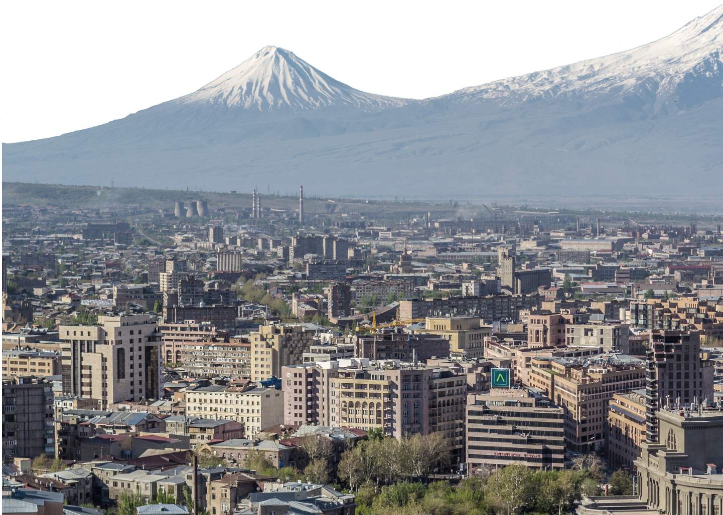
Fig. 4 - Il Monte Ararat sullo sfondo dello skyline di Yerevan. Si notino l'Opera di Tamanian, in primo piano, e gli edifici della Northern Avenue in costruzione. Mount Ararat and the skyline of Yerevan.