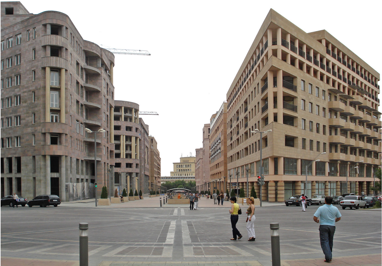
Fig. 6 - La Northern Avenue nel 2012. Northern Avenue in 2012.

in volta intravedervi. E tuttavia mai come nel caso di Yerevan, a differenza di Beirut, dove l'azione ricostruttiva di Solidère è sempre meno tollerata, gli interventi di recupero e ricostruzione stanno assumendo una forza così decisiva nello sviluppo urbano e nella rappresentazione visiva dell'identità nazionale. Mentre sullo sfondo permangono le difficoltà che da sempre questo paese fronteggia, come le tensioni con l'Azerbaigian e la memoria del genocidio, Yerevan completa solerte il piano di Tamanian, che volle che da ogni punto della sua città si potesse ammirare l'Ararat, la cui prossimità visiva è il motivo per cui, quando fu creata la Repubblica di Armenia, la città venne scelta come capitale.