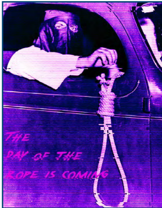
Ein Anhänger des Ku-Klux-Klans hängt eine Galgenschleife aus dem Fenster. Die zugehörige Bildbeschreibung „The Day of the Rope is Coming“ spielt auf den Tag an, an dem sogenannte „Volksverräter“ gehängt werden sollen und Rechtsextreme die Macht übernehmen.

Krieger für sein imaginiertes Volkskollektiv sein – für verunsicherte und gekränkte Männer bisweilen ein erstrebenswertes Ziel. Fashwave soll genau dieses Versprechen verbreiten und attraktiv machen. Das Appellieren an Männlichkeitsbilder ist also der integrale Bestandteil von visueller faschistischer Propaganda. 5