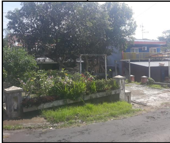
Gambar 1. Fasilitas Umum Wilayah RT 06 RW 18 Kel. Bunulrejo

Sebagai wilayah yang mandiri dalam mengelola lingkungan, PKK RT 06 RW 18 terletak di jalan Terusan Kayan Kelurahan Bunulrejo Kecamatan Blimbing kotamadya Malang mempunyai Kelompok Kerja Lingkungan dimana bentuk kegiatan yg sudah dilakukan adalah Green House: Media Budidaya Tanaman untuk Urban Farming sebagai upaya ketahanan Pangan Masyarakat (Septya dkk, 2022). Pengurus Kelompok Kerja Lingkungan terdiri dari ibu-ibu yang mempunyai pekerjaan di rumah dan sudah tertarik pada budidaya tanaman dengan memanfaatkan lahan fasilitas umum perumahan. Jenis-jenis tanaman yang dibudidayakan biasanya adalah tanaman yang memiliki nilai ekonomi tinggi, berumur pendek atau tanaman semusim khususnya sayuran (seperti seledri,caisim, pack-choy, baby kalia, cabai, terong, dan selada), dan memiliki system perakaran yang tidak terlalu luas melalui penerapan sistem bercocok tanam secara semi konvensional (menggunakan polybag/plastic recycle)