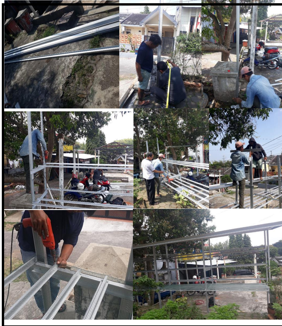
Gambar.5 Pelaksanaan pekerjaan Pembuatan & Pemasangan Rak Vertical Garden

Hasil akhir yaitu sebuah rak untuk dapat digunakan warga sebagai tempat tanaman.