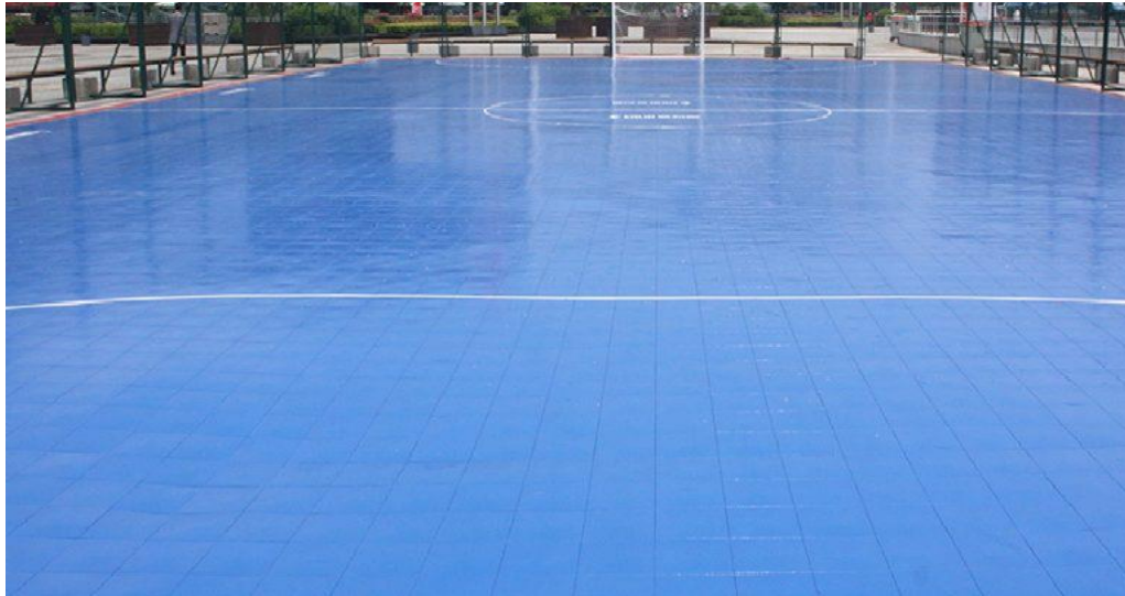
Gambar 6. Lapangan Vinyl (LapanganFutsal.id, 2017).

Lapangan futsal berjenis vinyl ini menggunakan bahan lapisan karet atau rubber sebagai material utamanya. Jenis lapangan ini menjadi salah satu jenis yang paling banyak disukai oleh pemain futsal karena lapangannya berjenis vinyl sangat bagus untuk aliran bola, tingkat kerataannya cukup tinggi serta tekstur lapangan yang terbilang cukup empuk. Hanya saja tingkat ketahanan lapangan jenis vinyl tidak terlalu baik karena dapat mengelupas jika digunakan dalam rentang waktu yang lama. Berikut ini beberapa kelebihan dan kekurangan lapangan futsal vinyl.