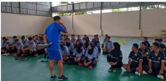
Gambar 3. Pertemuan pertama (Pekan Kedua)