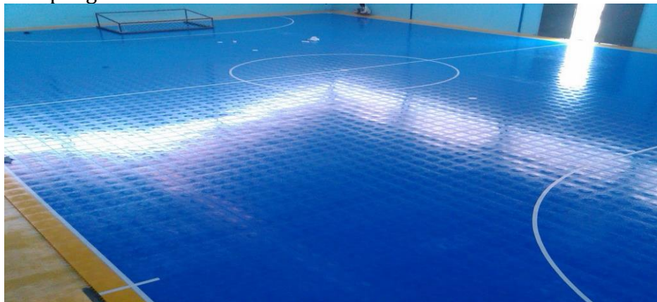
Gambar 10. Lapangan Plastik Interlock (LapanganFutsal.id, 2017).