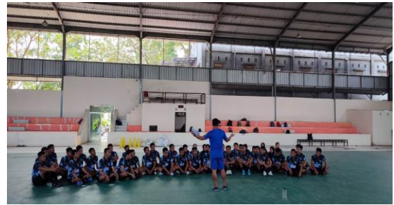
Gambar 2. Pertemuan kedua (Pekan Pertama)