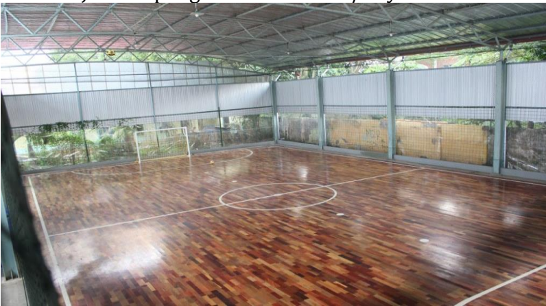
Gambar 8. Lapangan Parket/kayu (LapanganFutsal.id, 2017).

Jenis lapangan futsal Parket/Kayu lebih populer di daerah Eropa dan Amerika Latin, sedangkan di Indonesia akurang begitu populer. Di Indonesia Parket/Kayu lebih dikenal dengan 'kayu'. Biasanya material Parket/Kayu ini digunakan sebagai alas lapangan futsal dalam Gelanggang Olahraga (GOR). Parket/Kayu memiliki tingkat kekesatan yang sangat tinggi, sehingga kemungkinan pemain terpleset kecil. Dari sisi kerataannya material Parket/Kayu ini memiliki efek yang bagus bagi laju bola. Berikut beberapa kelebihan dan kekurangan lapangan futsal bermaterial Parket/Kayu.