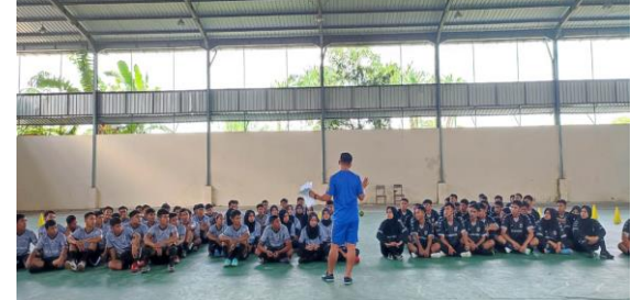
Gambar 4. Pertemuan Kedua (Pekan Kedua)

Futsal adalah permainan yang bisa di lakukan di setiap tempat yang mempunyai lapangan berukuran kecil minimum panjangnya 25 meter dan lebarnya minimum 16 meter. Salah satu kelebihan futsal adalah bisa di mainkan di lapangan kecil yang bisa di modifikasi