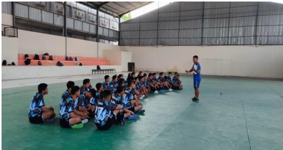
Gambar 1. Pertemuan pertama (Pekan Pertama)

Berdasarkan permasalahan mitra, yakni mahasiswa Fakultas Ilmu Keolahragaan, Universitas Negeri Makassar belum mengetahui tentang pengetahuan jenis lapangan futsal yang umum di gunakan dalam permainan futsal di Indonesia yang biasa di gunakan, maka pemateri menjelaskan tentang jenis jenis lapangan yang biasa di gunakan dan jenis jenis lapangan yang ada namun jarang di gunakan di indonesia sehingga peserta mampu memahami dan menjadikan referensi terkait dengan lapangan futsal. Kelak nantinya apa yang diberikan pada saat pelatihan dapat digunakan dan di aplikasikan baik itu dalam pelatihan maupun pada saat memberikan materi tentang futsal, dengan begitu apa yang di harapkan sebagai pengajar atau dosen dapat menjadi ilmu yang bermanfaat. Hasil pelaksanaan kegiatan pengabdian secara keseluruhan dapat dilihat berdasarkan beberapa komponen berikut ini: Meningkatnya pengetahuan dan pemahaman mahasiswa Fakultas Ilmu Keolahragaan tentang jenis jenis lapangan yang biasa di gunakan dalam permainan futsal, adanya referensi yang bisa digunakan nantinya terkait dengan jenis lapangan dalam hal pembuatan, ilmu yang bermanfaat sebagai dasar untuk di pergunakan nantinya dalam mengajar ataupun melatih.