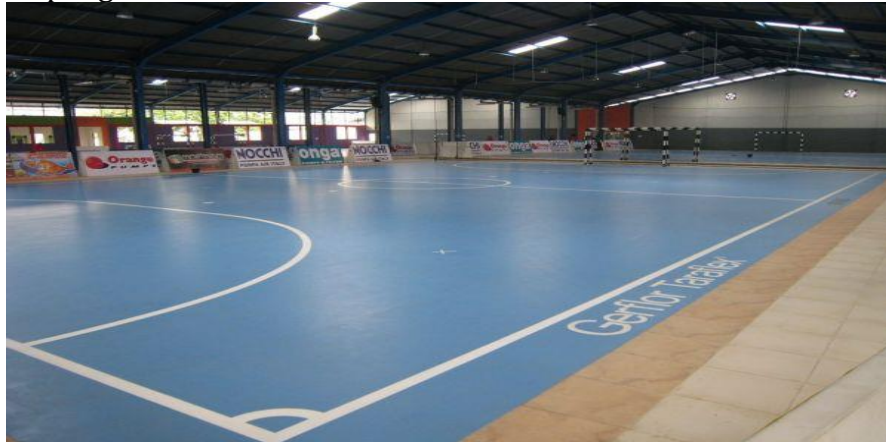
Gambar 9. Lapangan Taraflex.

Jenis lapangan ini sekilas hampir sama dengan Parket/Kayu hanya saja Taraflex bahannya dari polyethylen atau biji plastik yang dipadatkan. Berikut beberapa kelebihan dan kekurangan lapangan futsal taraflex.