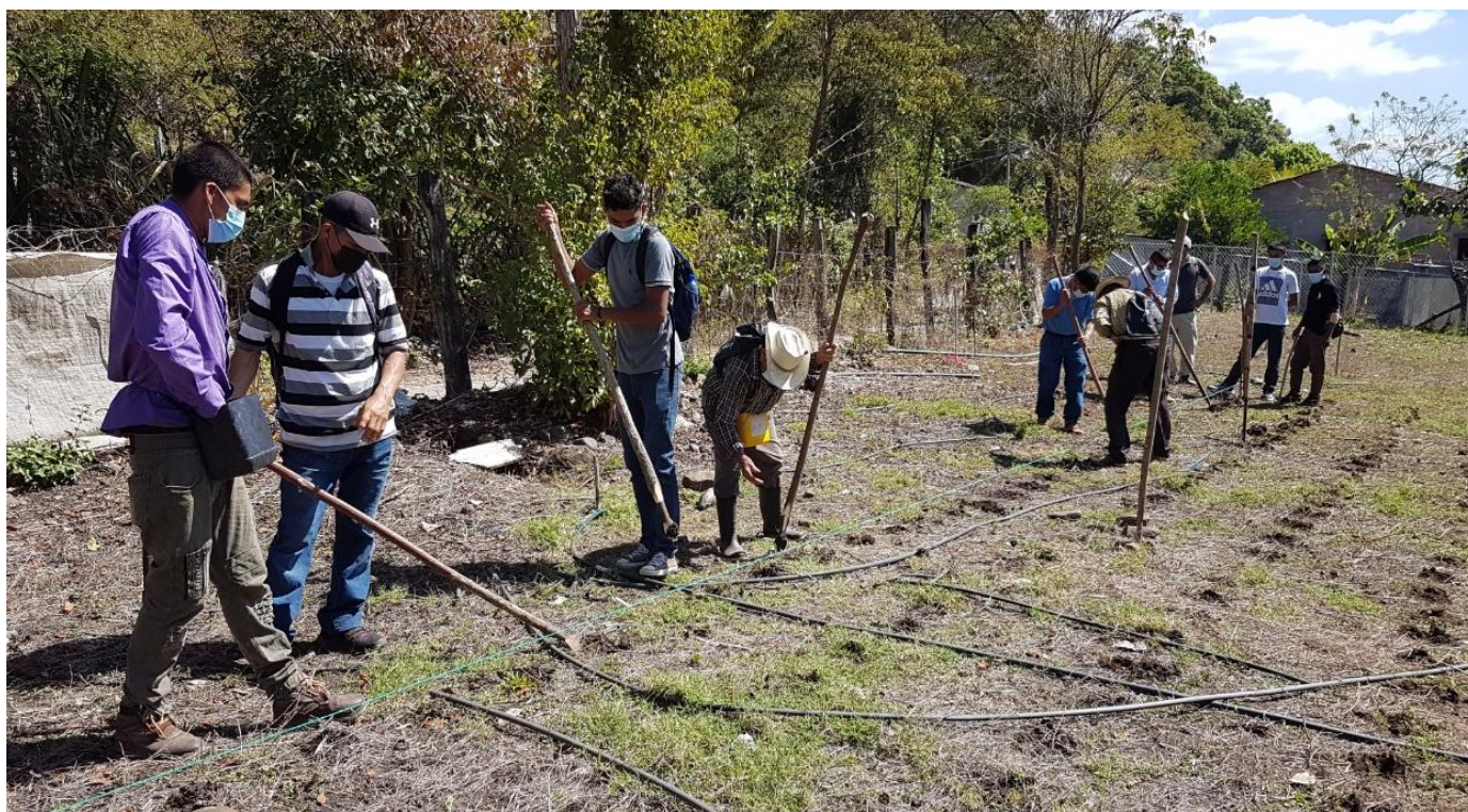
Ilustración 3 - Establecimiento de parcelas pareadas para la promoción de buenas prácticas agrícolas, con promotores agrícolas del municipio de Chilanga.

Los recursos humanos directamente involucrados son: 3 técnicos de la Unidad Ambiental Municipal, 1 promotor de la municipalidad de Chilanga (período 2019 – 2020) y 18 promotores(as) comunitarios(as). Adicionalmente están las y los especialistas, funcionarios de ONG, alcaldes y la empresa de Agua, que participan en la toma de las decisiones estratégicas del FOAG.