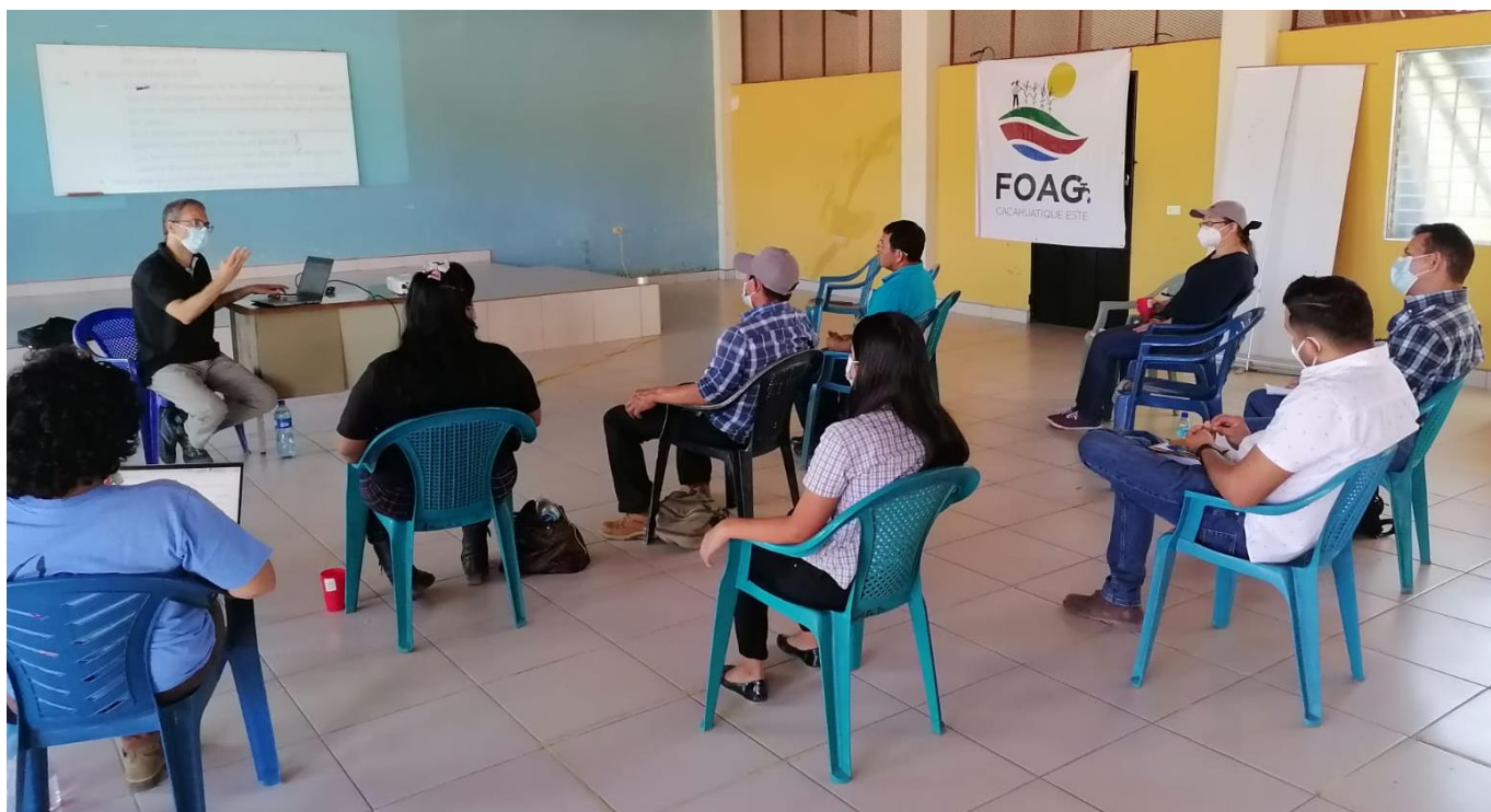
Ilustración 2 - Reunión con representantes de alcaldías, asociaciones de desarrollo comunitario, juntas de agua y ONGS que conforman el FOAG, en San Francisco Gotera.