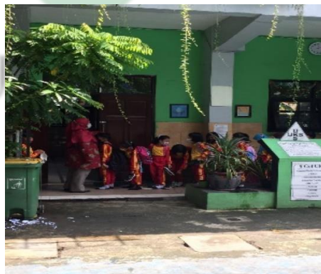
Gambar 4.3 Siswa-siswi menggunakan handsainitizer yang diberikan oleh guru sebelum masuk kelas