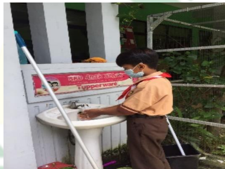
Gambar 4.2 Tempat cuci tangan dilapangan