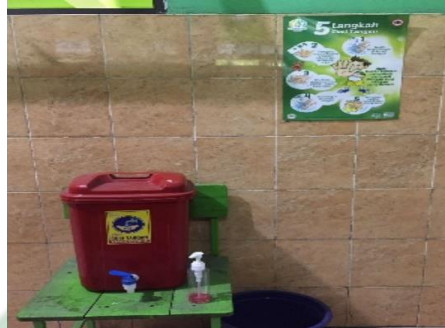
Gambar 4.1 Tempat cuci tangan didepan kelas

setiap kelas, menyediakan tempat cuci tangan di depan gerbang, di lapangan serta di depan pintu kelas.