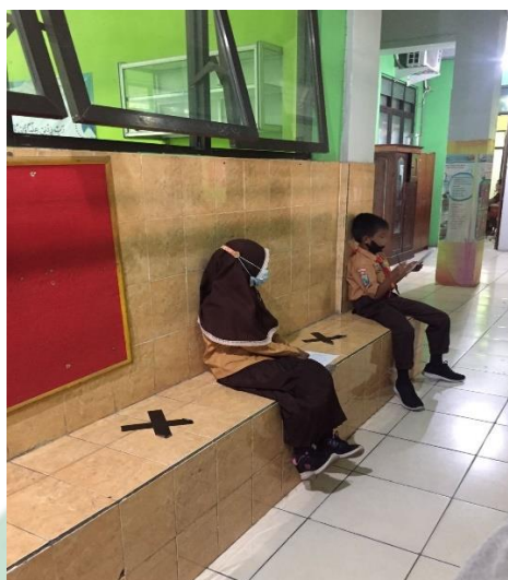
Gambar 4.4 Siswa-siswi menjaga jarak