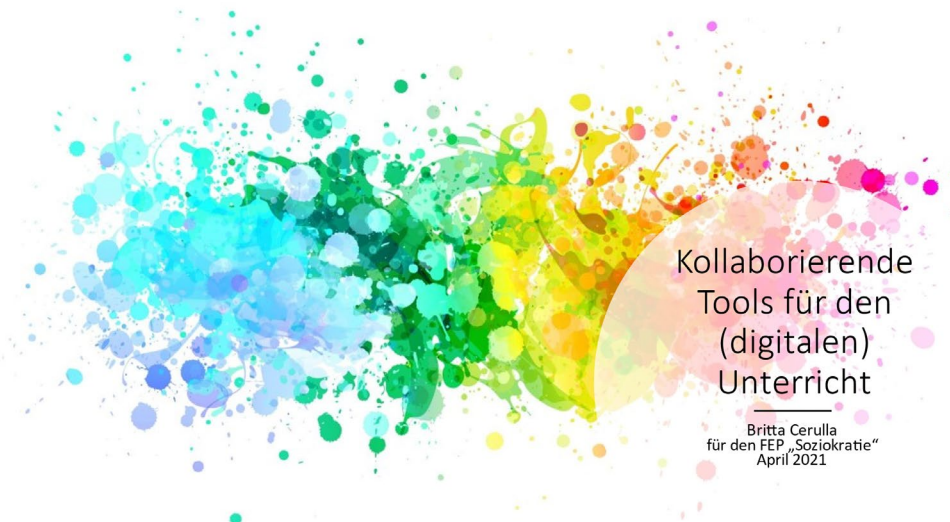
Abbildung 2: Soziokratischer Happen 2 – Kollaborierende Tools für den (digitalen) Unterricht

Als zweiten Impuls wollten wir den Kolleg*innen neue Ideen für demokratische, partizipative Tools geben, die sie mit wenig Einarbeitungszeit und Vorwissen direkt in ihre digitale Praxis einbauen konnten (siehe Abbildung 2). Hierzu gab es bereits eine Stufensitzung in der Stufe III/IV und die Absicht, dies auch in der Stufe I/II vorzustellen. Diesen Plan machte wieder die Pandemie zunichte. Es gab schlicht keine gemeinsame Sitzung, auf der Raum für die Vorstellung war. Die Organisation und Durchführung von Distanzunterricht hatten die höhere Priorität.